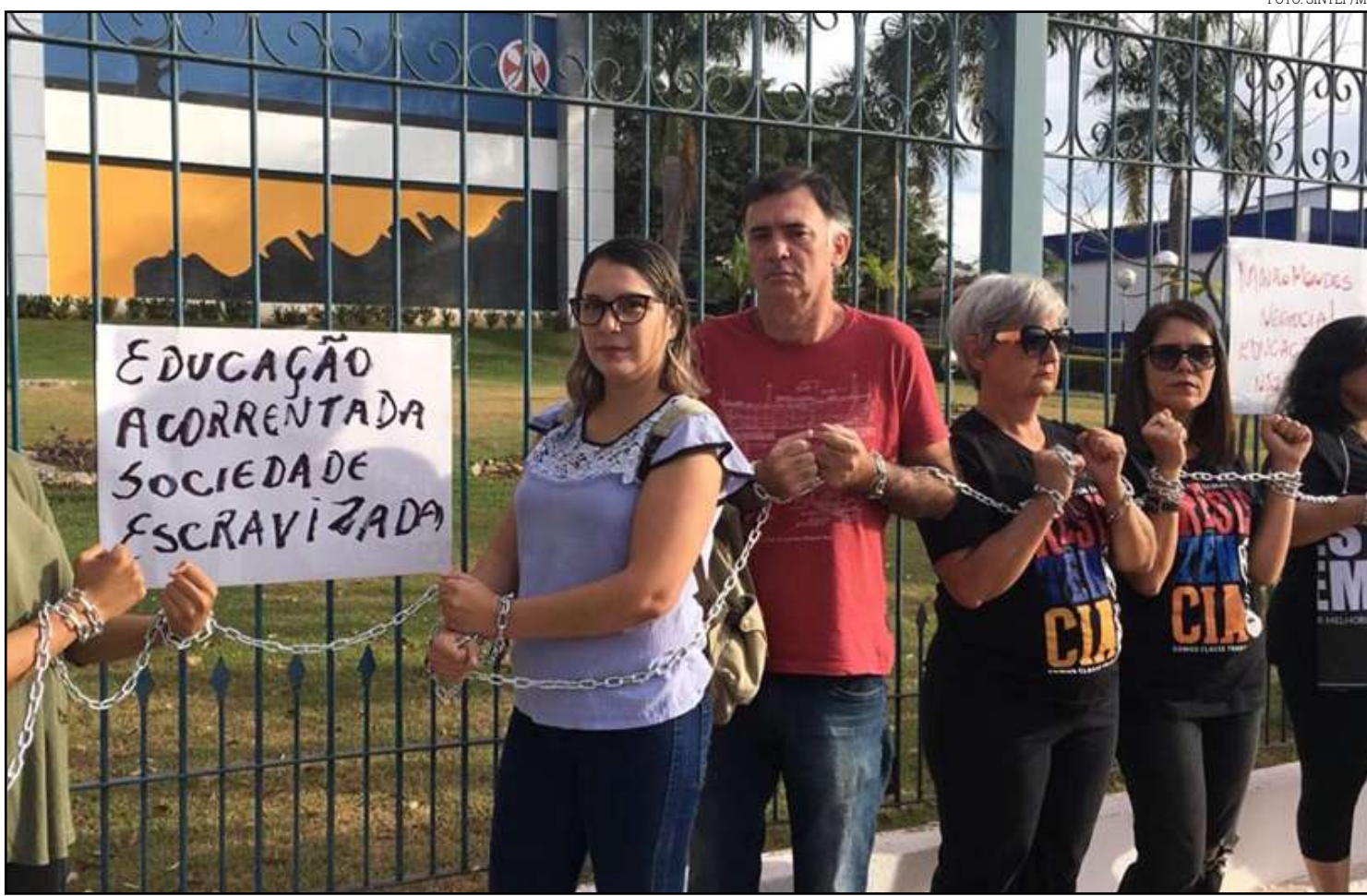
Há dois meses sem salários, exigem proposta

"Atualmente, o Estado já está com o limite da LRF extrapolado, pois gasta 58,55% de suas receitas com o pagamento dos servidores. Se concedesse o aumento de mais 7,69% aos salários de milhares de professores estaduais, o limite seria estourado de forma irreversível, uma vez que resultaria em gasto adicional na ordem de R$ 200 milhões neste ano - valor que o Estado já não dispõe", diz a nota.