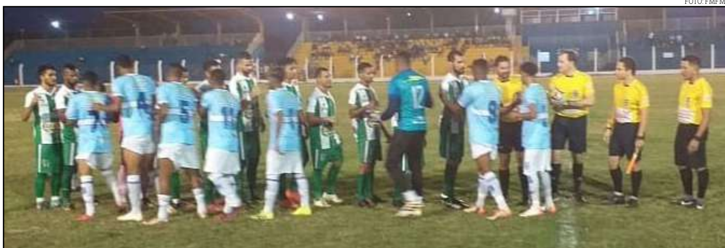
Sorriso garantiu empate com o Cacerense