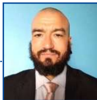
POR LEANDRO CARECA

Imaginar um sistema operacional da abrangência do Android, desenvolvido por uma empresa privada, como sendo totalmente grátis, é uma ideia que não se encaixa nos moldes sustentáveis do capitalismo. Alguma forma de receita deve existir, caso contrário, não tem como haver um produto.