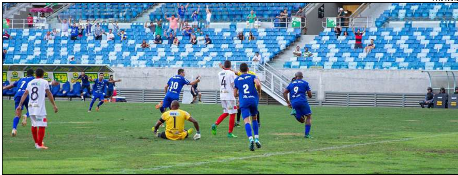
Nova Mutum bateu o Ação na Arena Pantanal

Na próxima rodada, o Cacerense folga, voltando a jogar no outro fim de semana quando enfrentará o Ação na Arena Pantanal.