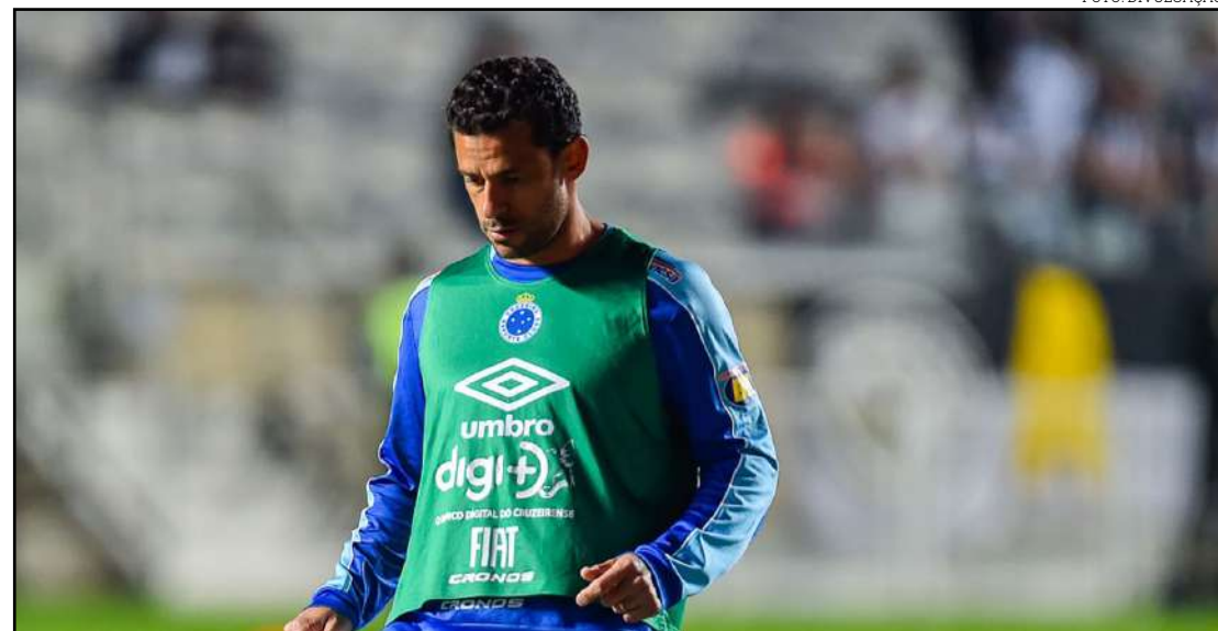
Atacante desfalca o Cruzeiro em primeiro jogo contra o River Plate

Em contrapartida, Mano ganha com a volta de Thiago Neves, poupado do clássico por causa de um