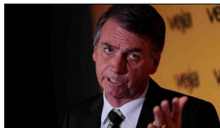
Presidente não gostou da divulgação dos números

básica nessas estruturas teria resultado na deterioração dessas salas de metal, bem como fios expostos, materiais inflamáveis e calor excessivo, o que também levou alunos a apelidarem de "salas de lata" e "forno gigante".