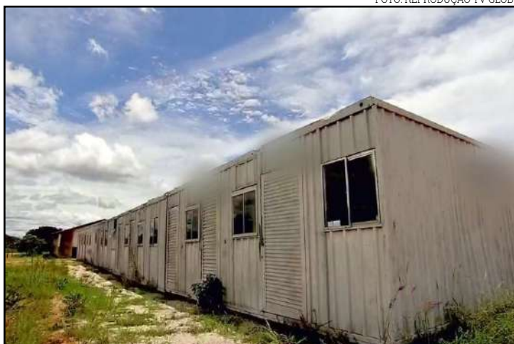
Drama deve terminar este ano

Uma reportagem exibida em rede nacional no