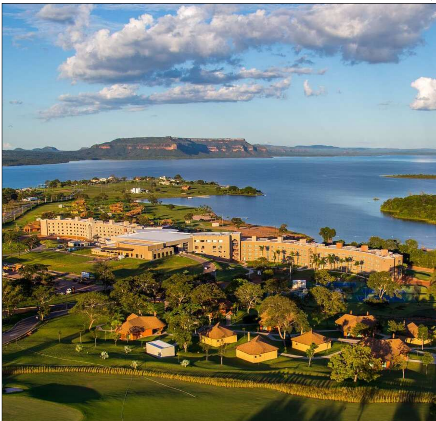
Resort tem 353 acomodações, entre apartamentos, bangalôs e casas boutique

Destaque para as piscinas que somam mais de três mil m² de lâmina d'água, complexo esportivo com quadras de tênis e poliesportivas, campo de futebol, além de pier a beira do Lago do Manso que possui 57 km de estirão navegável e 427 km² de superfície de água represada à beira do resort, ideal para a prática de esportes náuticos e pesca.