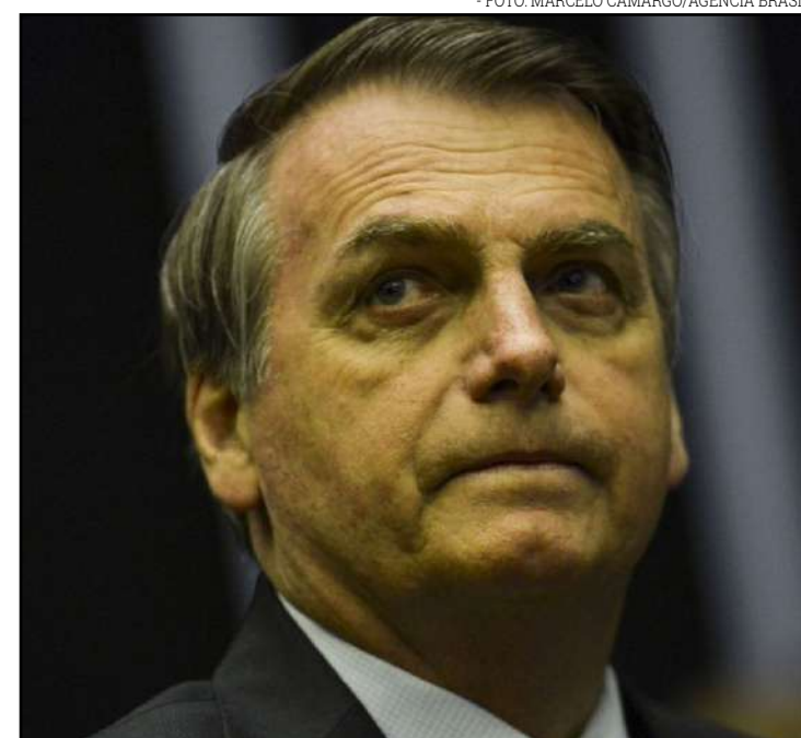
Presidente também foi alvo dos hackers