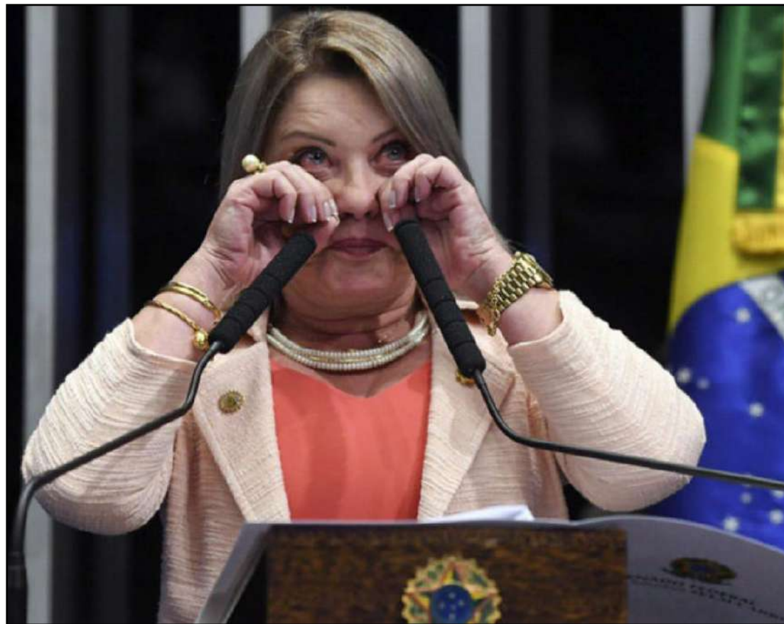
Pelo TRE/MT Selma continua cassada

Agora só resta à senadora Selma Arruda, recorrer ao Tribunal Superior Eleitoral em Brasília. Até lá ela permanece no cargo e caso o TSE como instância máxima da Legislação Eleitoral validar o entendimento do TER/MT, uma nova eleição para Senado será realizada em Mato Grosso para ocupação da cadeira hoje pertencente à Selma Arruda.