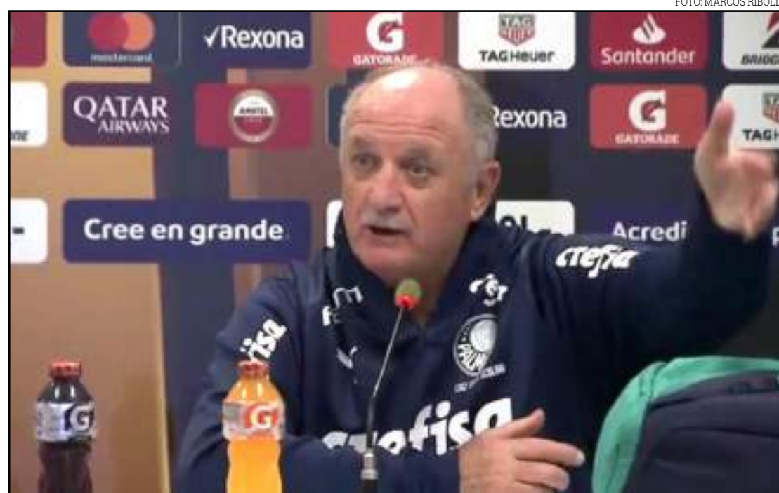
Felipão durante coletiva após duelo com o Godoy Cruz