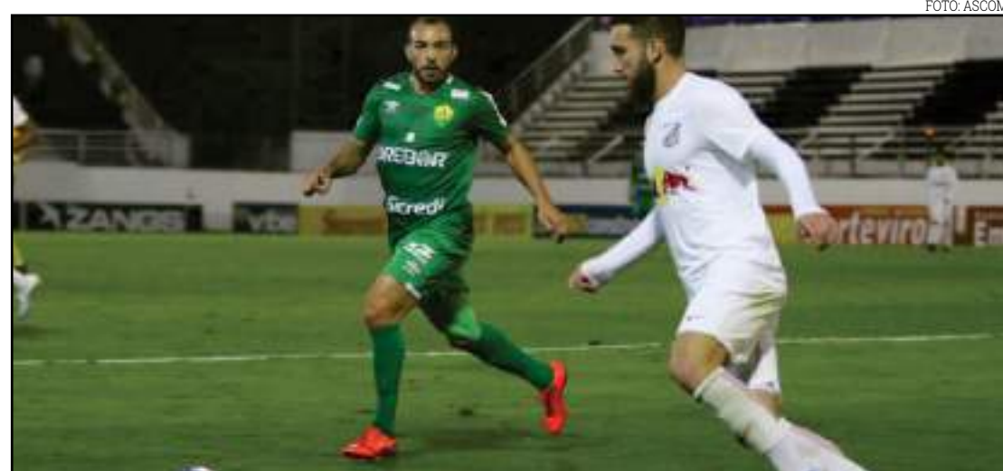
Dourado empatou em jogo de quatro gols contra o líder Bragantino

O time da casa ainda conseguiu a virada no primeiro tempo. Aos 43 minutos, após escorregada do lateral-direito Léo, o atacante Ytalo recebeu sozinho dentro da área e fez 2 a 1, levando a vantagem para o intervalo.