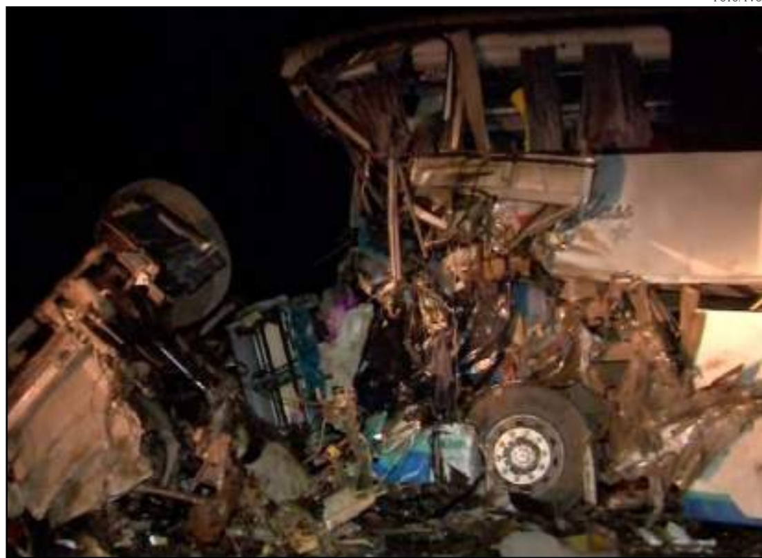
Carreta e ônibus bateram de frente na BR-163 em Diamantino: quatro pessoas morreram

A perícia técnica encerrou os trabalhos por volta de 6h10. As equipes da Rota do Oeste fizeram a limpeza da pista para liberação do tráfego. O procedimento é importante para remoção de resíduos e destroços, evitando incidentes ou até mesmo acidentes. Uma perícia deve apontar as causas do acidente.