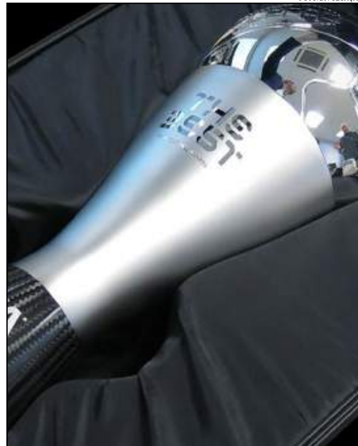
Troféu para o melhor do mundo da temporada europeia