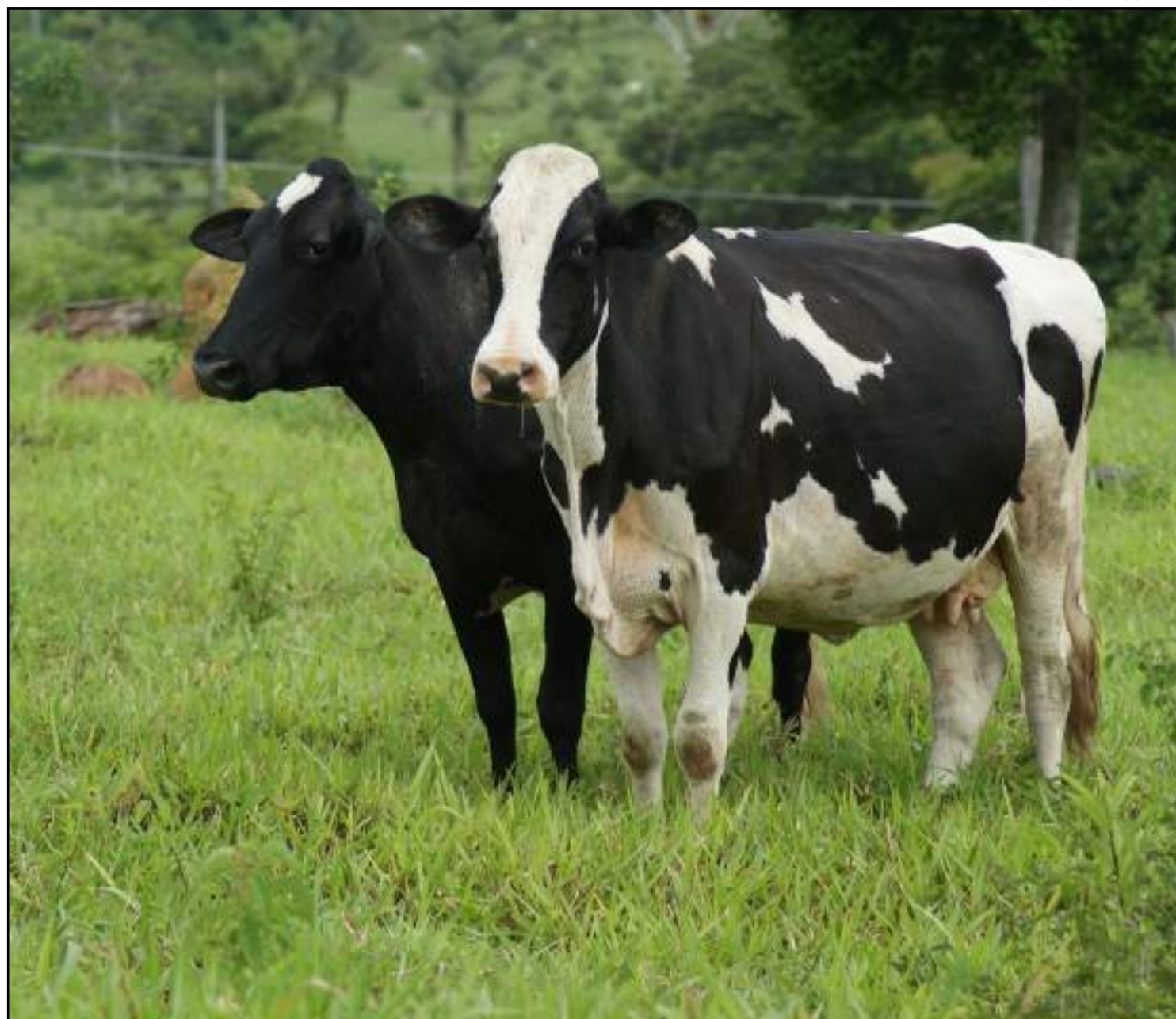
Sazonalidade: diferença entre a oferta de leite em diferentes períodos do ano

Porém, esse efeito é causado pelo menor aumento dos preços pagos ao produtor na entressafra. Em média, em Mato Grosso se paga 23,29% a menos pelo litro do leite do que no restante do País. Durante a seca, de julho a setembro, a diferença chega a