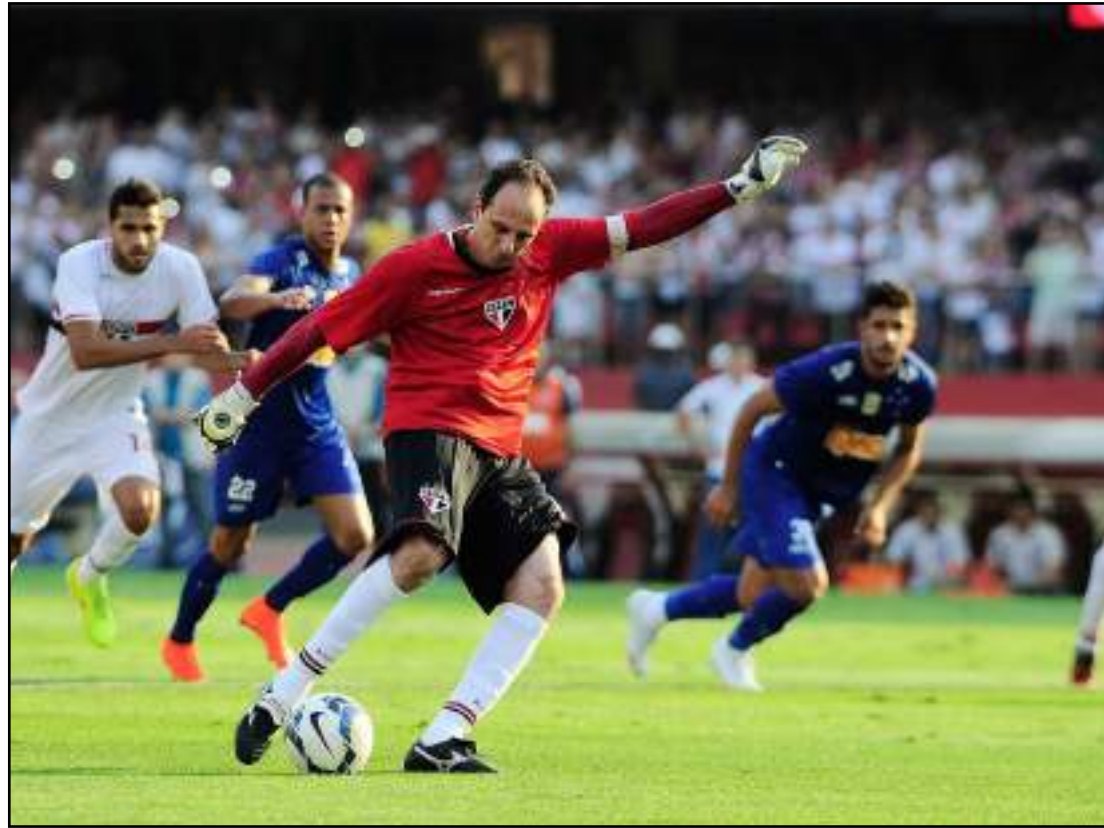
R. Ceni fez 7 gols diante do Cruzeiro

bém reencontra o meia Robinho. O jogador ficou marcado por três golaços com a camisa do Palmeiras diante de Rogério Ceni. Um do meio de campo, outro chutando de primeira e o terceiro por cobertura.