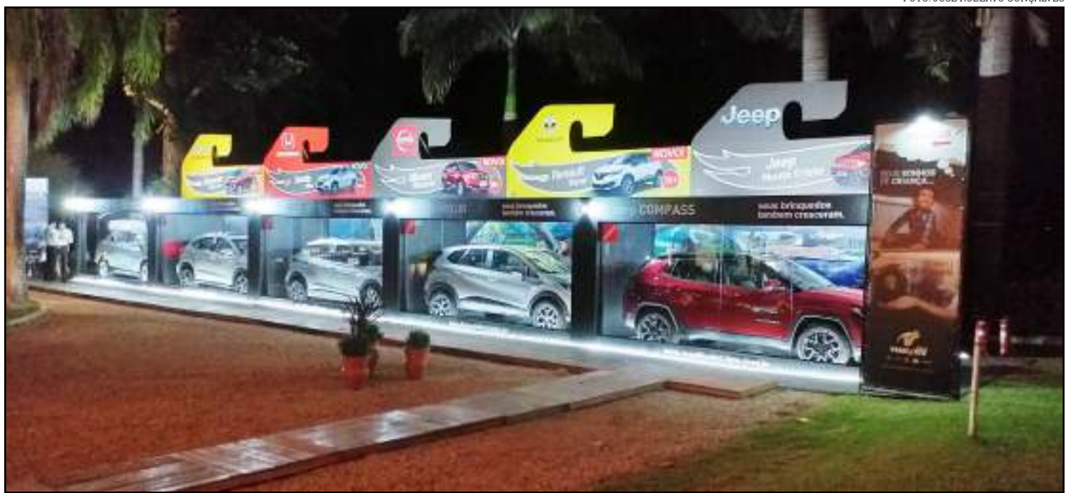
Marcas do Grupo Vianorte estão expostas em caixas no formato Hot Wells