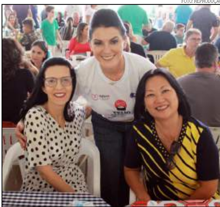
Prefeita reafirmou parceria com Rede em Sinop

município para a implementação de projetos e/ou outras ações as instituições devem estar, primeiramente, com todo dispositivo legal registrado e em dia (documentações, por exemplo). Além disso, possuem cadastro