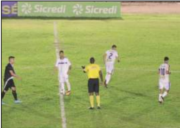
Competição estadual vale vaga na Copa do Brasil de 2020

A Copa FMF Sub-21 é disputada por oito equipes, Araguaia, Cuiabá, Dom Bosco, Operário Ltda, Luverdense, Mixto, Sinop e União. Cada equipe pode utilizar por partida cinco atletas até 23 anos, nascidos em 1996. A primeira fase será apenas com um turno, com os quatro primeiros colocados se classificando para a semifinal.