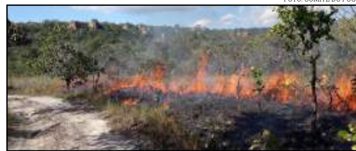
Crescimento é notado quando comparado ao mesmo período de 2018

de crescimento em relação a 2018. Até julho, o Corpo de Bombeiros já atendeu 660 incêndios em vegetação (terrenos urbanos e incêndios florestais). Em comparação com meses fora da temporada de incêndios florestais, de janeiro até abril foram 136 incêndios em vegetação em todo o estado. Os atendimentos a incêndios em vegetação de julho são quase 20 vezes maiores que a média dos quatro primeiros meses.