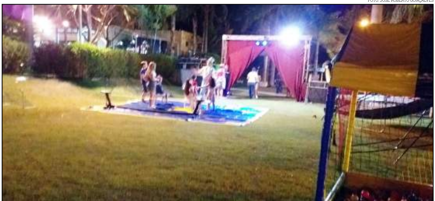
Os pequenos também têm seu espaço para diversão