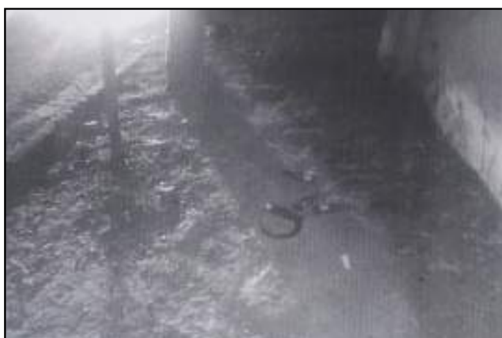
Câmera de segurança registrou os restos de objetos usados durante briga

neralizada e solicitou que os envolvidos parassem a confusão. Foi quando os jovens arremessaram garrafas de vidro e retrovisores de motocicletas contra a viatura e os policiais. Para se defender das agressões, os policiais dispararam balas de borracha contra a multidão e um jovem acabou sendo ferido no braço. Segundo a polícia, o rapaz que estava alterado e sob efeito de álcool, recusou socorro dos Bombeiros e foi levado por sua família até um hospital particular onde ficou sob cuidados médicos na condição de detido por desacato.