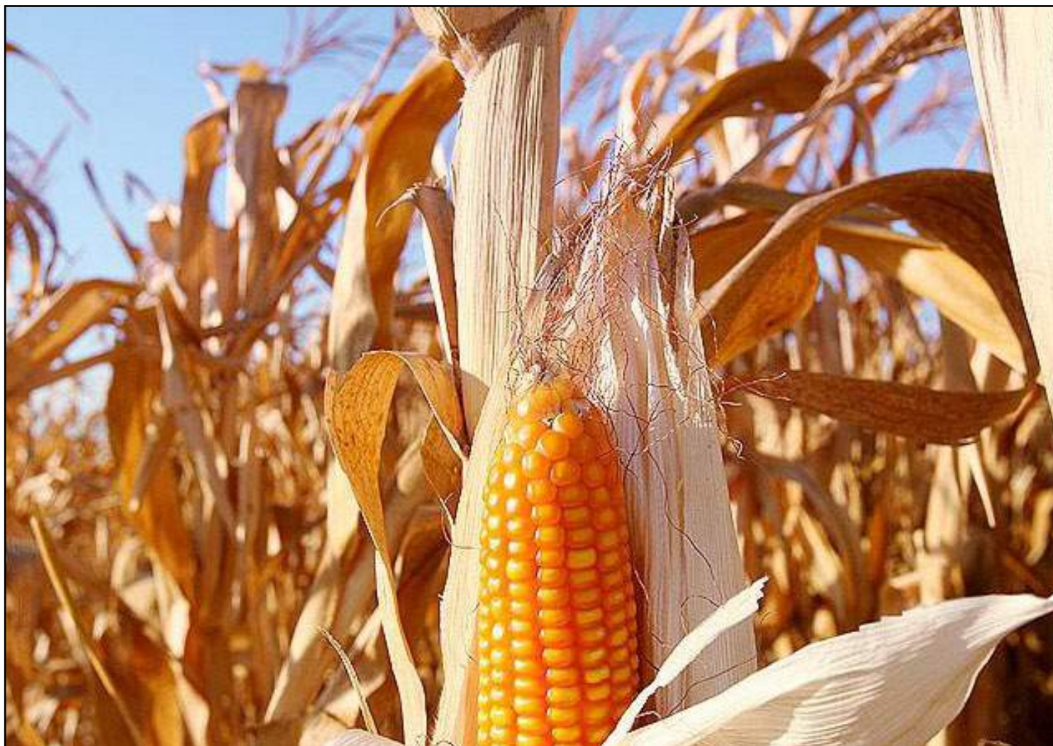
Levantamento da Conab indica 67,3 milhões/toneladas de grãos produzidos

no país. Com relação ao algodão em pluma, sua produção (1,781 milhão de toneladas) representa 66,18% do total nacional. Na região Centro-Oeste, a diferença em relação aos seus pares, também é alta. Chega a responder por 93,16% da produção de algodão em carvão, 93,14% do algodão em pluma, 60,25% do milho e 61,65% da soja. No caso do milho, o carro-chefe é a segunda safra, conhecida como safrinha – a colheita da primeira safra é insignificante. Segundo o último levantamento da Conab, enquanto a primeira safra registrou 261,8 mil toneladas, a segunda foi de 31,144 milhões de toneladas. Segundo o Instituto Mato-grossense de Economia Agropecuária (Imea), as principais regiões produtoras de milho em Mato Grosso são Médio Norte, com 16 municípios, capitaneados por Sorriso, Nova Mutum, Nova Ubiratã e Lucas do Rio Verde, com 43,42% do total colhido no estado; e Sudeste, com 32 municípios, liderados por Primavera do Leste, Itiquira, Campo Verde, Santo Antônio do Leste, Novo São Joaquim, Alto Garças e Rondonópolis, com 18% da produção estadual.