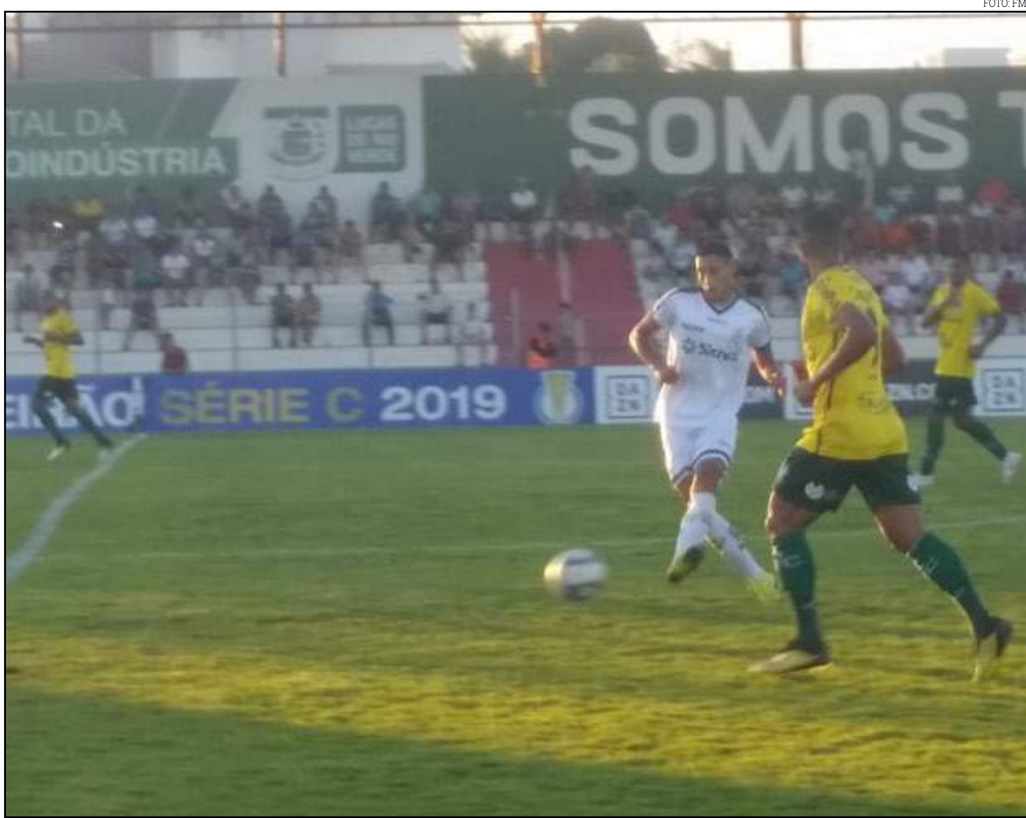
Renato “joga com o time” à beira do campo

Como viram, o destino do Luverdense pode estar traçado já nesta semana. Se empatar com o Paysandu, estará não só moralmente, mas também matematicamente rebaixado, levando junto para a Série D uma bonita história que a equipe construiu ao longo dos últimos 15 anos.