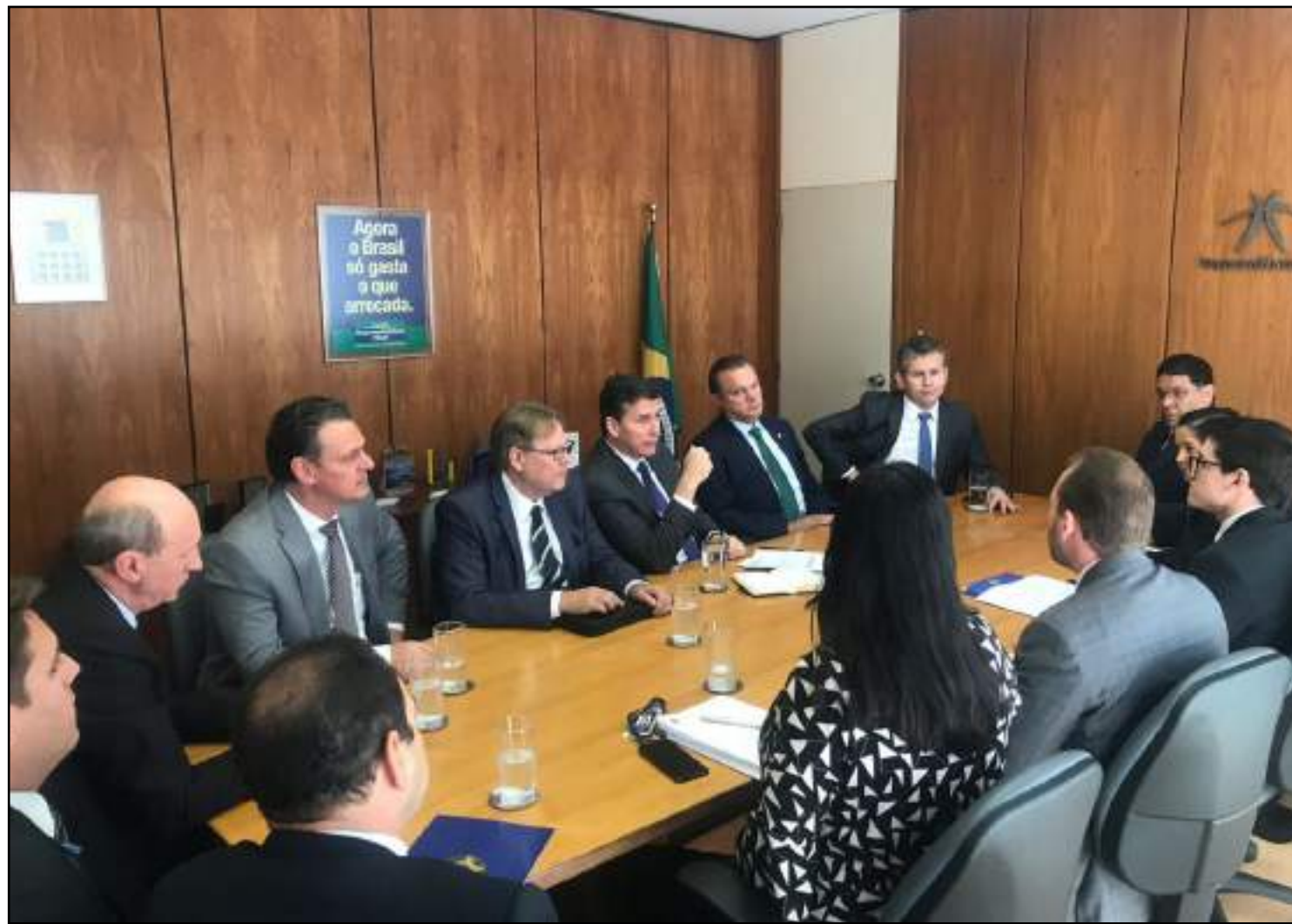
Aceitação do Tesouro Nacional é fundamental para o processo

Ainda existem outras duas etapas até que o processo chegue ao Senado Federal para aprovação dos parlamentares. “Como esse assunto vai para a comissão