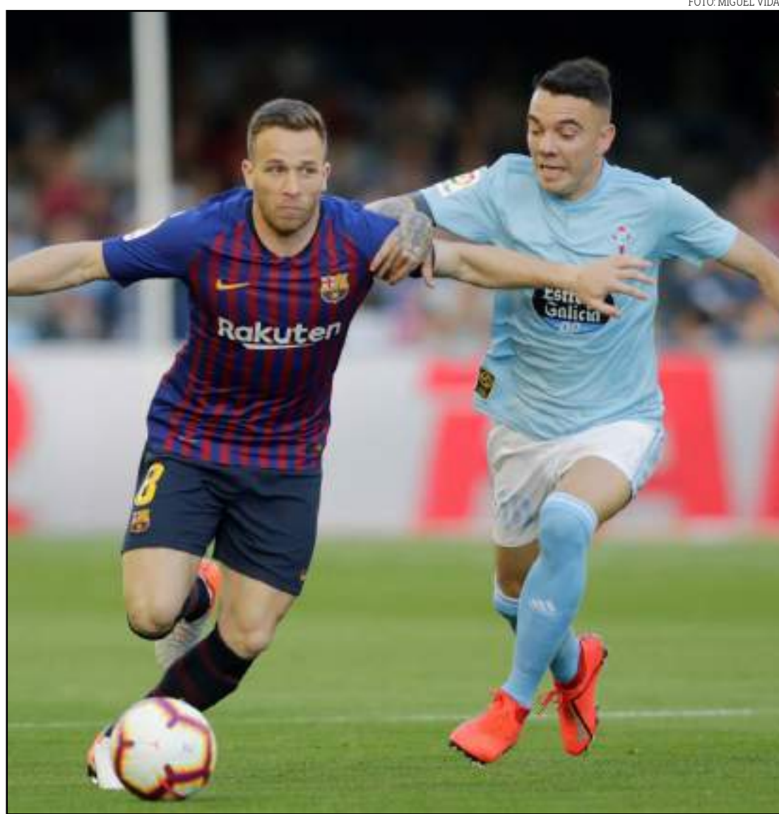
Arthur é a maior venda da história do Grêmio