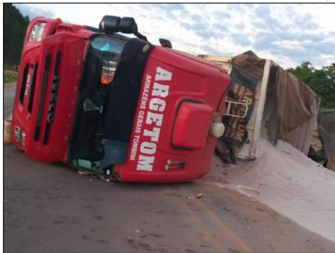
Acidente envolveu duas carretas e um carro de passeio

Em menos de 48 horas, foram 11 mortes registradas em acidentes nas rodovias federais que cortam Mato Grosso. No domingo (11), um grave acidente entre um Cel-