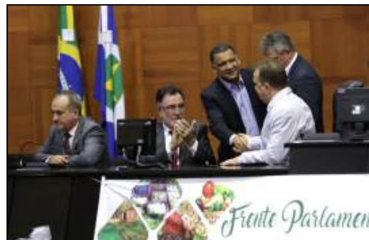
Setor econômico abarca 150 mil famílias e carece de políticas públicas