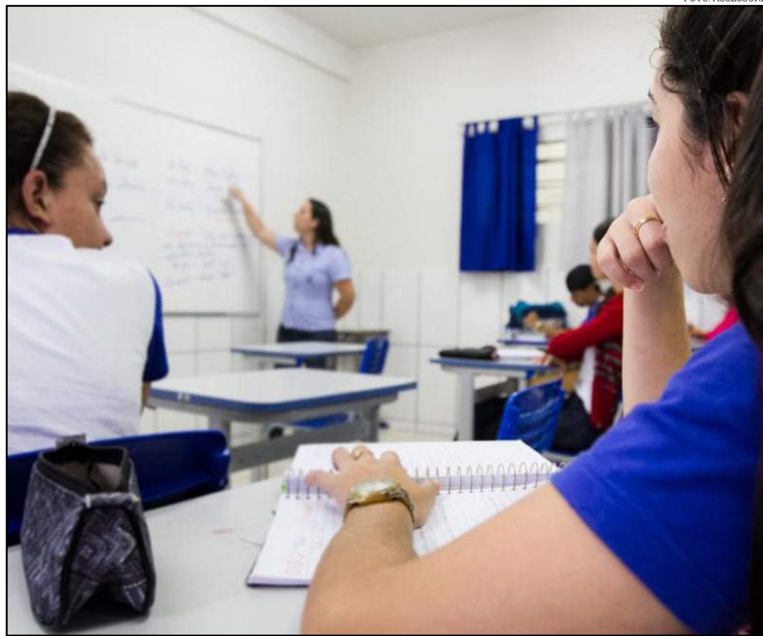
Aulas deste ano letivo serão concluídas em fevereiro de 2020

Deste espaço fiscal, 75% será destinado à RGA para todos os servidores públicos e os 25% restantes para os reajustes já concedidos nas leis de carreira – que beneficiariam os profissionais da Educação, Meio Ambiente e Fazenda.