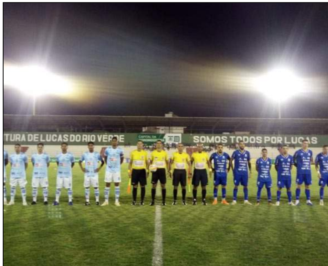
Nova Mutum e Cacerense decidem vaga no domingo

Com o resultado, o Poconé pode até perder por dois gols de diferença, mesmo jogando em casa, para garantir a vaga na decisão e também na elite do Estadual em 2020. O Grêmio Sorriso, que não venceu uma partida sequer até agora na competição, precisa vencer por três gols para levar a decisão para os pênaltis, ou a partir de quatro para se ga-