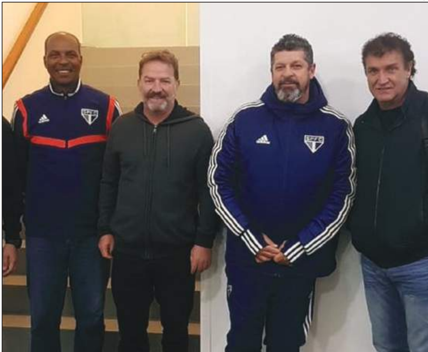
Cuca e seus auxiliares acompanham time sub-20 do São Paulo

Goleiro: Tiago Volpi; Laterais: Igor Vinicius, Dani Alves, Juanfran e Léo; Volantes: Willian Farias e Tchê Tchê; Meias: Hernanes e Vitor Bueno; Atacantes: Pablo, Alexandre Pato, Calazans, Raniel e Biro Biro (foi para o Botafogo).