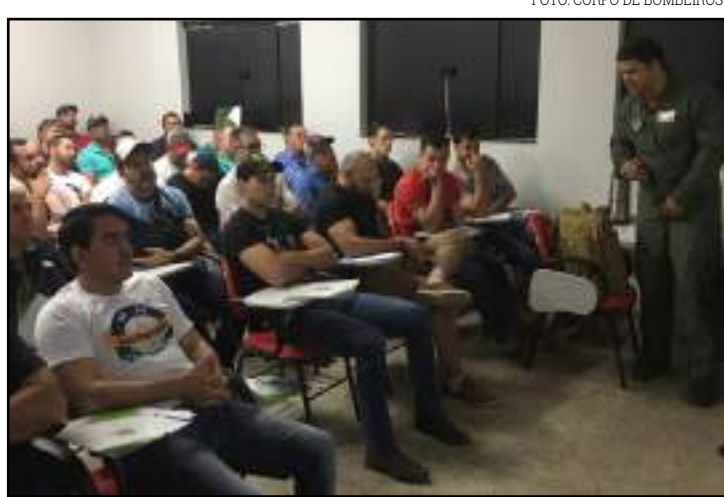
Mais de 60 pilotos aprendem técnicas para combate a incêndio

"Já ajudei a combater incêndios com a aeronave em lavouras de milho. Em 2006 participei do primeiro curso no combate a incêndios rea-