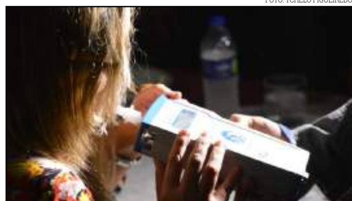
Quando Operação Lei Seca é feita, muita gente é pega alcoolizada