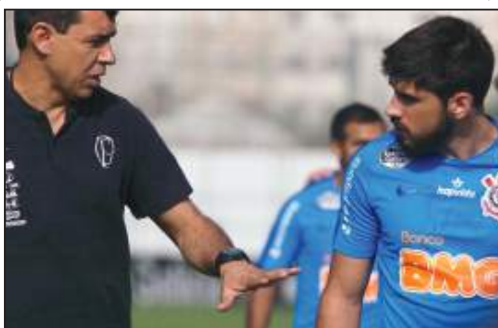
Uruguaio voltou do Pan e deve ganhar mais espaço no Timão