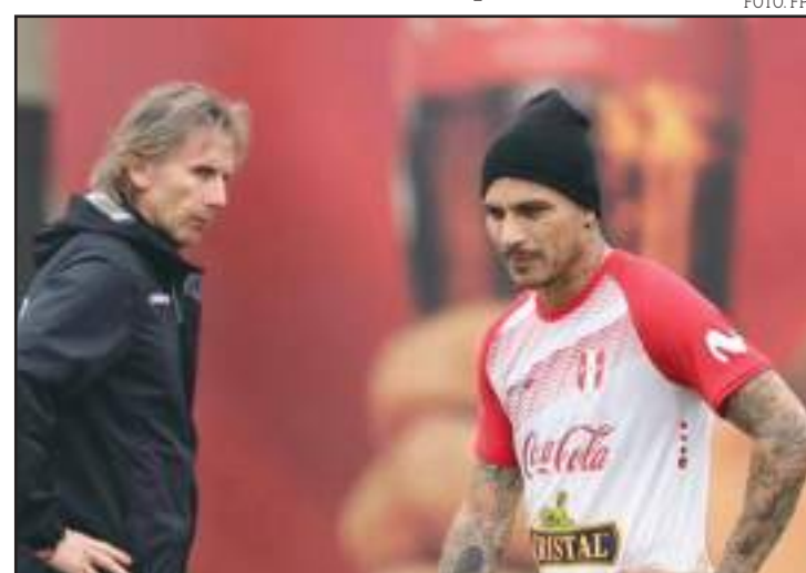
Gareca parece não estar afim de liberar Guerrero da convocação

Ainda como argumento, a direção do Inter também utiliza o técnico Tite como exemplo. O treinador da Seleção não deve convocar atletas de clubes brasileiros que estejam em fases decisivas na Libertadores e Copa do Brasil.