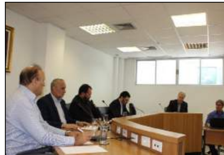
Compilação de dados econômicos e sociais foi apresentada durante reunião