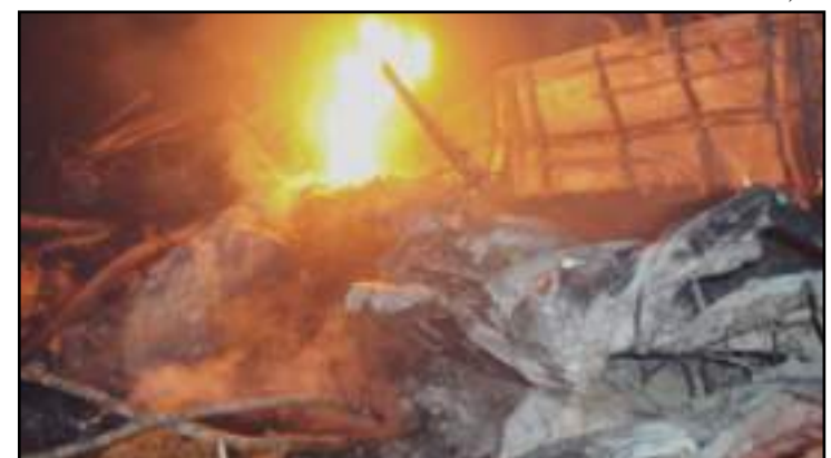
Motorista morreu carbonizado após a batida em Terra Nova