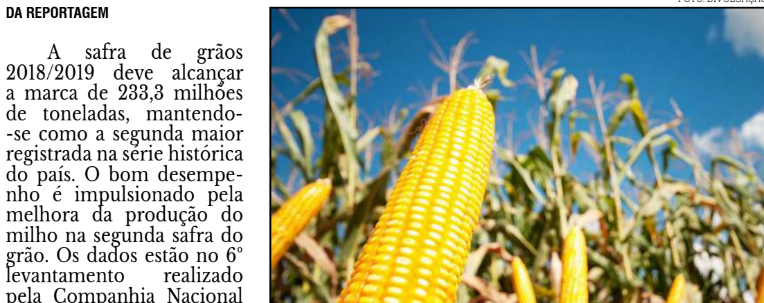
Conab prevê recuperação do milho