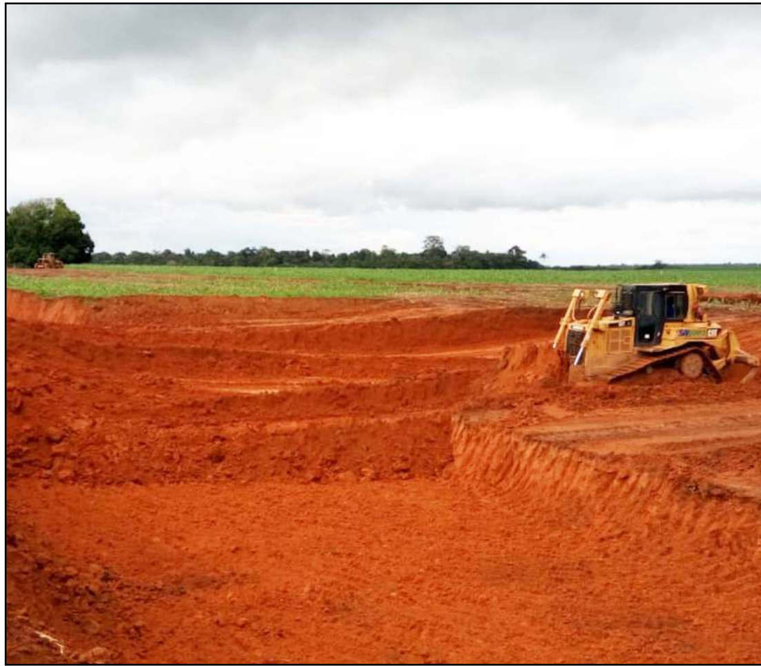
Aterro sanitário está sendo construído na MT-240, sentido Santa Carmem