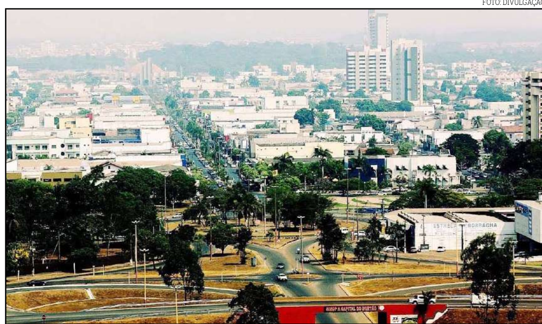
MT, impulsionado por Sinop e demais cidades, teve crescimento na renda per capita

Os valores foram calculados com base na Pesquisa Nacional por Amostra de Domicílios Contínua (PNAD Contínua) e enviados ao Tribunal de Contas