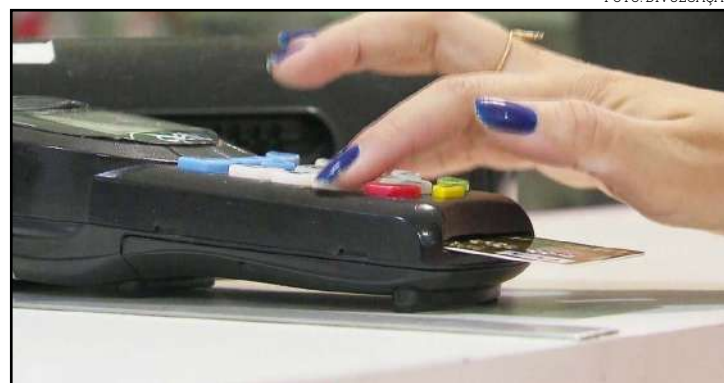
Texto passou no Plenário e segue para sanção presidencial

mais fácil e com juros menores para consumidores e empresas que honram seus compromissos financeiros, pois permitirá que informações que atualmente não são consideradas em uma avaliação de crédito, passem a ser consultadas, possibilitando uma avaliação de risco mais justa e individualizada. Além disso, favorecerá mais assertividade por parte do empresário nos processos de análise e concessão de financiamentos, empréstimos e compras a prazo. Isso tudo sem afetar a proteção de dados sensíveis e o próprio sigilo bancário que permanecem preservados, como todas as demais exigências previstas no Código de Defesa do Consumidor. A mudança nas regras do Cadastro Positivo também deve estimular a competição na oferta de crédito entre instituições financeiras, como fintechs, cooperativas, pequenas financeiras e também entre empresas do varejo.