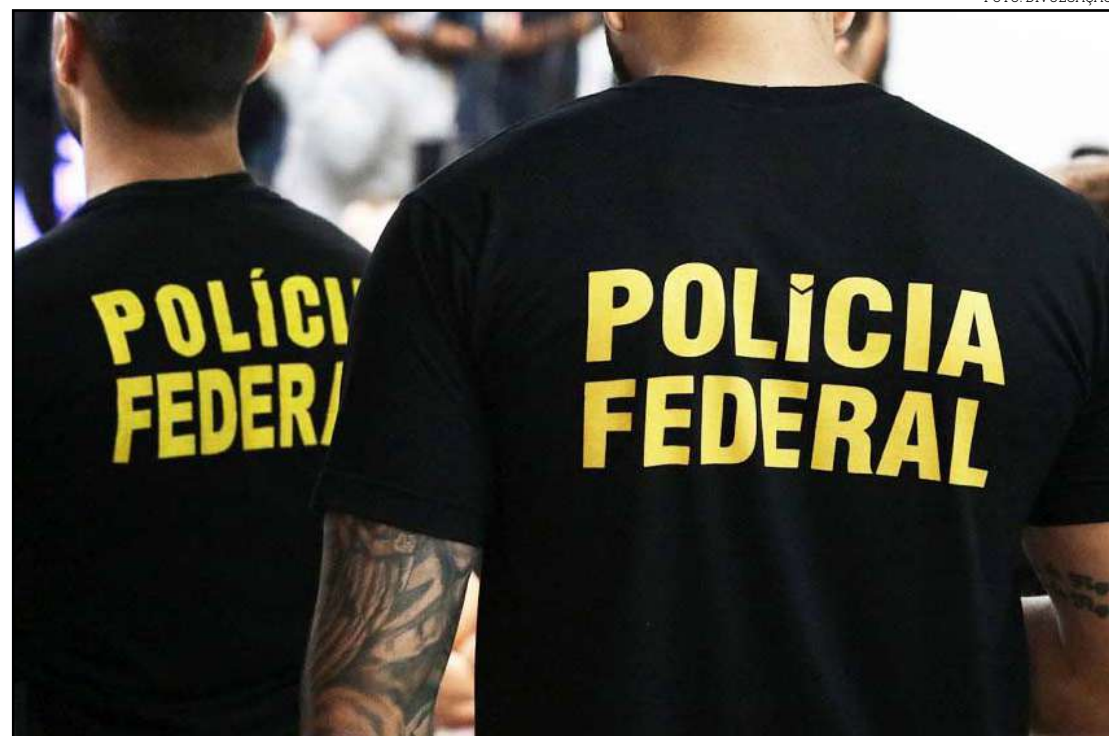
Somados, recursos bloqueados chegam a R$ 70 milhões

A Justiça determinou ainda o afastamento preventivo dos principais investigados (gerentes e proprietários) das suas funções nas empresas envolvidas com o esquema e o sequestro de bens e valores dos investigados. Somados, os recursos bloqueados podem ultrapassar a cifra de R$ 70 milhões. Os 26 inqueritos