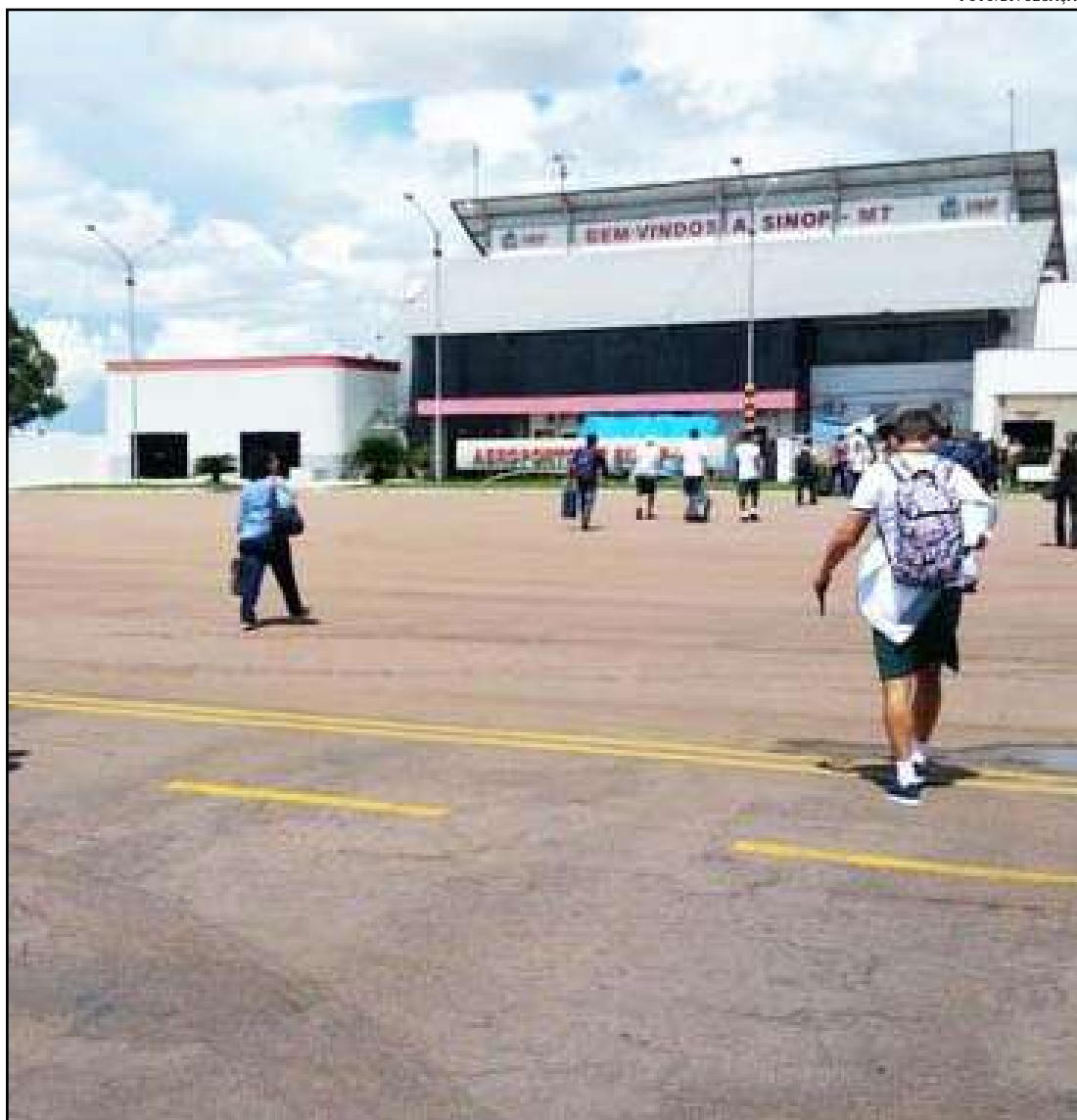
Aeroporto de Sinop está entre os que vão a leilão agora cedo

A expectativa é que a privatização dos 12 aeroportos, que respondem por 9,5% da movimentação nacional, deve render no mínimo R$ 218 milhões de outorga para o Governo Federal e gerar um investimento de R$ 1,47 bilhão na melhoria da infraestrutura dos terminais nos primeiros cinco anos.