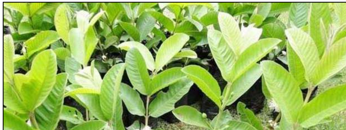
Produtores cadastrados receberam mudas de uva, pinha, goiaba, coco, entre outras