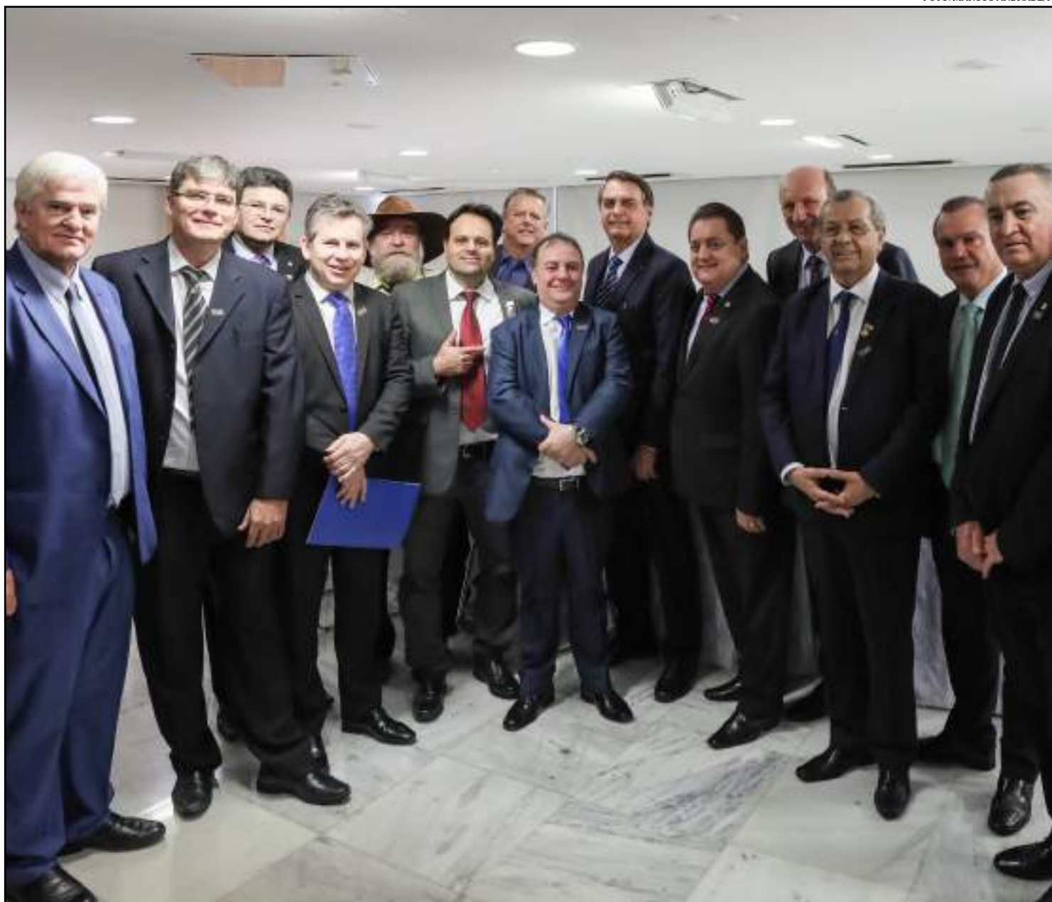
Em Brasília Mendes conseguiu duas vitórias

O novo empréstimo será melhor para o estado, de acordo com a equipe financeira de Mato Grosso, pois alivia o caixa do governo, com juros menores e com o alongamento do prazo de pagamento.