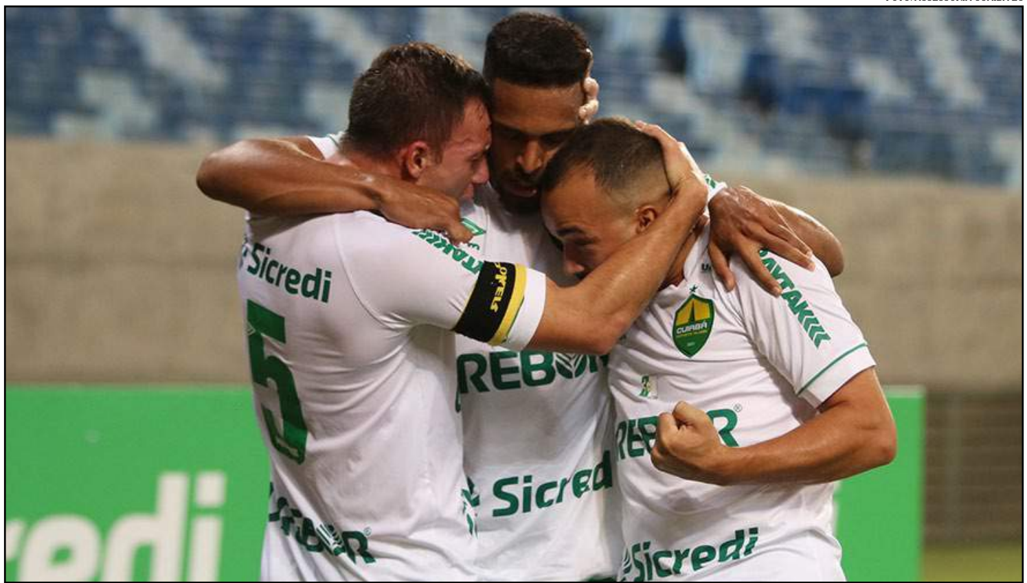
Dourado faz campanha empolgante na Série B

Para que esse sonho se realize faltam 19 partidas e a expectativa é que o Cuiabá mantenha o nível apresentado até aqui.