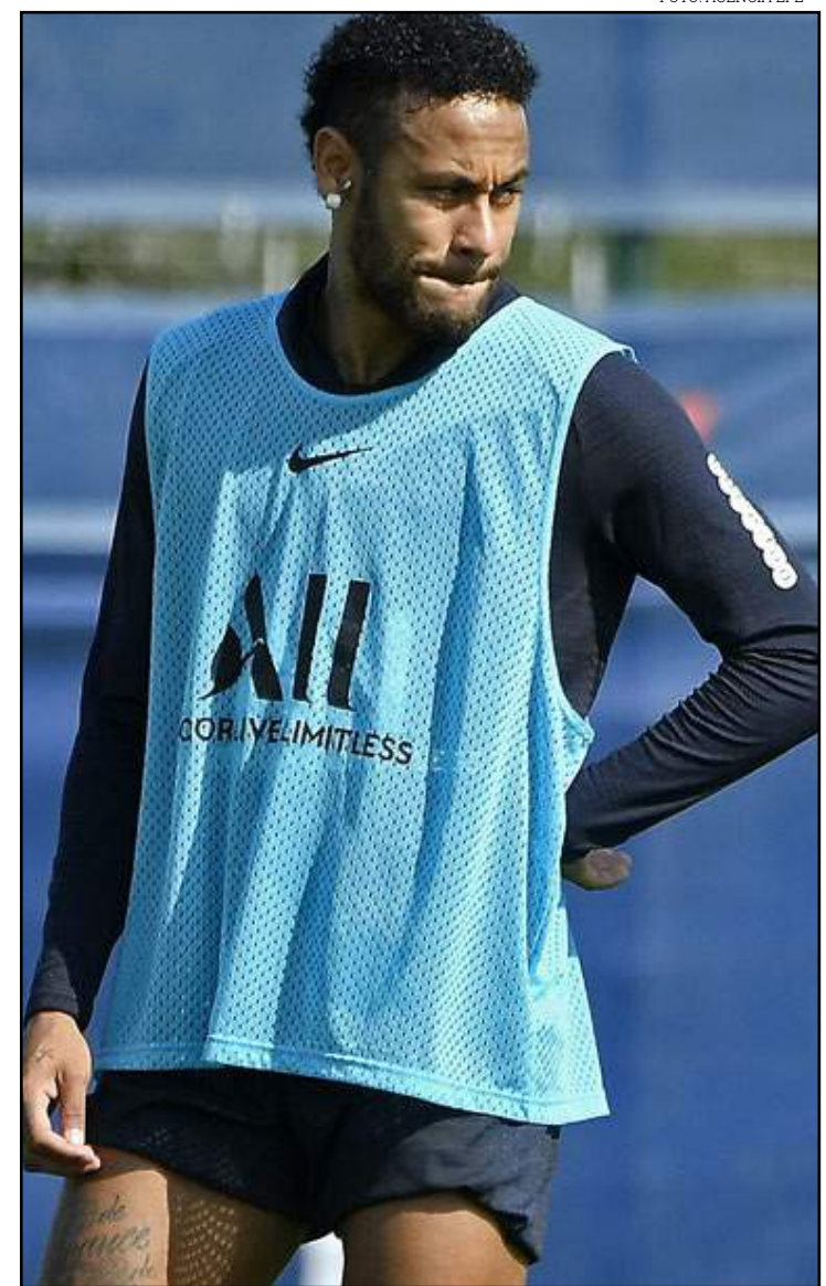
Imprensa internacional aponta acerto próximo

O zagueiro Van Dijk foi eleito o melhor defensor da última temporada no continente - o que era esperado, uma vez que ele também foi indicado para o prêmio de melhor jogador. Para levar o troféu por posição, o holandês desbancou seu companheiro Alexander-Arnold e o compatriota De Ligt, do Ajax.