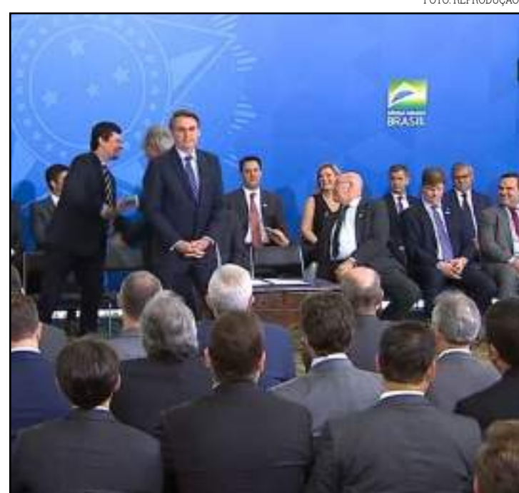
Primeira fase do projeto foi lançado em 5 cidades

horas do dia 18 de outubro. Serão realizadas outras duas audiências, sendo a segunda em Brasília (DF) no dia 3 de outubro e a terceira no dia 10 de outubro em Itaituba (PA).