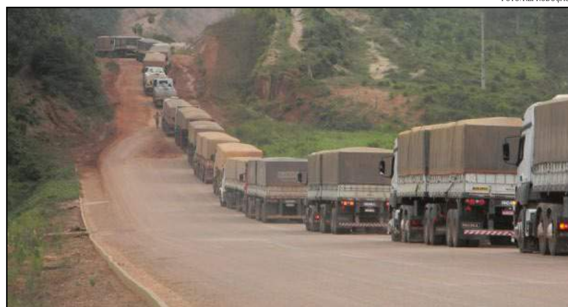
Sugestões serão apresentadas em Sinop

Os trechos propostos para concessão começam da BR-163, que começa no trevo da MT-220, que dá acesso à cidade de Juara, até Guarantã do Norte, na divisa com o Pará. Além do trecho que vai do sul do estado para-