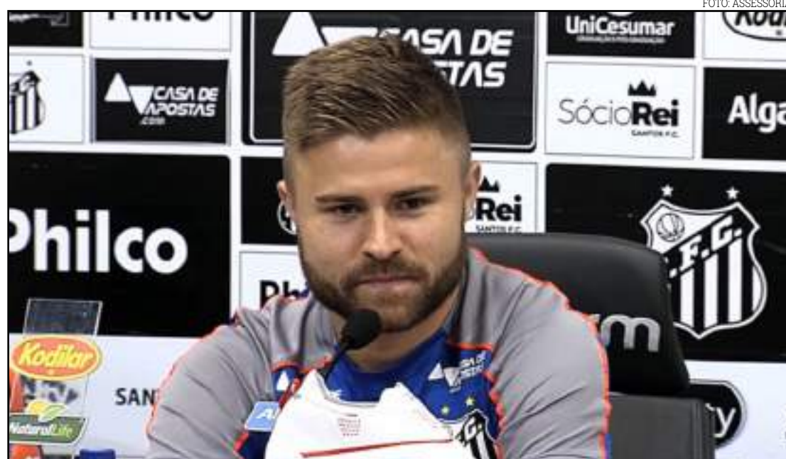
Atacante será titular pela 10ª vez seguida

"Quando eu li a notícia sobre o Sampaoli chegar no Santos, fiquei feliz por ser um grande treinador, que traria coisas novas e que eu aprenderia muito com isso. Depois de tudo que aconte-