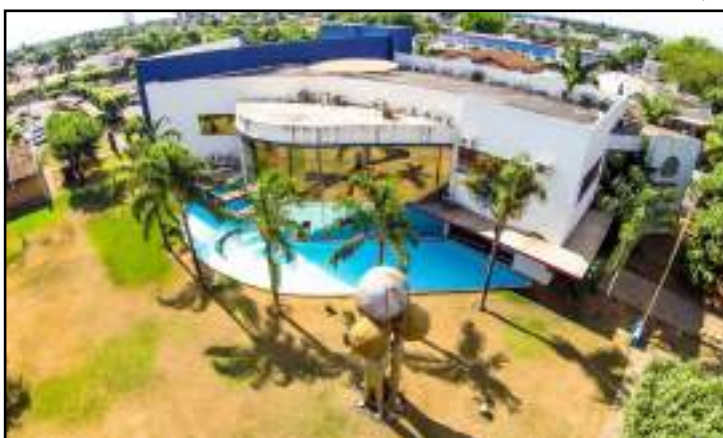
Serão repassados até R$ 2 milhões/mês para a Saúde

Consta no edital como objetivo geral da parceria a garantia da “saúde de qualidade, criando e realizando ações que possibilitem a melhoria dos serviços sociais e que resultem no resgate da cidadania da população culminando na melhoria da qualidade de vida dos municípios de Sorriso por intermédio de cooperação entre