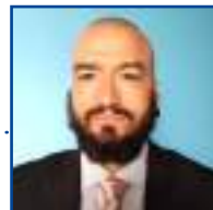
POR LEANDRO CARECA

E a gente vai ficando por aqui. Suas opiniões, sugestões e críticas são muito importantes, e você pode entrar em contato pelo fone (66) 99971-6500, pelo e-mail, lsmussi@hotmail.com ou visitar nosso perfil em facebook.com/paginadocareca. Do mais um grande abraço, e até a próxima, se Deus quiser!