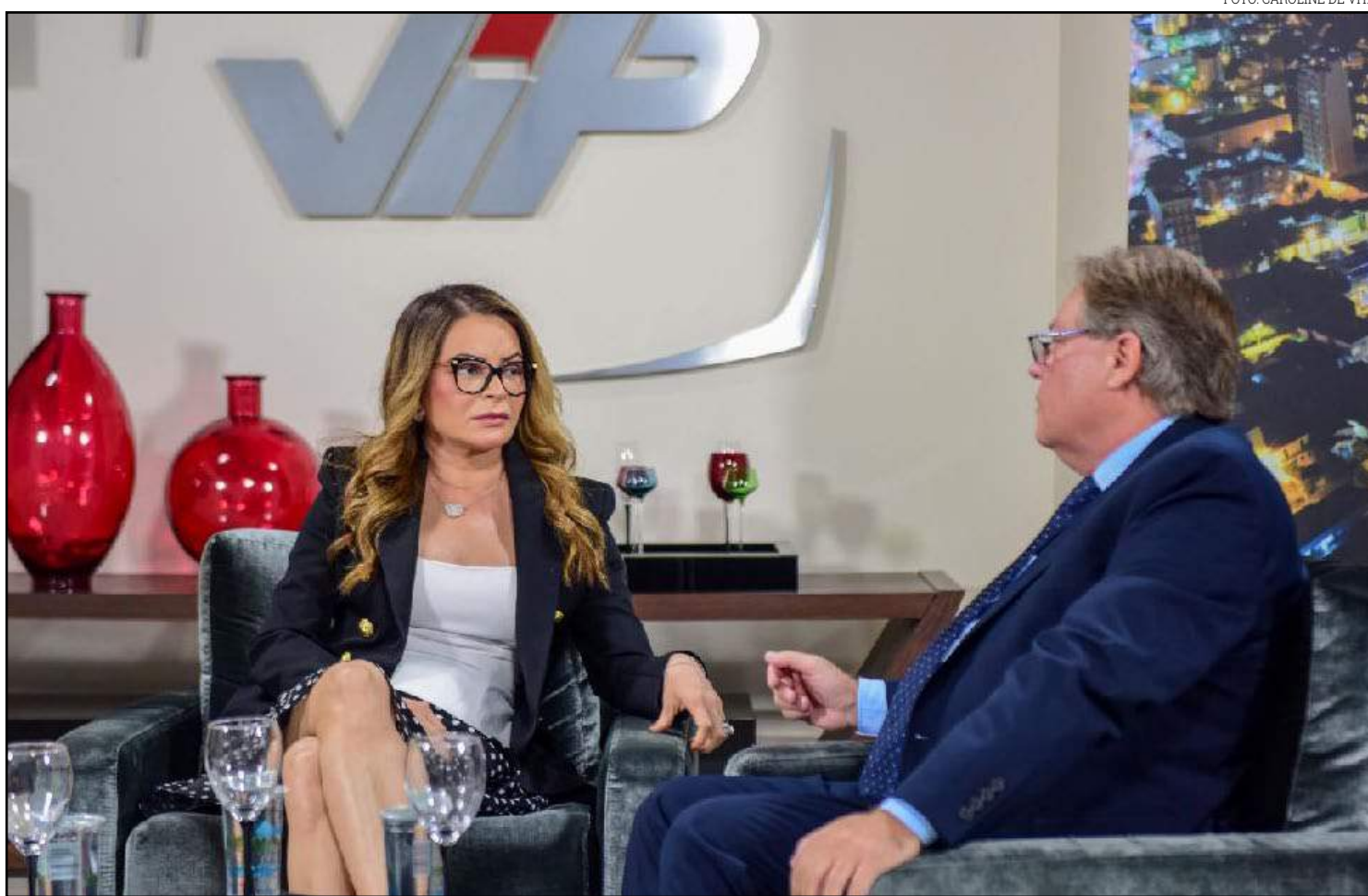
Primeira-dama foi convidada para ser madrinha da causa

“Já iniciamos o acompanhamento ambulatorial e nos próximos dias vamos iniciar a listagem de pacientes, colocar todos no cadastro técnico para que eles possam de fato ser selecionados para um transplante