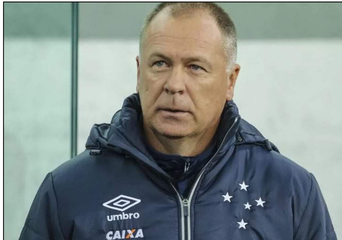
Mano chegou contestado ao Verdão

O novo treinador do Palmeiras também traba-