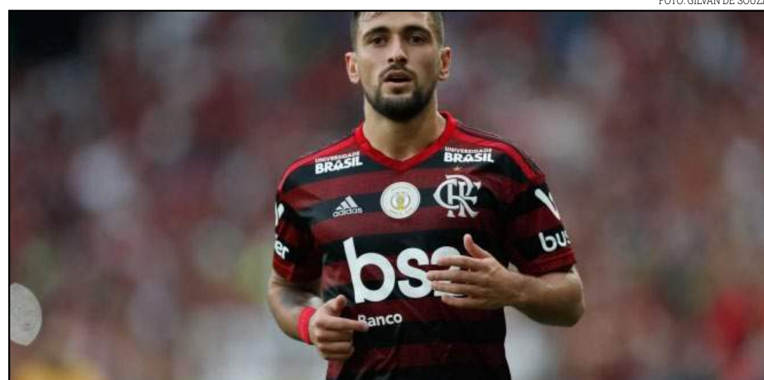
Universidade Brasil patrocina Flamengo, Corinthians e Atlético-MG

De acordo com as estimativas da Polícia, nos últimos cinco anos, quase