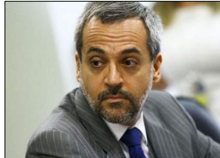
Ministro da Educação, Abraham Weintraub, foi convidado para ato no Comando-Geral

recebidos em sessão pública no dia 30 de setembro. O termo de parceria terá duração inicial de 12 meses. Porém, poderá ser renovado por até cinco anos.