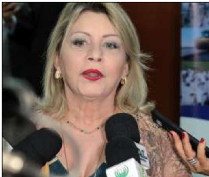
Senadora Selma Arruda está “com um pé” no Podemos

Apesar disso, Fávero afirmou que o presidente nacional do PSL, Luciano Bivar, deve trabalhar para manter a senadora na sigla. Uma reunião nesta semana deve ter como pauta a manutenção de Selma e do também senador Major Olímpio (PSL-SP).