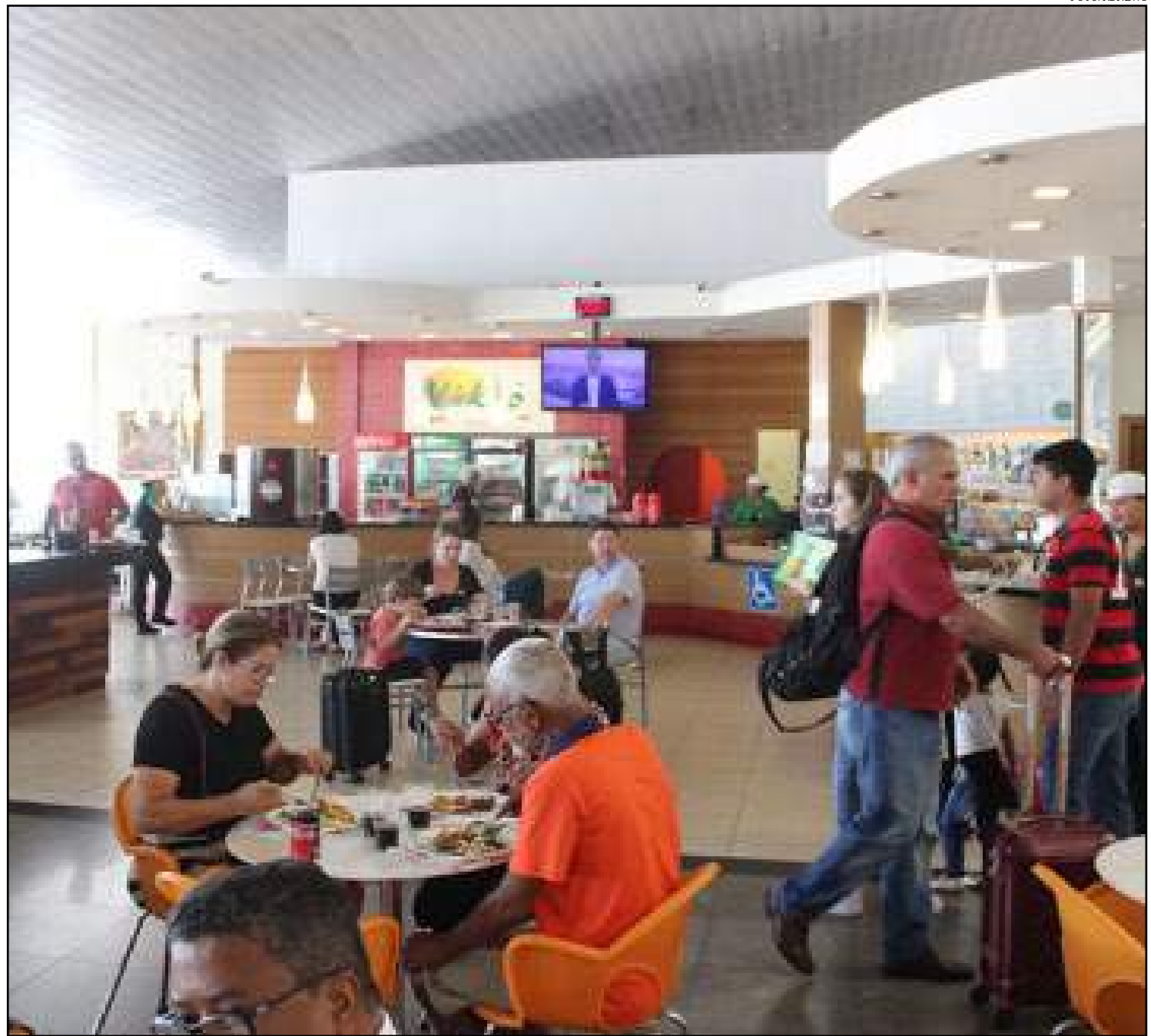
Passageiros passam calor na praça da alimentação, onde aguardam embarque

do terminal cuiabano para garantir o conforto térmico dos passageiros e usuários”, informa em nota.