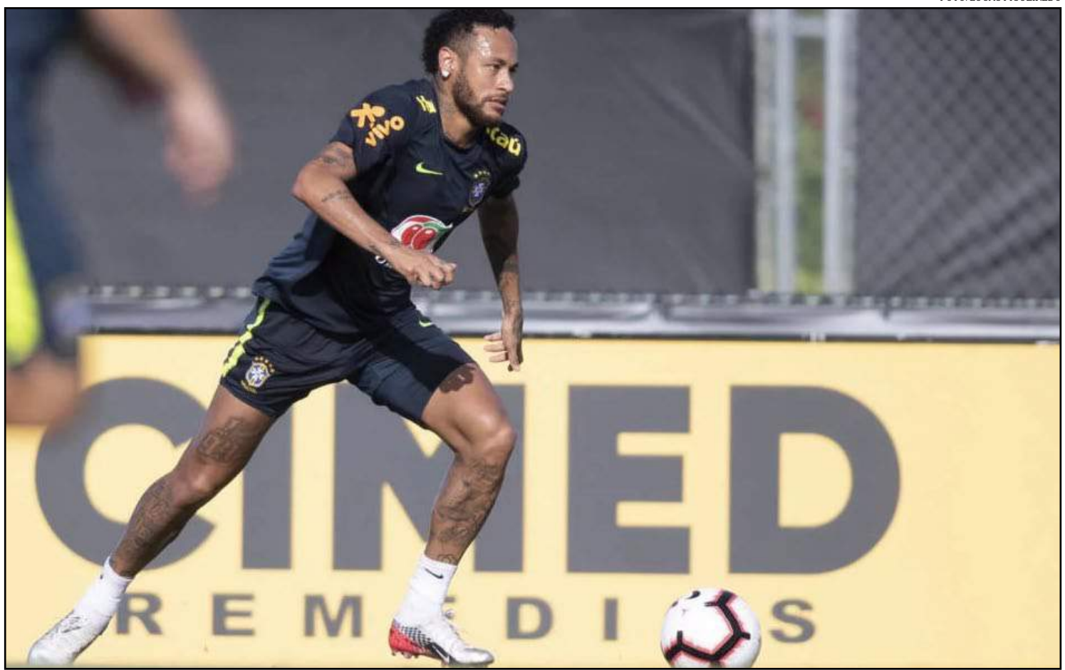
Neymar deve começar pelo lado esquerdo em amistoso contra a Colômbia

O Brasil enfrenta a Colômbia nesta sexta-feira (6), às 20h30, no estádio do Miami Dolphins, em Miami. Depois, encara o Peru na próxima terça-feira, dia 11, às 23h, em Los Angeles.