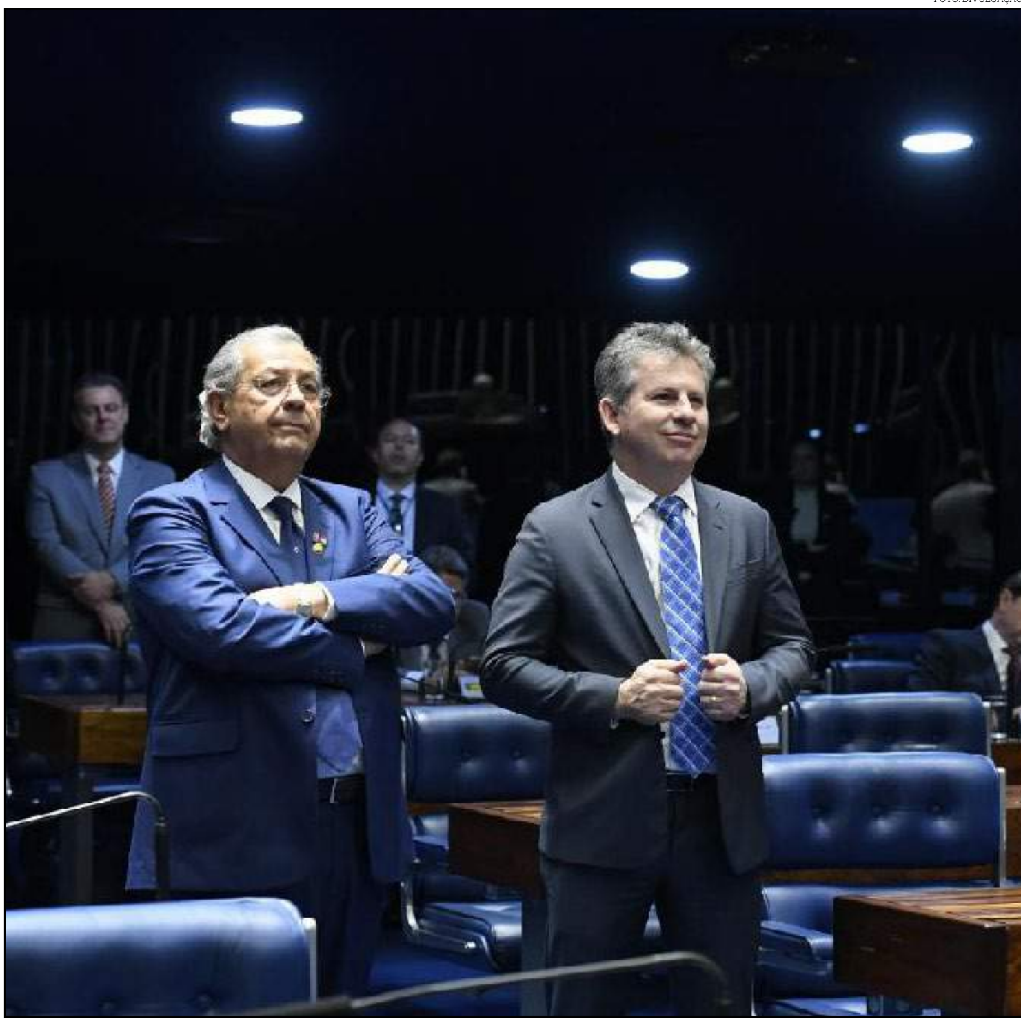
Decisão sobre empréstimo saiu na quarta-feira

Quero agradecer e muito a nossa Bancada Federal, nosso líder Nery Geller e todos os deputados, vocês têm nos ajudado em muitos aspectos. Quero agradecer aos nossos senadores, porque todos ajudaram, senador Jayme Campos que foi um gigante, senadora Selma Arruda que está aqui hoje, e senador Wellington Fagundes que ligou pedindo apoio, e todos aqueles que trabalharam para dar esse passo importante para o equilíbrio fiscal de Mato Grosso”, destacou.