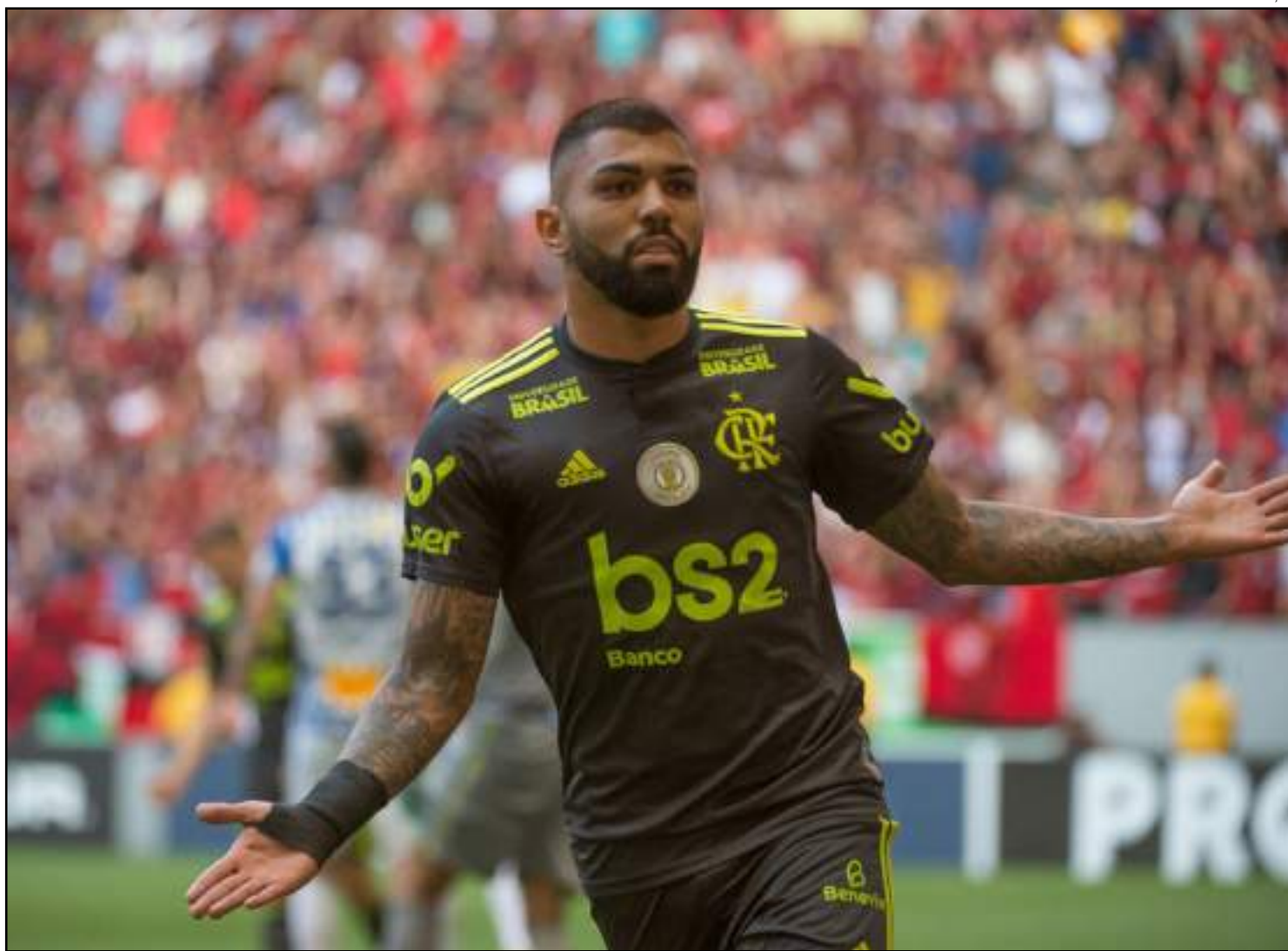
Atacante tem pelo menos mais 22 jogos na temporada

Uma comemoração que já tinha virado tradicional do atacante era pegar e levantar um cartaz da torcida com a mensagem: "Hoje tem gol do