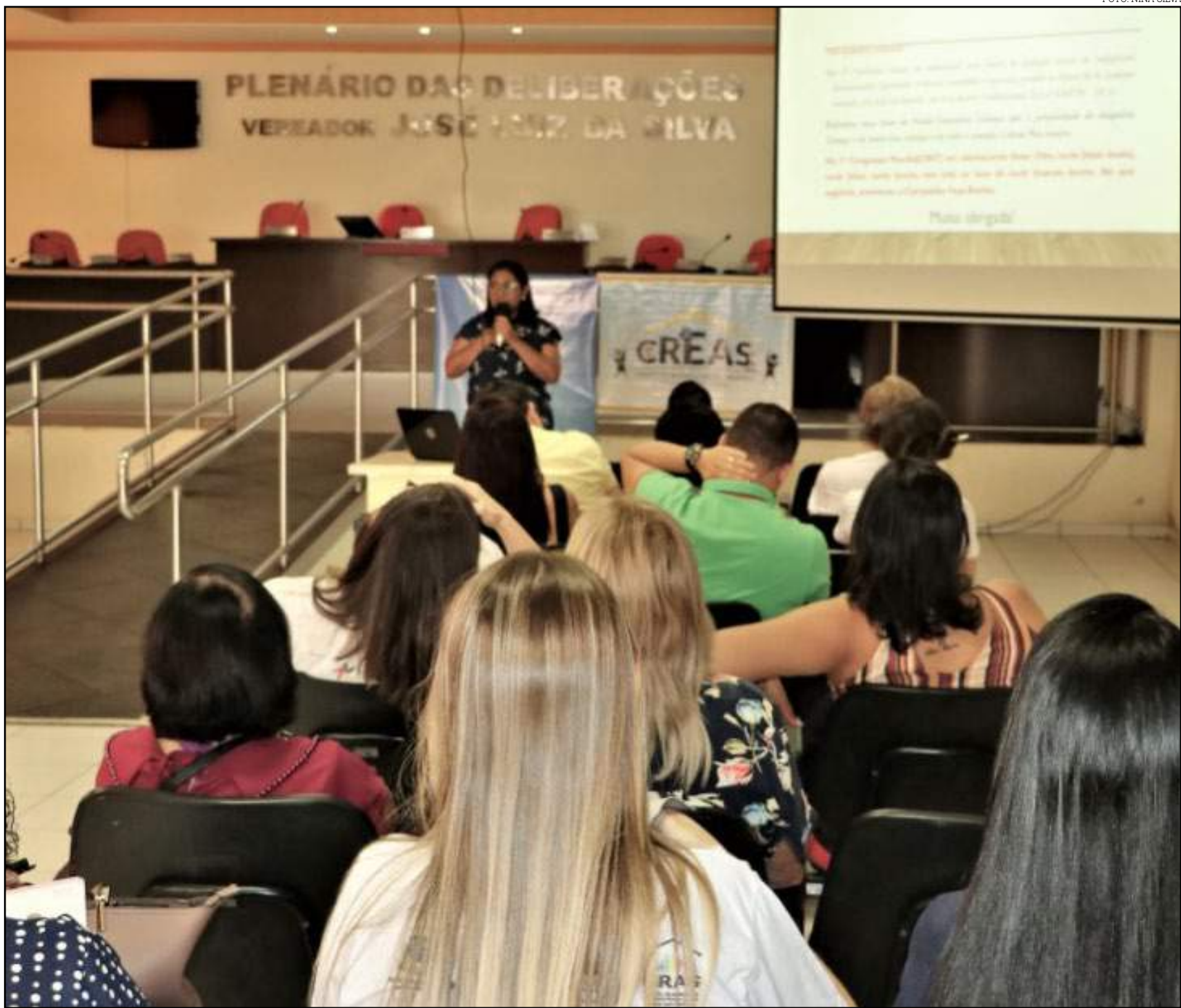
Encontro discutir erradicação do trabalho infantil