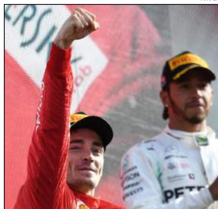
Leclerc comemora vitória no pódio em Monza; Hamilton só olha