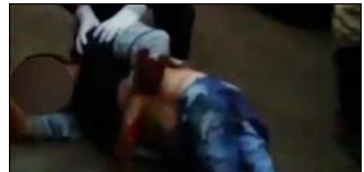
Cliente reagiu a assalto e atirou em ladrão em Rondonópolis

O cliente deixou o local e não foi reconhecido pelas testemunhas. O assaltante ainda tentou se desfazer do dinheiro e da arma quando foi baleado. O Serviço de Atendimento Móvel de Urgência (Samu) foi chamado, atendeu o assaltante e o encaminhou ao Hospital Regional de Rondonópolis.