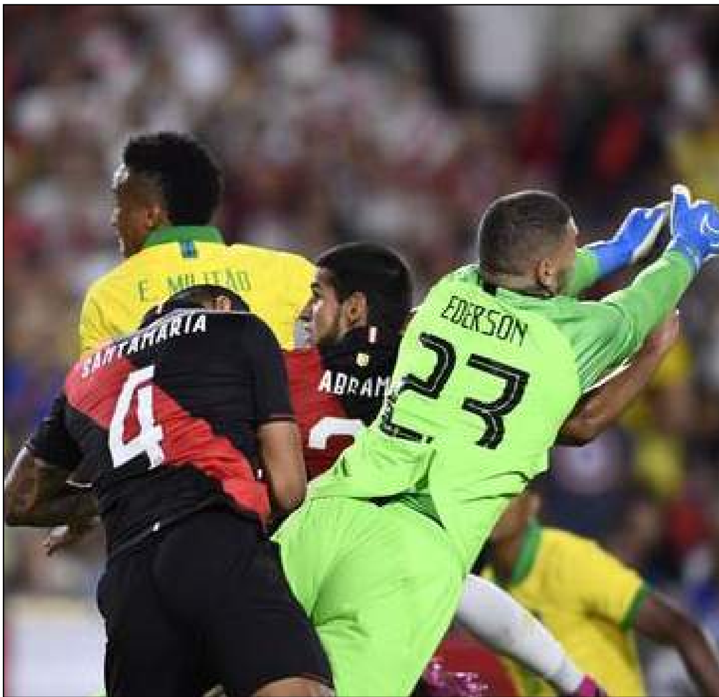
Ederson sai mal, e Abram escora para o gol

A partida marcou a estreia de Vinicius Jr. na seleção brasileira principal. O atacante do Real Madrid entrou aos 27 minutos do segundo tempo, na vaga de Richarlison, e ocupou mais o lado esquerdo. Tentou algumas jogadas e uma finalização de primeira após cruzamento de Bruno Henrique, mas sem sucesso. Ainda terá tempo para mostrar seu talento.