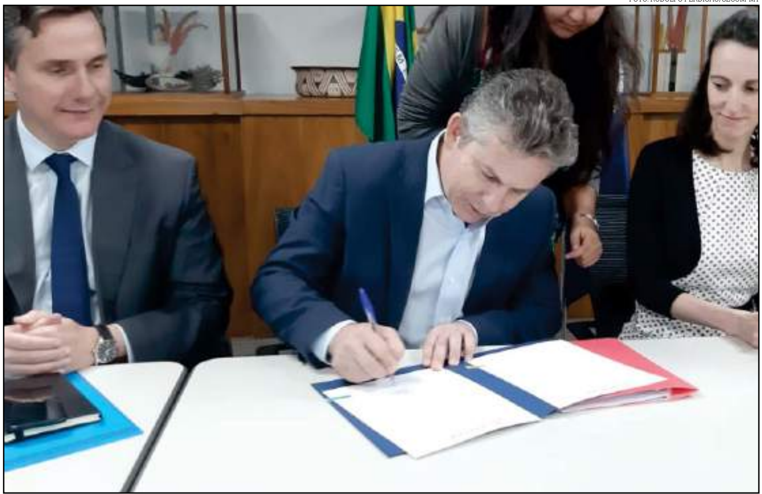
O prazo para quitar o novo empréstimo será de 20 anos

Com essa nova operação, o governo de Mato Grosso quita a dívida anterior com o Bank of America que se estenderia até 2023. Com o novo empréstimo, a nova dívida se estende por mais 20 anos, com juros menores e pagamento de parcela anual de R$ 20 milhões, a atual é realizada em duas parcelas anuais de 154 milhões. A diferença não paga mais ajudaria para sanar outras dívidas acumuladas e o pagamento do funcionalismo público. “O pagamento dessa dívida é muito importante para o equilíbrio das contas de Mato Grosso”, avaliou o governador Mauro Mendes.