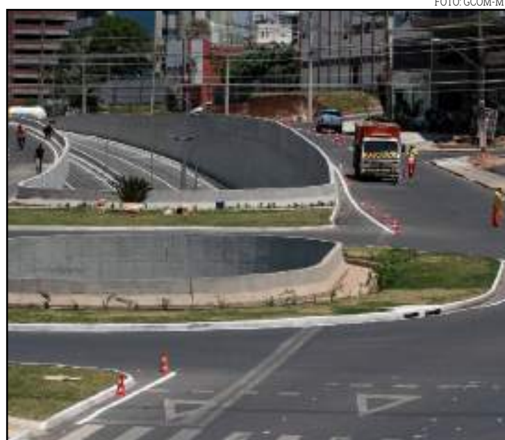
Construção da Jurumirim foi paralisada em 2014, com 97,84% de execução

A construção da Trincheira Jurumirim foi paralisi-