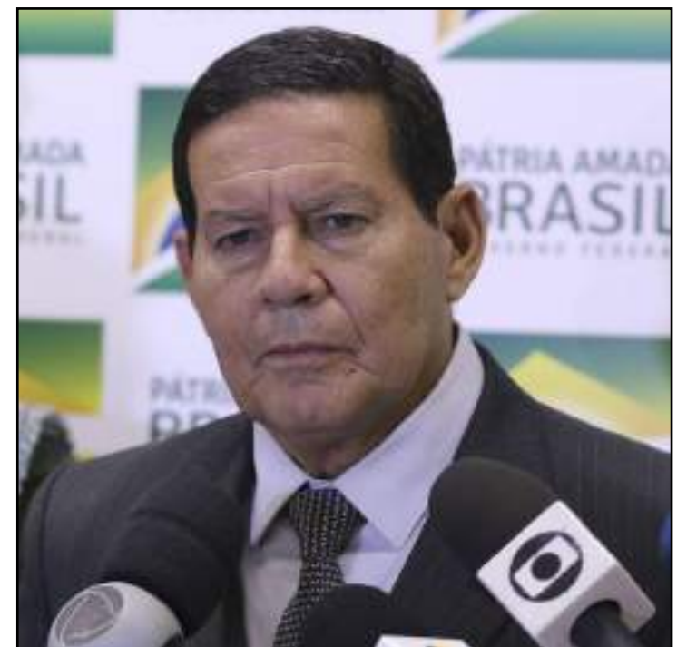
Clareza e paciência são elementos de boa governança