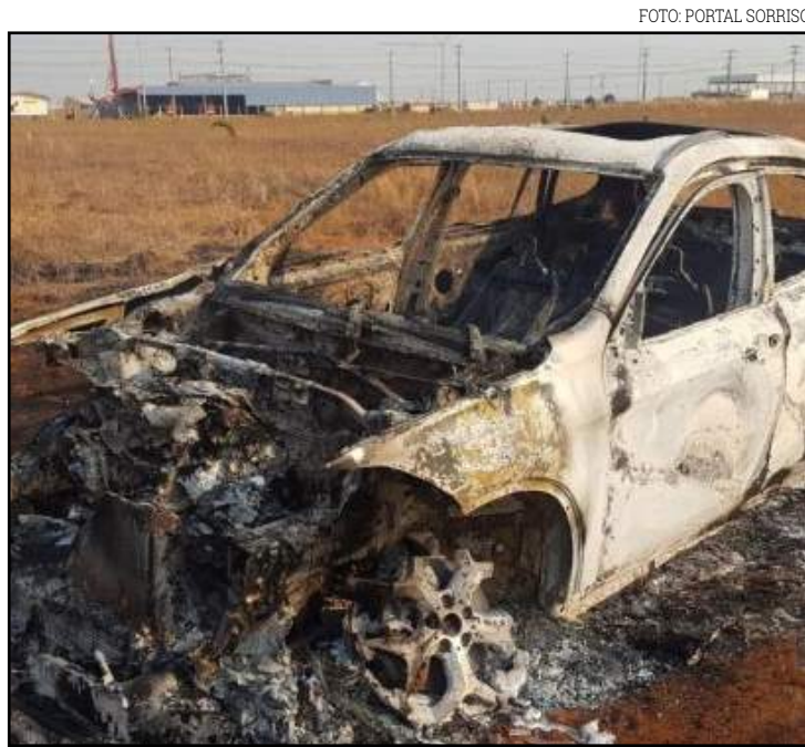
BMW ficou inteiramente queimada

Imagens das câmeras de segurança mostram quando criminosos passaram em frente da casa e saíram com a caminhonete, depois de 1h. Segundo informações, ainda no Recanto dos Passaros, os ladrões também tentaram invadir outra casa, mas fugiram após o barulho dos cachorros. Para invadir a loja de artigos esportivos de Sorriso, os criminosos usaram a Hilux para arrancar a grade. Na fuga, eles levaram muita mercadoria e abandonaram a caminhonete. Em seguida, os bandidos fugiram com a BMW. Nas proximidades do bairro Mário Raiter, eles abandonaram o carro de luxo e atearam fogo.