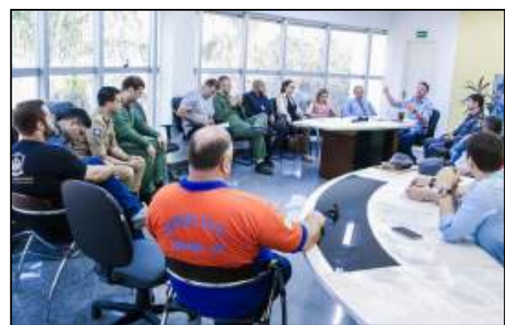
Operação de combate à criminalidade