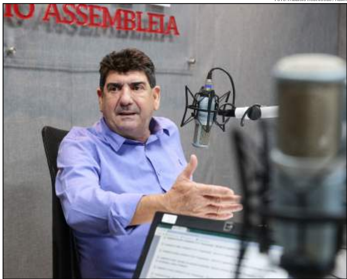
Atualmente existem mais de 700 venezuelanos na capital

O Projeto de Lei nº 714/2019 já recebeu parecer favorável da Comissão de Direitos Humanos, Cidadania e Amparo à Criança, ao Adolescente e ao Idoso da Assembleia Legislativa de Mato Grosso (ALMT).