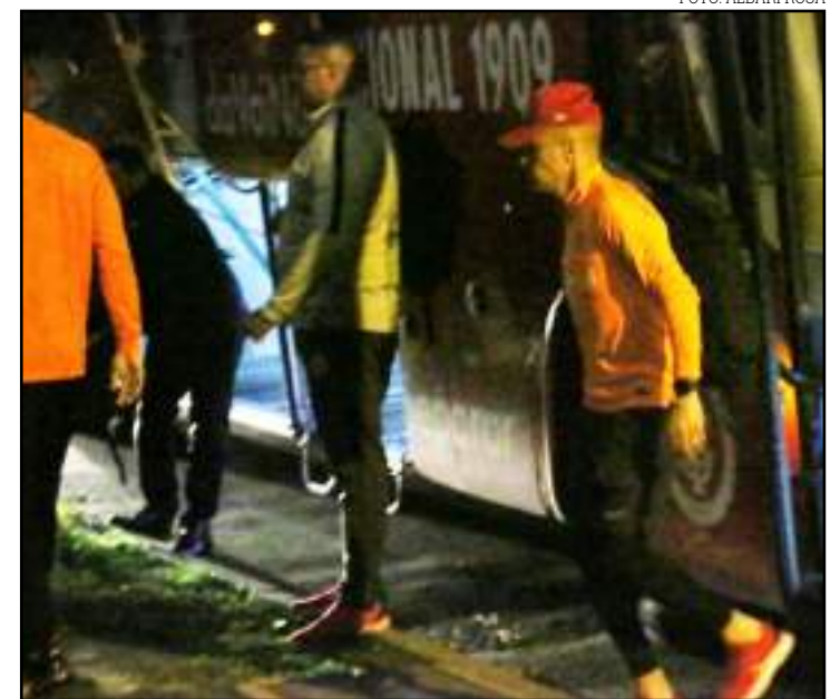
Argentino sentiu desconforto muscular em treinamento