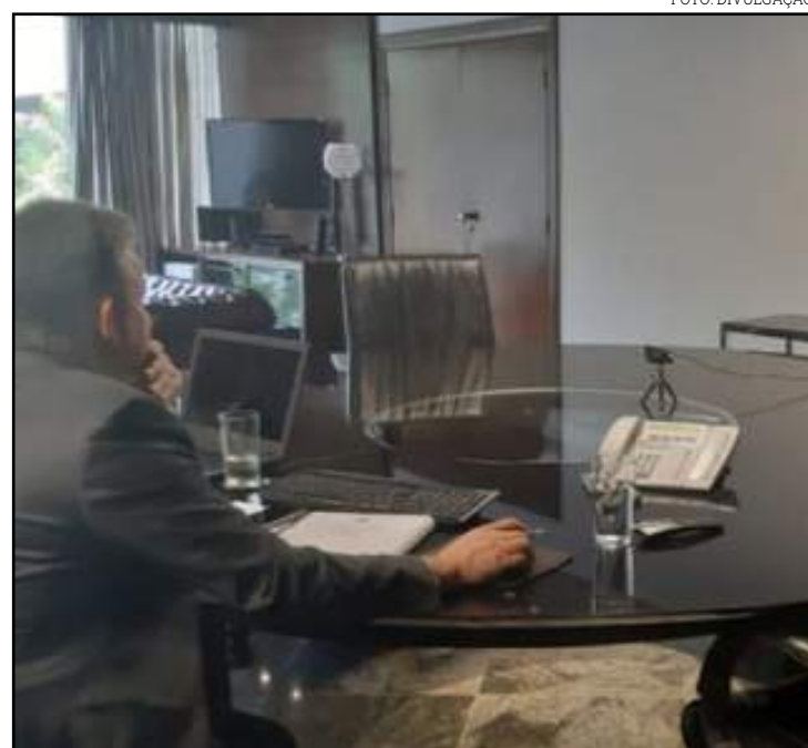
Verba é proveniente do "Fundo da Lava Jato"

A próxima reunião com o ministro será presencial,