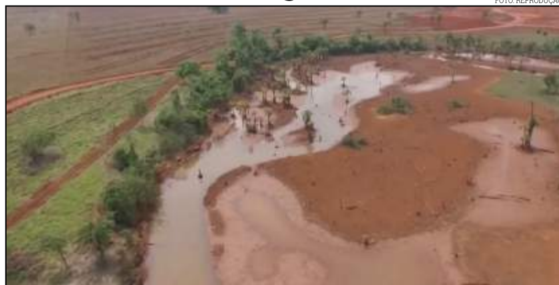
Lagoas da estação que recebem a água do Rio Queimapé estão com níveis baixos

Se a chuva não chegar, o reservatório de água é suficiente para abastecer Tangará da Serra somente pelos próximos 60 dias. O racionamento vai funcionar assim: os bairros serão divididos em dois setores. Cada setor vai receber água dia sim e dia não. Os bairros que possuem poço artesiano não entram no racionamento. Há