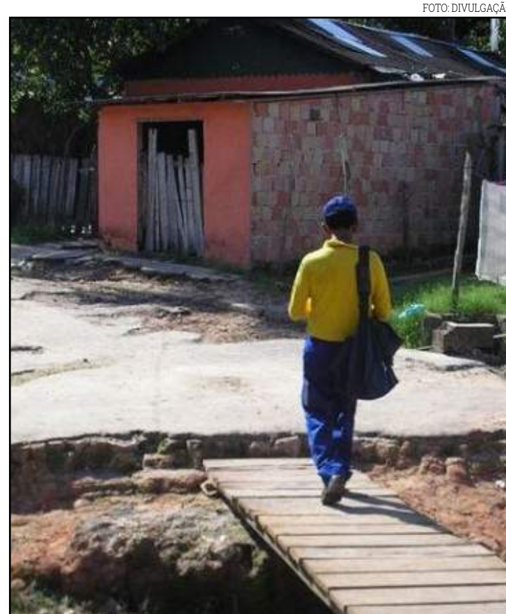
Fique atento aos seus direitos e deveres em caso de atraso

tarão presentes o ministro e também o governador Mauro Mendes. Além do recurso, também será discutido nessa reunião o Fundo Amazônia.