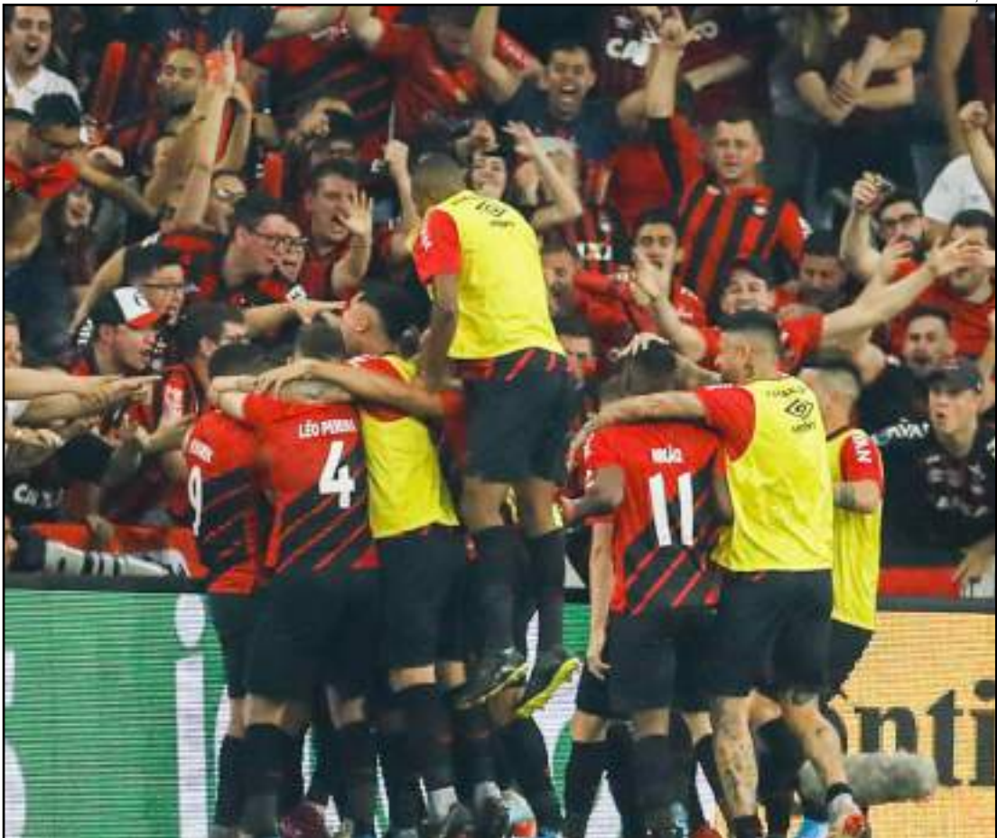
Athletico tem a vantagem do 1 a 0 na decisão após vencer na Arena da Baixada