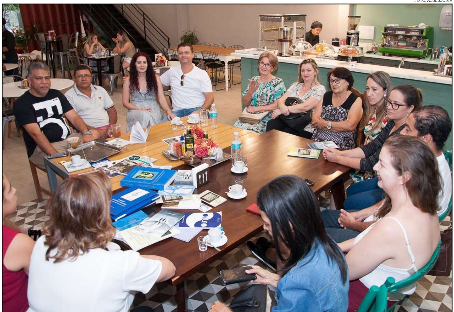
Bate-papo será realizado sábado, no Carmita Emporio Gourmet

É autora da letra da música "Penso", premiada com o 1º lugar no centenário de Guaporé, "Festival Sim, Guaporé Tem Talentos".