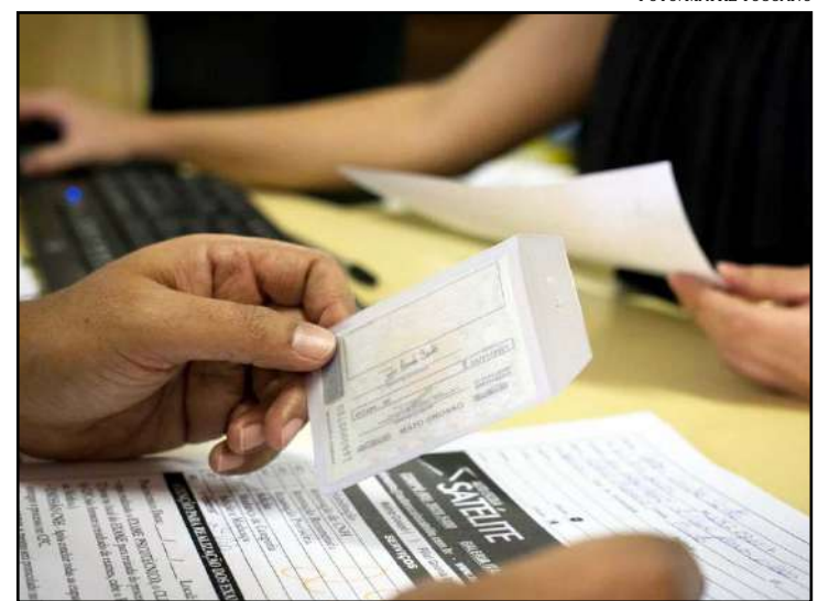
Entre as mudanças estão menor carga horária de aulas práticas