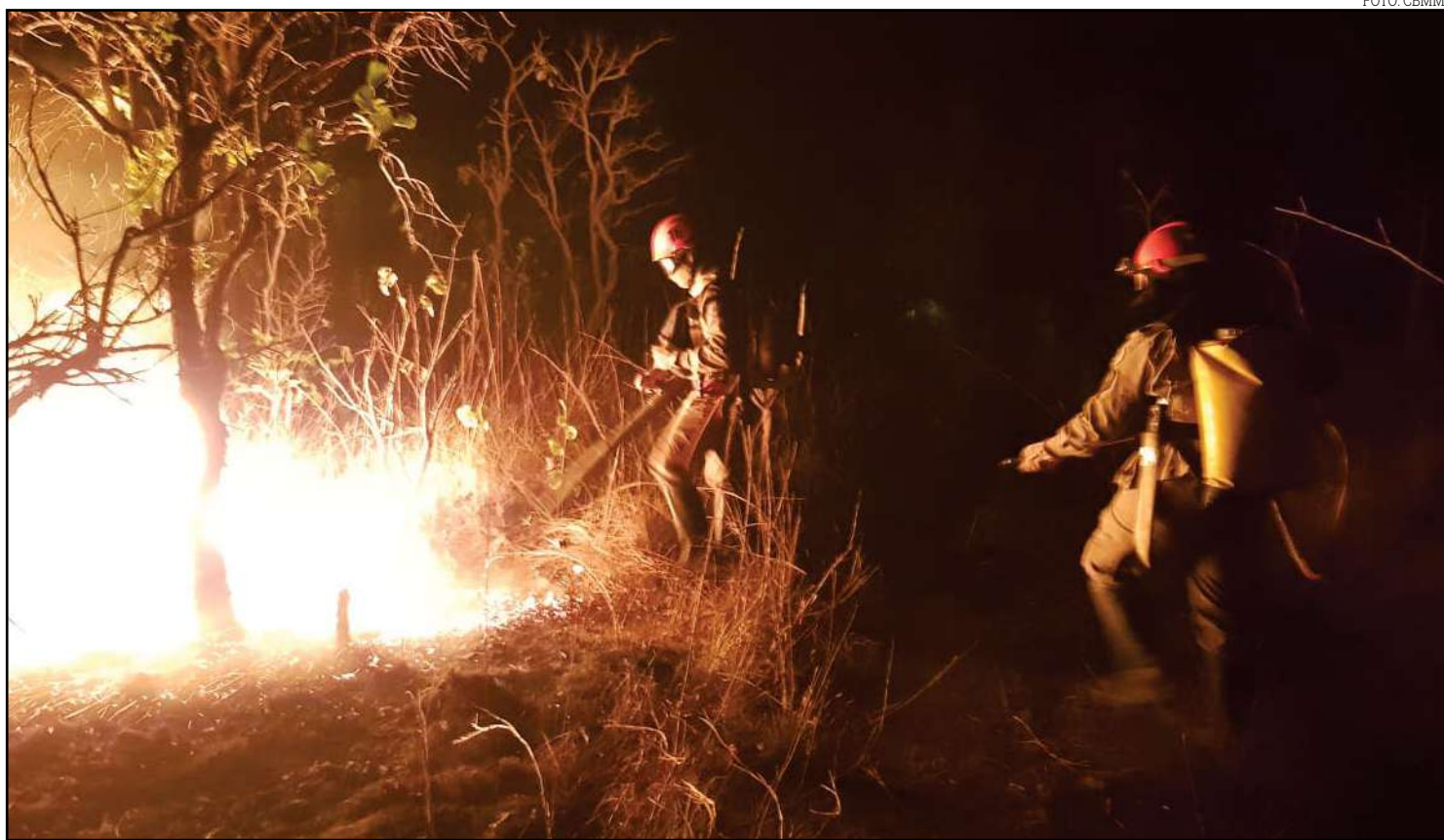
Atualmente, apenas os órgãos ambientais têm autonomia para autuar os responsáveis

Atualmente, apenas os órgãos ambientais têm autonomia para autuar os responsáveis por crimes contra o meio ambiente, enquanto o Corpo de Bombeiros atua na prevenção e combate a incêndios.