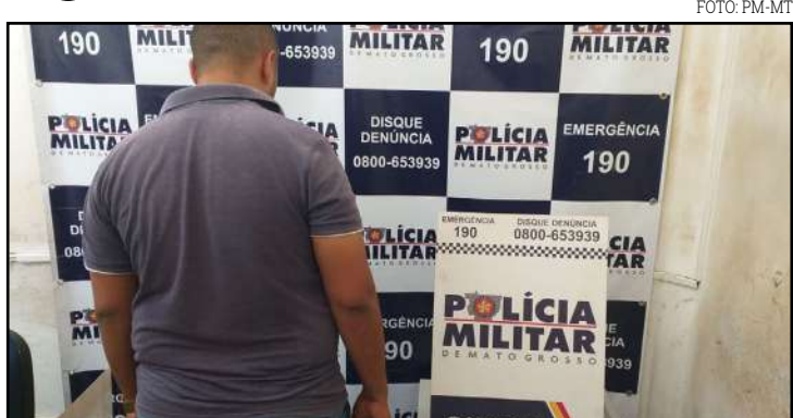
Gerente do banco percebeu que se tratava de um golpe de estelionato

Quando perceberam que a polícia foi chamada, um deles fugiu e o outro acabou preso. Os dois já têm antecedentes criminais, inclusive um deles responde processo pelo crime de estelionato.