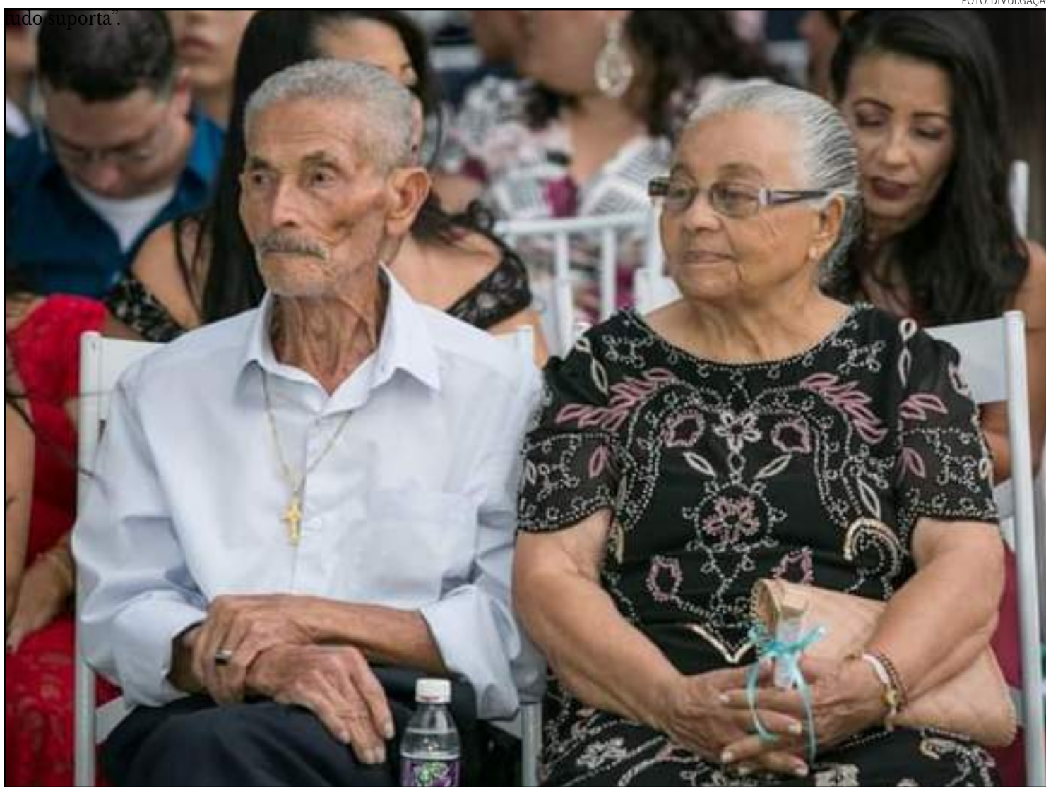
Renovação dos votos será na Igreja Nossa Senhora de Sant'Ana

"O amor é paciente, o amor é bondoso. Não inveja, não se vangloria, não se orgulha. Não maltrata, não procura seus interesses, não se ira facilmente, não guarda rancor. O amor não se alegra com a injustiça, mas se alegra com a verdade. Tudo sofre, tudo crê, tudo espera,