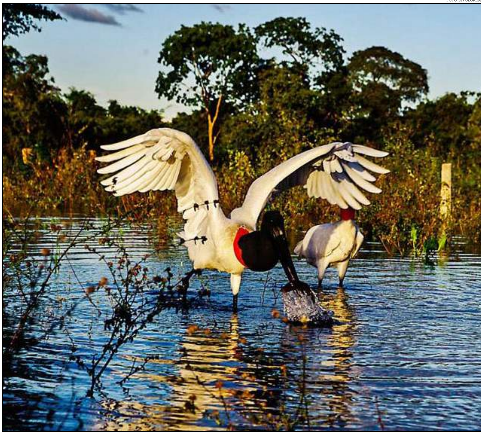
Turismo envolve mais de 50 cadeias produtivas e gera efeitos multiplicadores

Já no dia 27, o Dia Mundial do Turismo, haverá a palestra “Case Birding Pantanal: Oportunidades e Desafios do Turismo de Natureza em Mato Grosso” e homenagem aos representantes do turismo. Será no Sesc Arsenal, às 18h30.