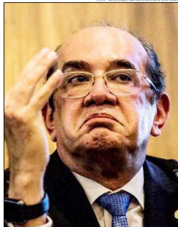
Gilmar Mendes, ministro do STF