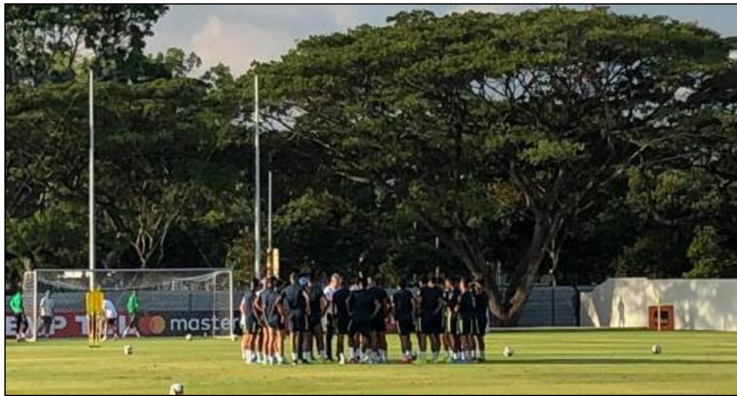
Treino da seleção brasileira em Singapura