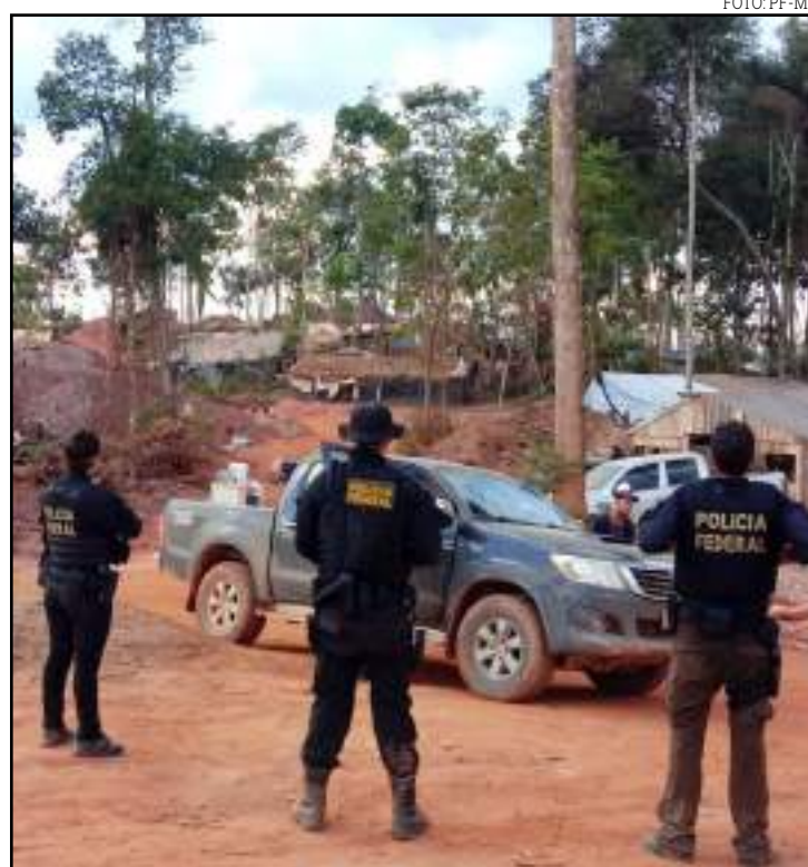
Garimpo foi invadido pela Polícia Federal

A área explorada ilegalmente registrou acidentes, soterramentos, mortes e assassinatos ao longo de quase um ano. A Polícia Civil de Aripuanã disse, em junho deste ano, que o garimpo reúne cerca de 2 mil pessoas. Já a Prefeitura de Aripuanã calcula que são cerca de mil pessoas. A concentração de pessoas de fora da cidade provocou um aumento no fluxo do hospital da cidade,