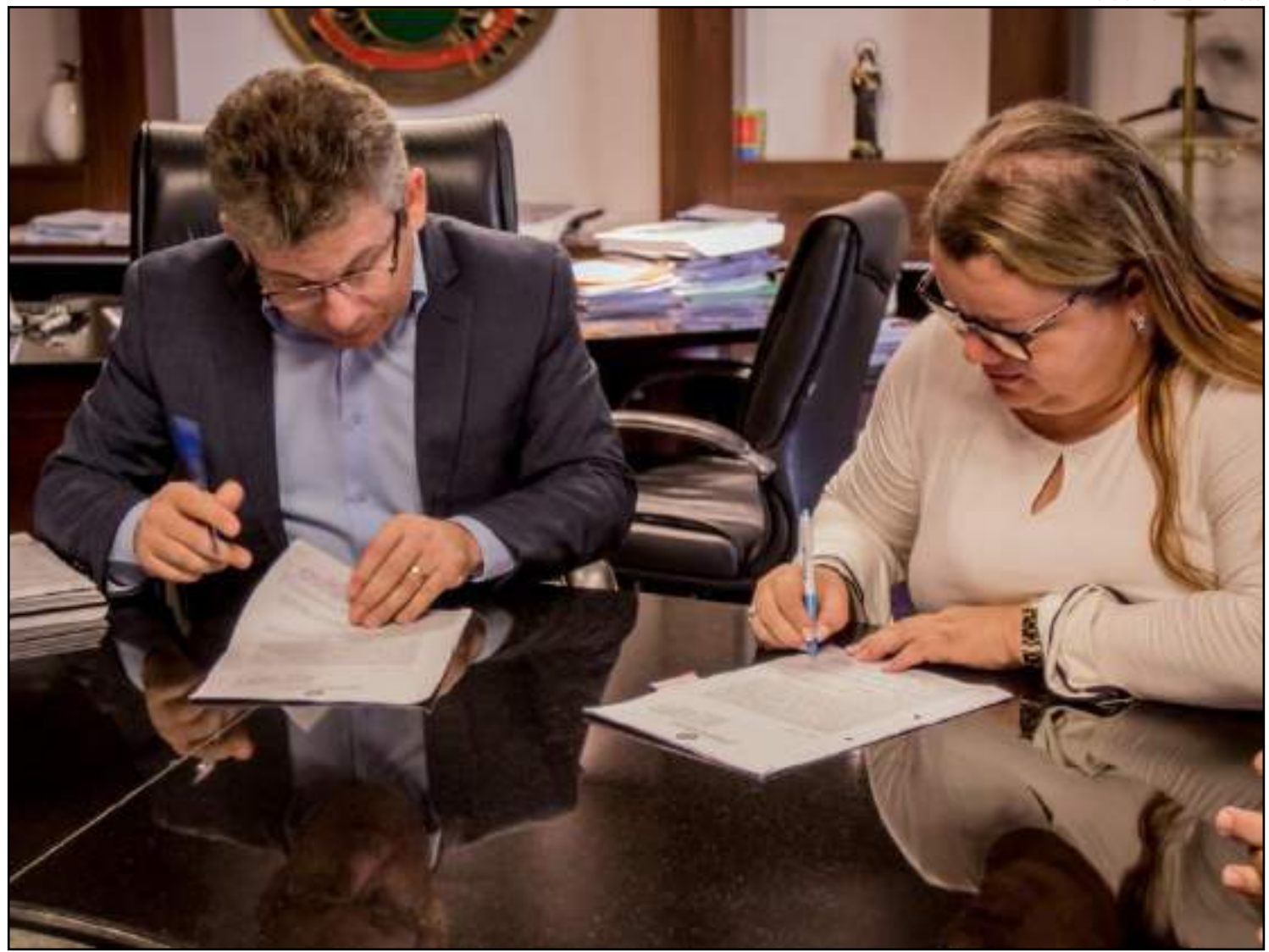
Mendes se reuniu com cúpula da Seduc

Os convênios totalizam um montante de R$ 25,7 milhões. Desse valor, R$ 24 milhões são de recursos do