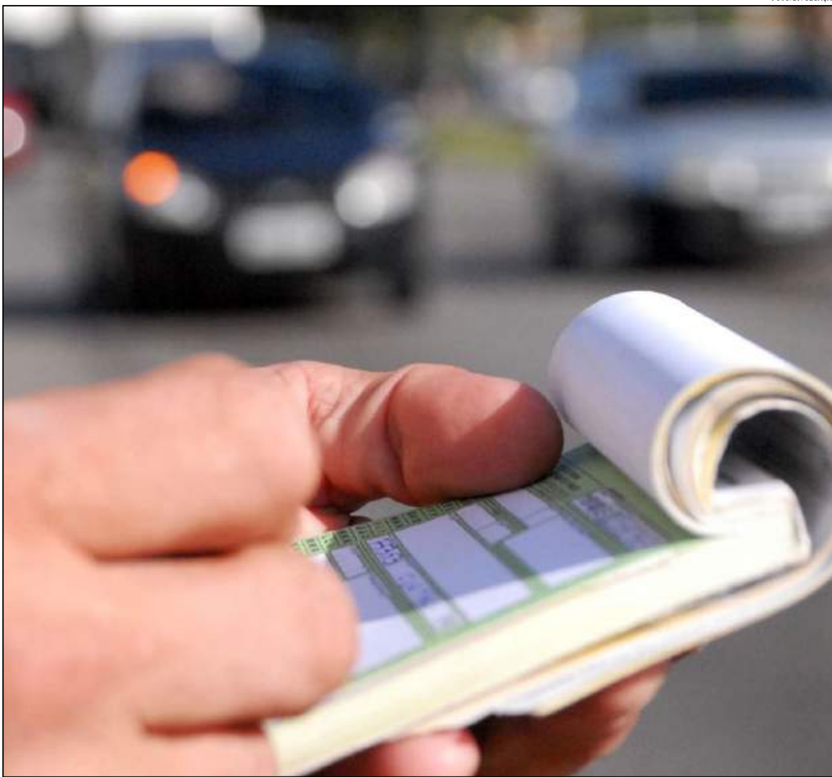
Multas poderão ser parceladas no cartão de crédito