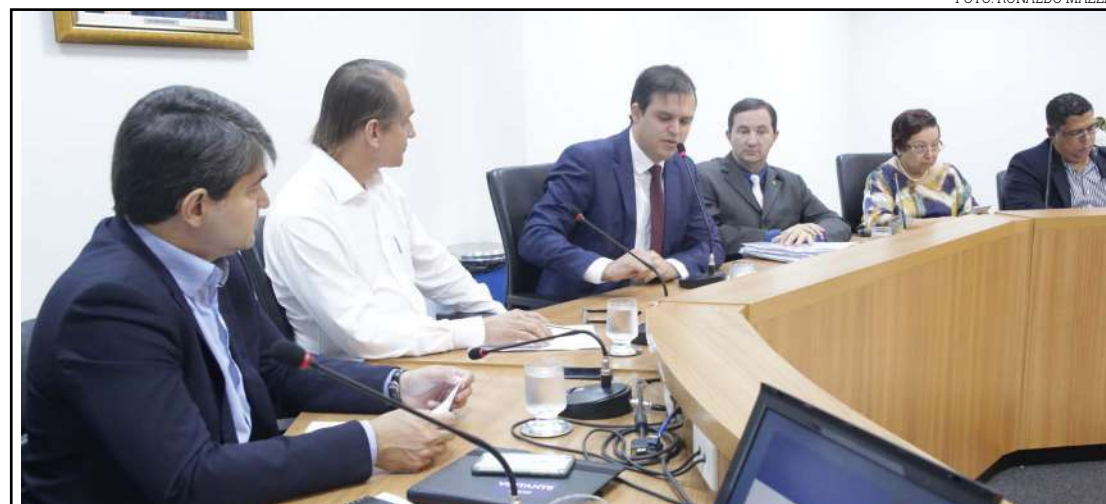
Comissão de Educação da ALMT se reuniu para discutir o assunto

Segundo dados apresentados pela Seduc, Mato Grosso conta, atualmente, com 768 escolas públicas es-