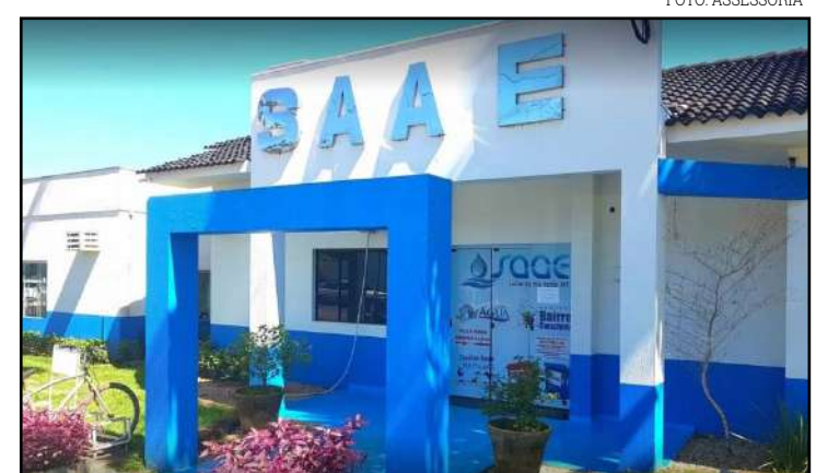
De acordo com a autarquia não há contaminação

Ao final da nota a autarquia rechaça veementemente qualquer alegação infundada e inverídica que existe contaminação da água distribuída em Lucas do Rio Verde, e que tal afirmação serve apenas para causar pânico nos municípios.