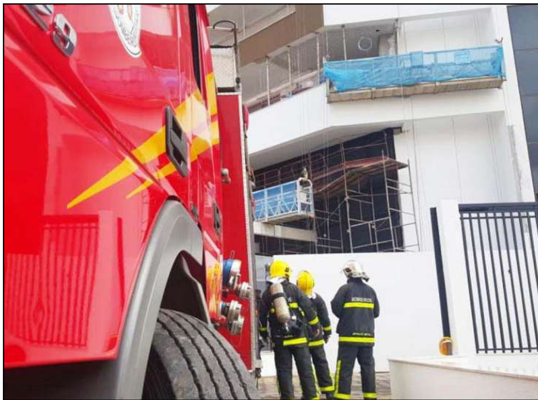
Incidente ocorreu no sétimo andar de prédio em construção no Centro da Capital

Devido à fumaça, alguns funcionários passaram mal e foram atendidos no local. Ninguém ficou ferido.