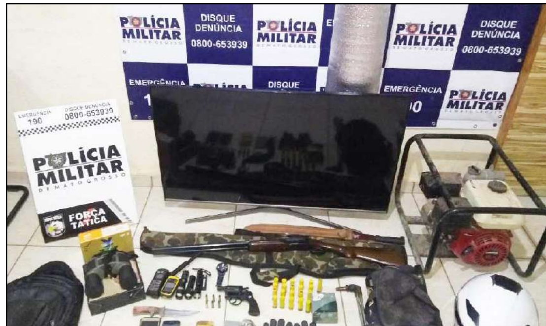
Apreensão foi em Alta Floresta - drogas, armas, munições, GPS, telefone via satélite, binóculos e outros

na residência de um deles, onde encontraram um revólver com seis munições, uma espingarda - calibre 20, com 20 munições intactas. Encontraram ainda GPS, telefone móvel via satélite, binóculos, rolo de manta térmica, que seria usado para driblar sensores de presença e facilitar a prática de furtos. Os dois foram entregues na delegacia.