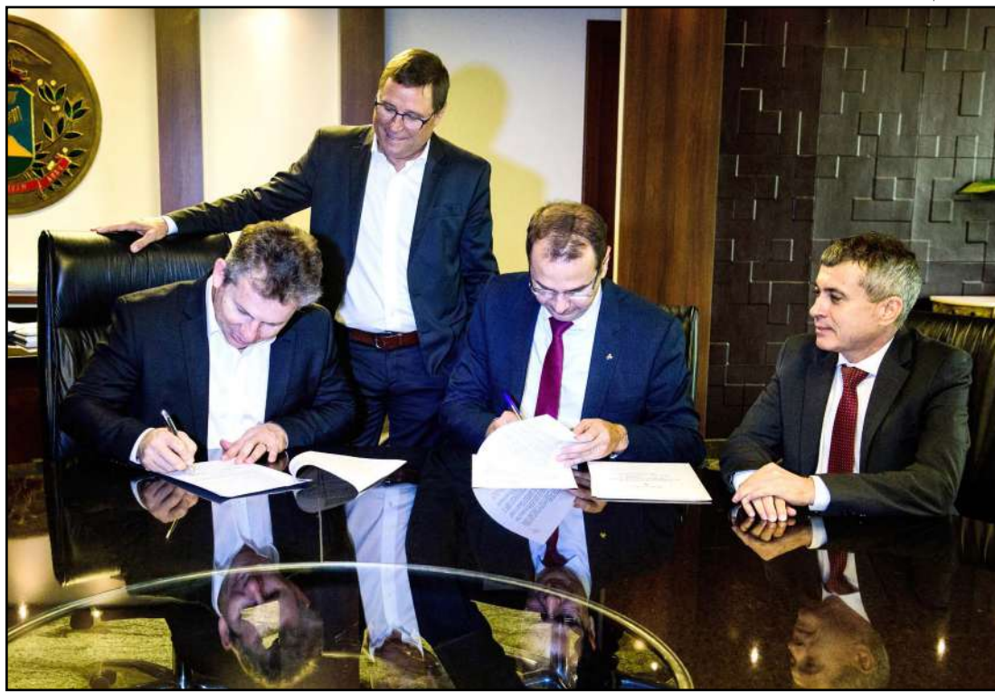
Mauro Mendes na assinatura do protocolo de intenções com o Banco da Amazônia

Para o presidente do Banco da Amazônia, Valdecir José de Souza, o recurso disponibilizado será importante para financiar os projetos privados, na atração de investidores para o Estado. O valor que será disponibilizado em 2019 é maior que em 2018, que foi de pouco mais de R$ 350 milhões. “Somos um banco que tem hoje recursos disponíveis para investir no desenvolvimento de Mato Grosso”.