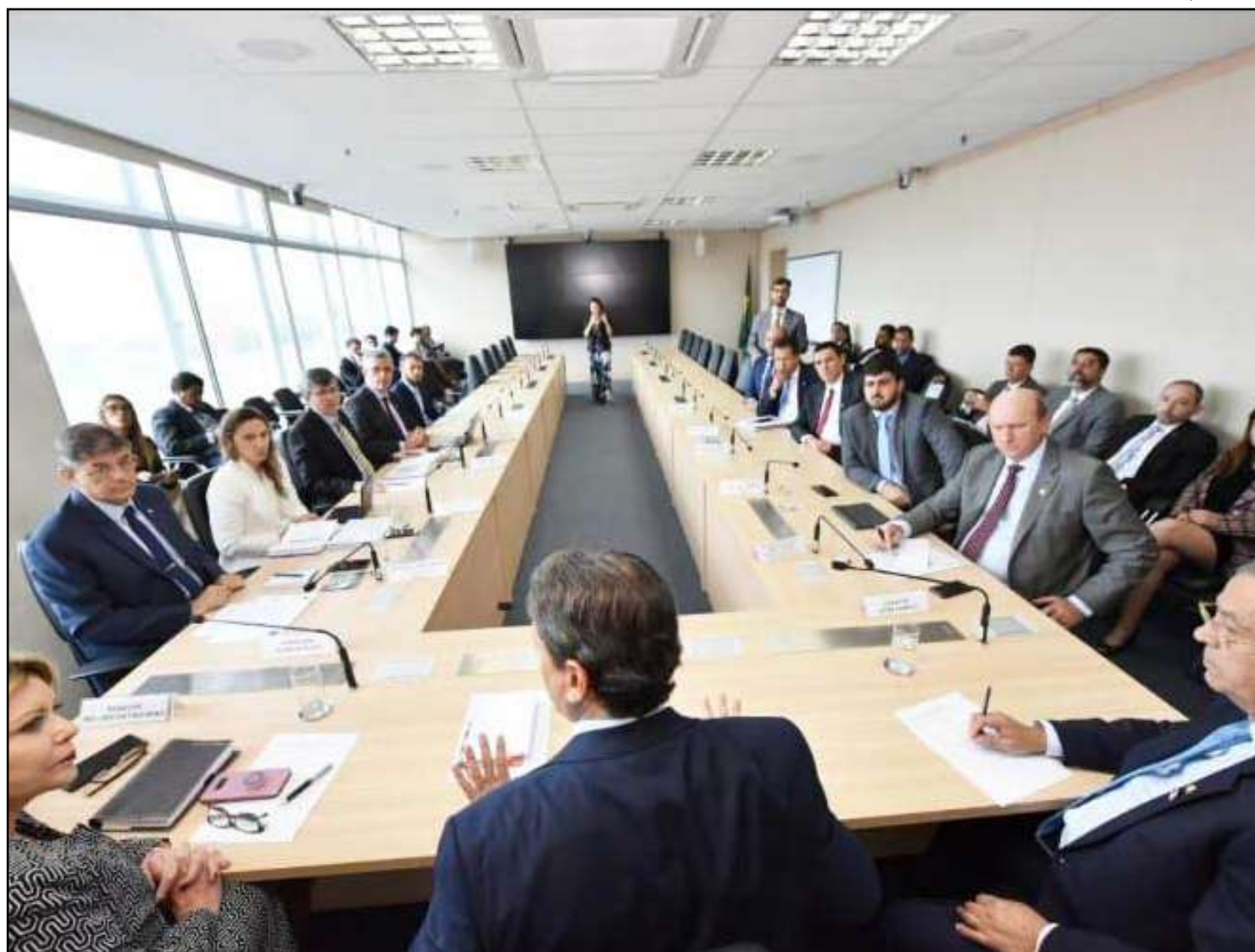
Bancada mato-grossense em reunião com o ministro da Infraestrutura, em Brasília

“Existe um problema com a concessionária Rota do Oeste e o caminho vai ser a troca da concessionária. Acreditamos que em um período curto de tempo isso aconteça e definitivamente ocorra a duplicação Sinop-Cuiabá, já que os pedágios deste trajeto têm sido pagos pela população, mas, lamentavelmente, pouco se fez em