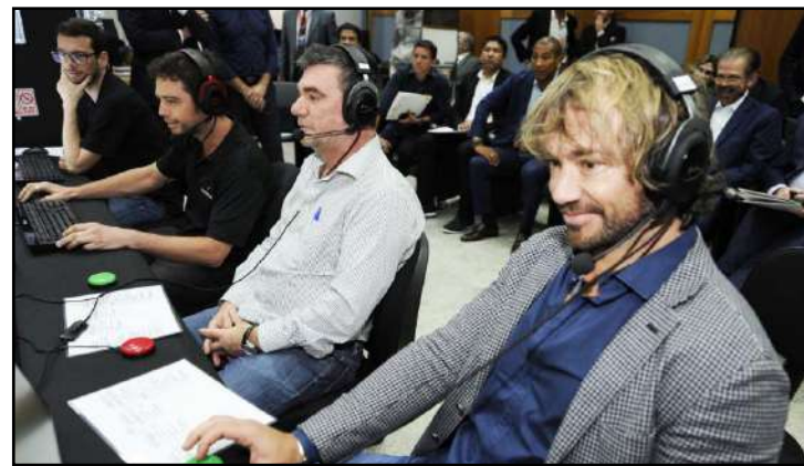
Lugano esteve presente no congresso técnico da FPF