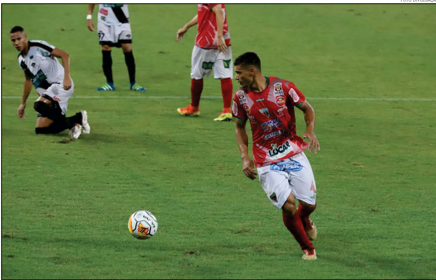
CEOV e Mixto fizeram o clássico da última rodada da fase de classificação

O certo é que o norte do estado terá apenas um representante na semifinal. Quem passar enfrenta o vencedor de Cuiabá x Dom Bosco. As quartas-de-final do Campeonato Mato-grossense começam neste final de semana.