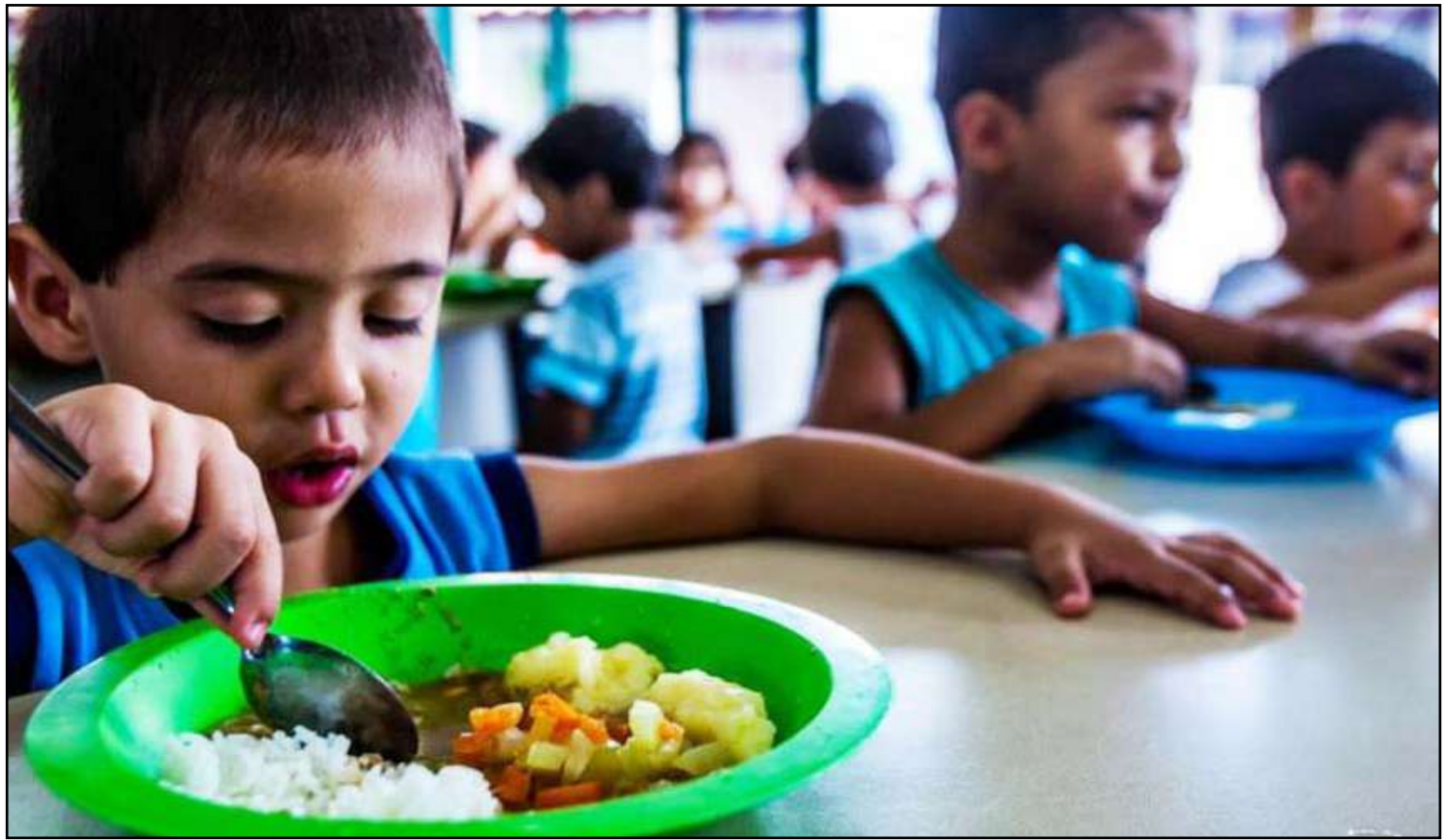
Mais de 1,5 mil escolas em MT adotaram programa que incentiva alimentação saudável e prática de exercícios físicos

Escolher local adequado para comer – bebês e crianças não param para comer espontaneamente. Evitar tentar fazê-los comer enquanto andam, no carro ou no elevador. Podem causar engasgos e traumas na boca.