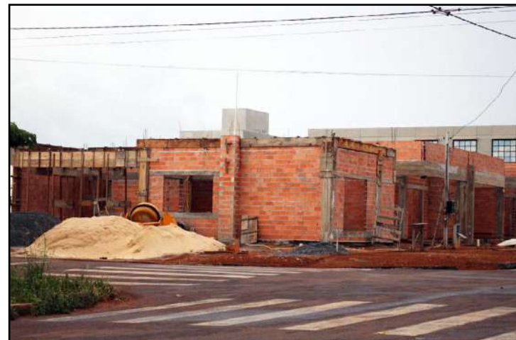
Prefeitura de Sinop emitiu, em 2018, mais de 1,7 mil documentos