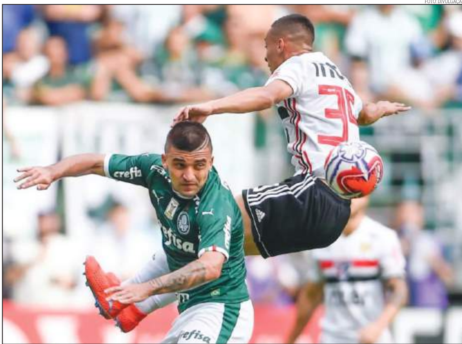
Palmeiras tem jogadores prontos, enquanto SP prioriza jovens da base

Nesta quarta, o Palmeiras terá a grande oportunidade de mostrar que a experiência de seus jogadores pode fazer a diferença diante de um adversário que usa e abusa da juventude. Resta saber como Mano Menezes e Fernando Diniz, que ainda estão iniciando suas respectivas trajetórias no Verdão e no São Paulo, respectivamente, prepararão seus jogadores para o esperado clássico no Allianz Parque.