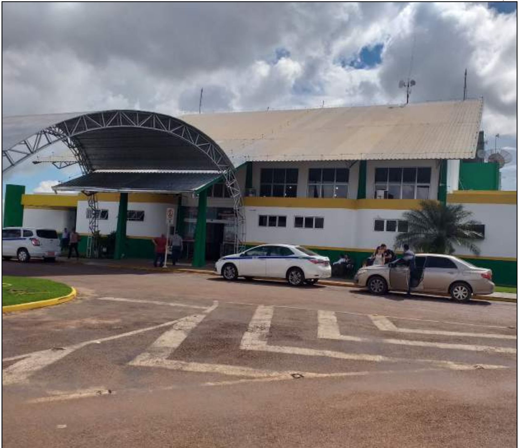
Houve queda no número de embarques e desembarques em Sinop

A aeronave vai sair de Guarulhos às 9h25 com previsão de pousar às 11h10. O retorno ocorrerá às 11h40 para chegar à cidade paulista às 15h15. Também existe previsão de ampliar novos voos, mas ainda sem definição de prazos pela empresa.