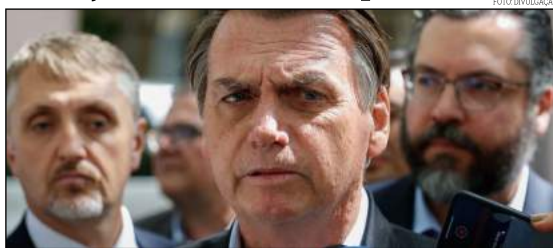
Bolsonaro quer seu próprio partido

Bolsonaro afirmou que seu sonho seria criar um partido até março e ter cerca de 200 candidaturas pelo país nas eleições municipais do ano que vem.