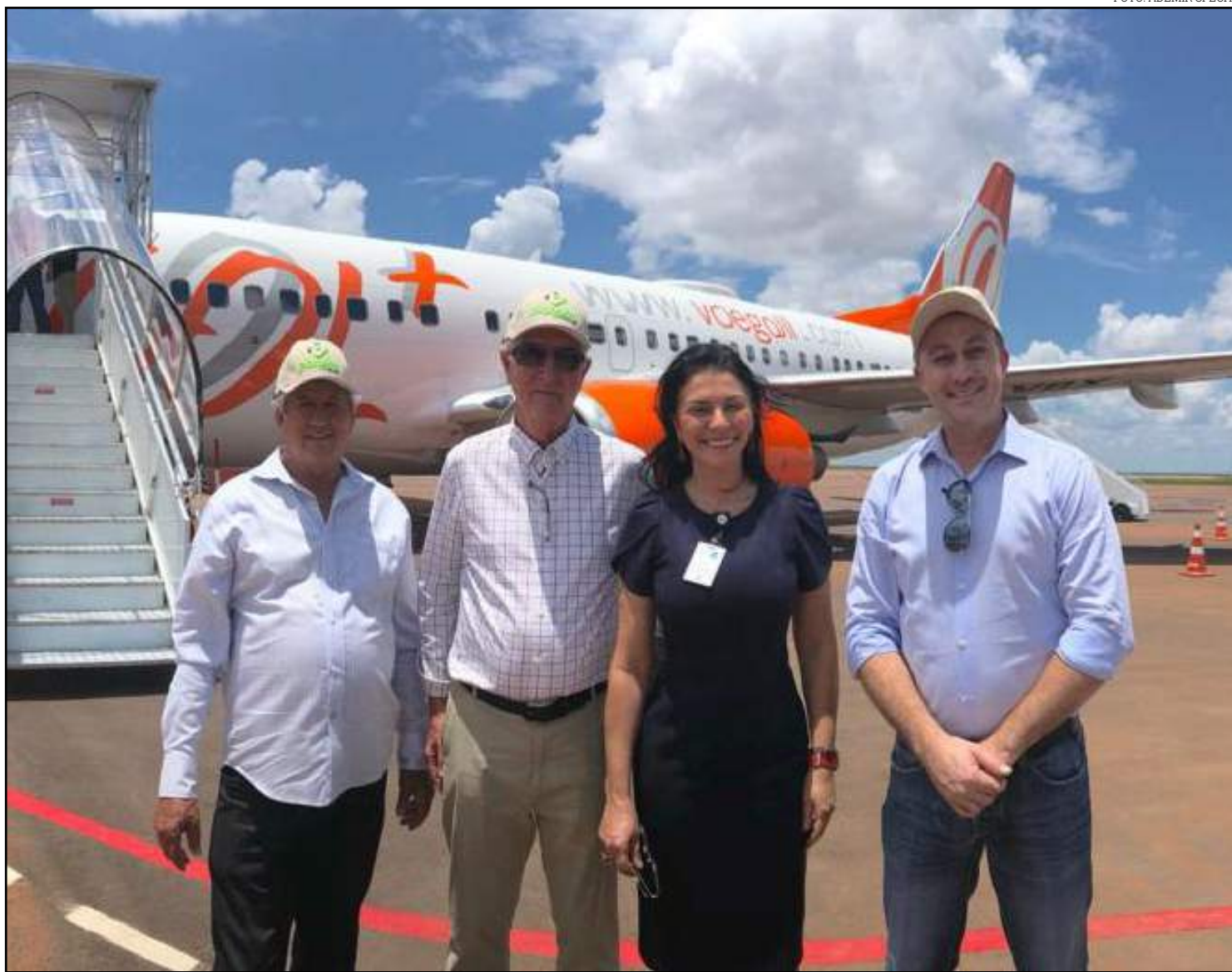
A prefeita esteve presente na chegada do voo da Gol

Com as operações da GOL, Sinop passa a ter 4 voos diários. Uma empresa opera para Cuiabá e demais localidades com dois voos diários e retomou no dia 1º de junho o voo diário para Viracopos, em Campinas (SP), em aeronaves com capacidade de transportar até 118 passageiros.