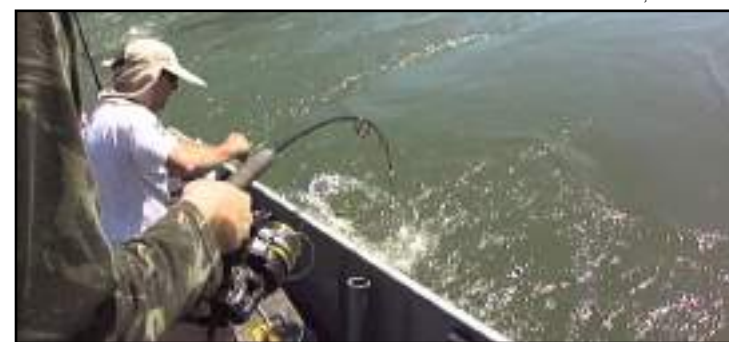
Projeto deve ser votado ainda este ano

“Agora chegou a hora de sentarmos à mesa, junto com a Assembleia, discutirmos estas sugestões e melhorarmos este projeto. Este é o grande objetivo”, afirmou o secretário-chefe da Casa Civil, em entrevista ao Programa Resumo do Dia, na TV Brasil Oeste.