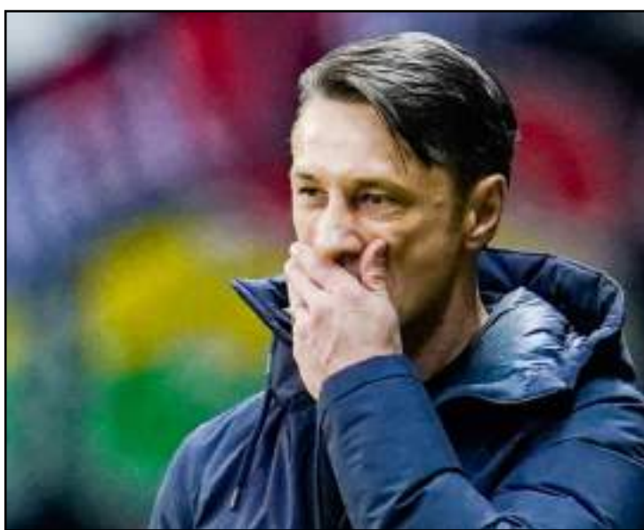
Niko Kovac durante a derrota do Bayern para o Eintracht Frankfurt

agradeceu a Kovac e apontou os problemas que resultaram na decisão: “O desempenho de nossa equipe nas últimas semanas e os resultados nos mostraram que havia necessidade de ação. Uli Hoeness (presidente), Hasan Salihamidzic (diretor esportivo) e eu tivemos uma conversa com Niko e chegamos consensualmente a um acordo. Todos lamentamos esse acontecimento. Em nome do Bayern, gostaria de agradecer a Niko Kovac pelo seu trabalho, especialmente pelos títulos na última temporada”. Kovac se despede do Bayern com três troféus: Supercopa, Campeonato Alemão e Copa da Alemanha de 2018/19. Ele comandou o time em 65 jogos, com 45 vitórias, 12 empates e oito derrotas. O auxiliar Hansi Flick será o treinador do