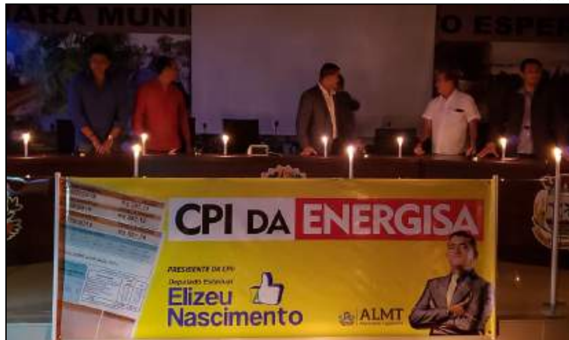
Em Porto Esperidião audiência pública foi à luz de velas

Cerca de 80% dessas reclamações são referentes à cobrança feita de forma indevida ou até mesmo abusiva. Resultado da falta de leituras efetivas nas unidades consumidoras. Ou seja, sequências de meses faturados por estimativa que resultam em acúmulo de consumo, que depois é cobrado em uma única fatura.