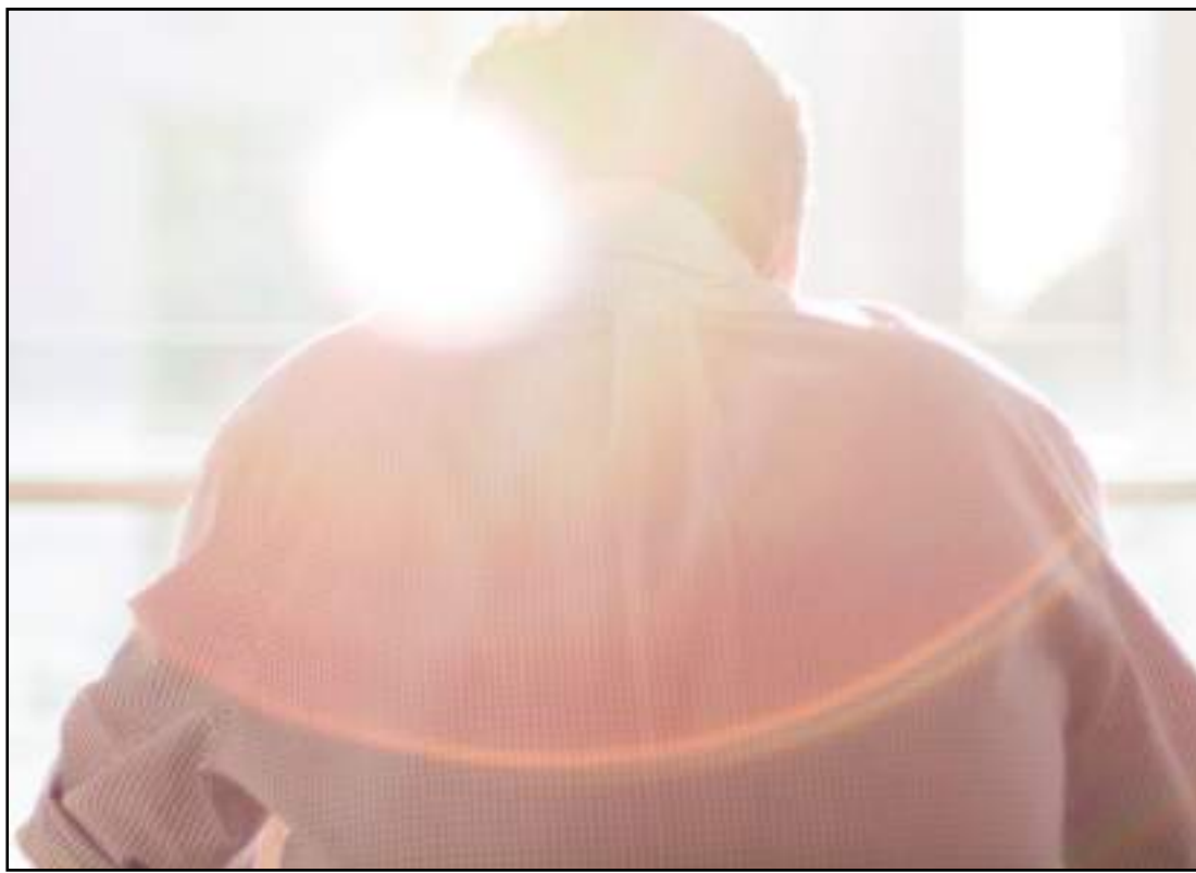
Síndrome de Burnout foi reconhecida como doença somente em 2019

E o cansaço pode ser tanto que o acometido procura a cama tão logo chegue em casa. A exaustão também torna muitas vezes difícil levantar da cama", afirma.