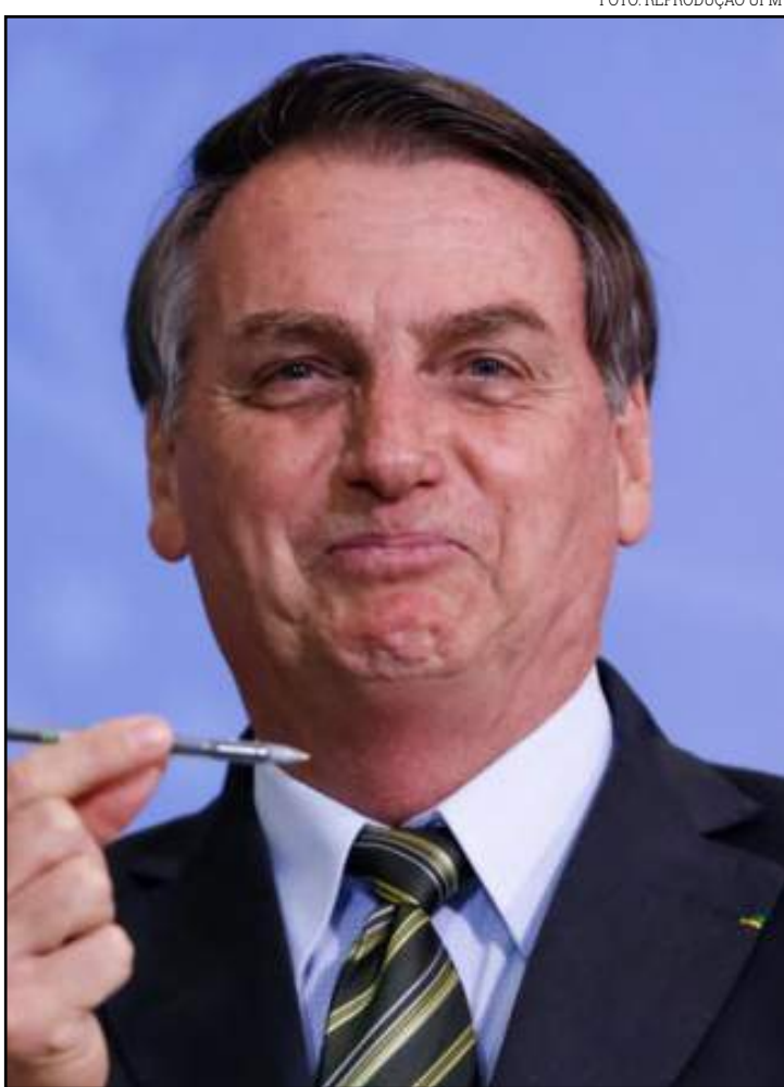
Com a medida, governo quer evitar fraudes

A MP extingue também o Seguro de Danos Pessoais Causados por Embarcações, ou por sua carga, a pessoas transportadas ou não (DPPEM). Segundo o ministério, esse seguro está sem seguradora que o ofereça e inoperante desde 2016.