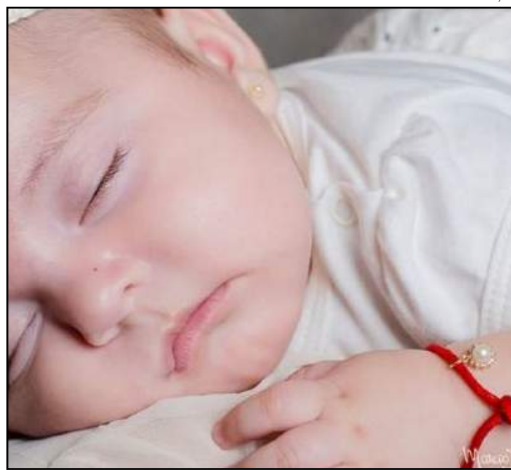
Exemplo de pulseira Soutache: pingente será um pouco diferente

Não podem doar sangue quem teve diagnóstico de hepatite após os 10 anos de idade, mulheres grávidas ou amamentando, pessoas expostas a doenças transmissíveis pelo sangue como AIDS, hepatite, sífilis e doença de chagas, usuários de drogas e aqueles que tiveram relacionamento sexual com parceiro desconhecido ou eventual, sem uso de preservativos.