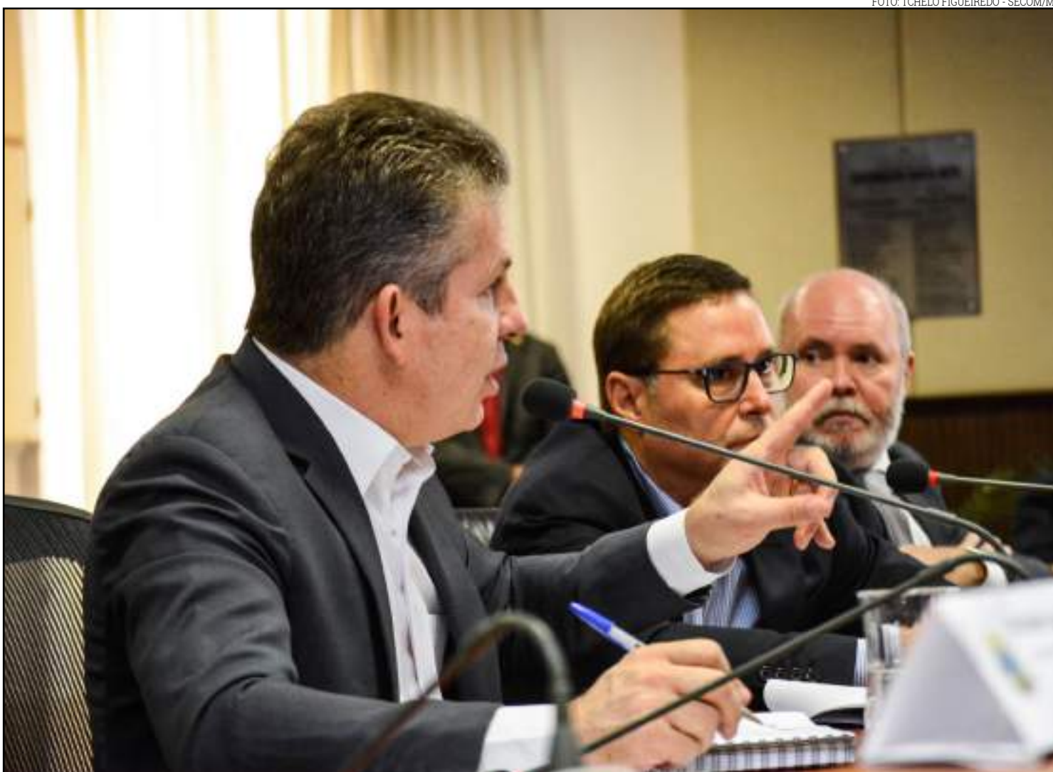
Governador está preocupado com o rombo da Previdência

De acordo com Mendes, entre 200 e 300 servidores se aposentam em Mato Grosso todo mês e prevê que caso uma reforma local não seja realizada, em 2022 Mato Grosso terá mais servidores inativos que em atividade.