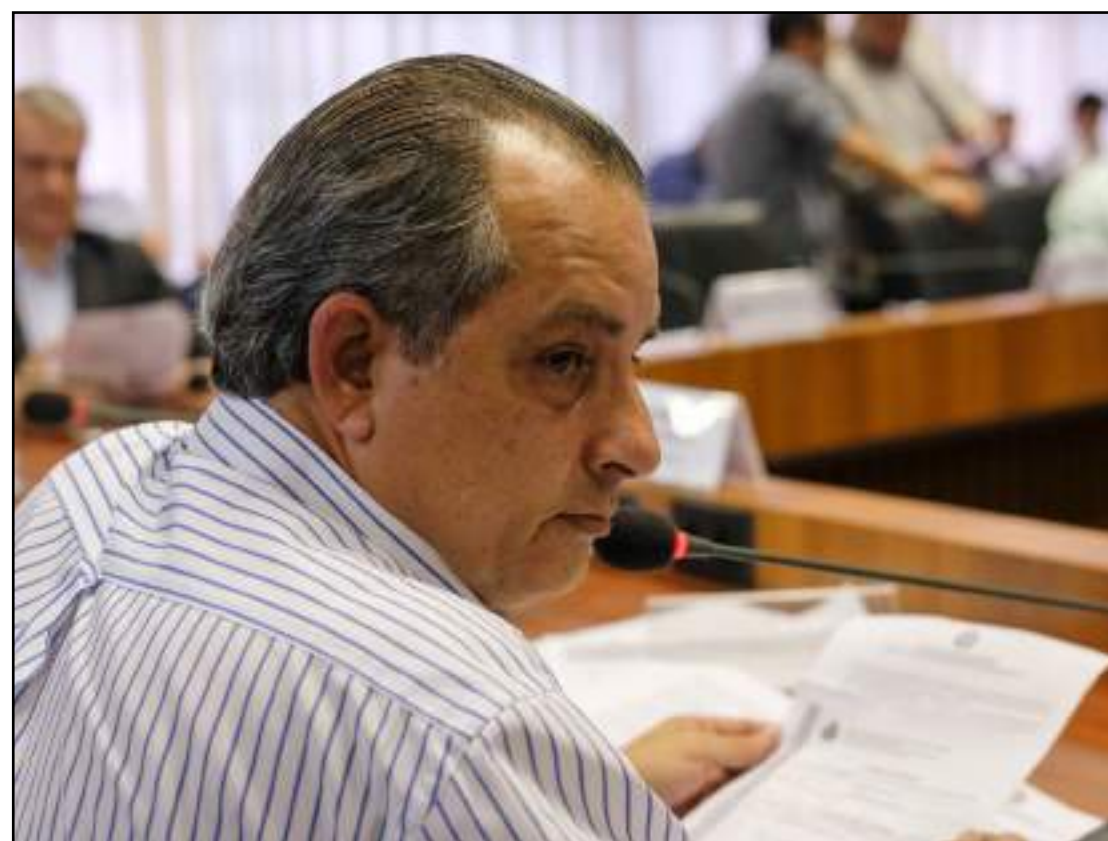
Governo não acredita que acordo seja desfeito

"Acredito eu que não temos nenhum tipo de paralisação no fornecimento de gás, até porque a YPFB boliviana não tem contrato