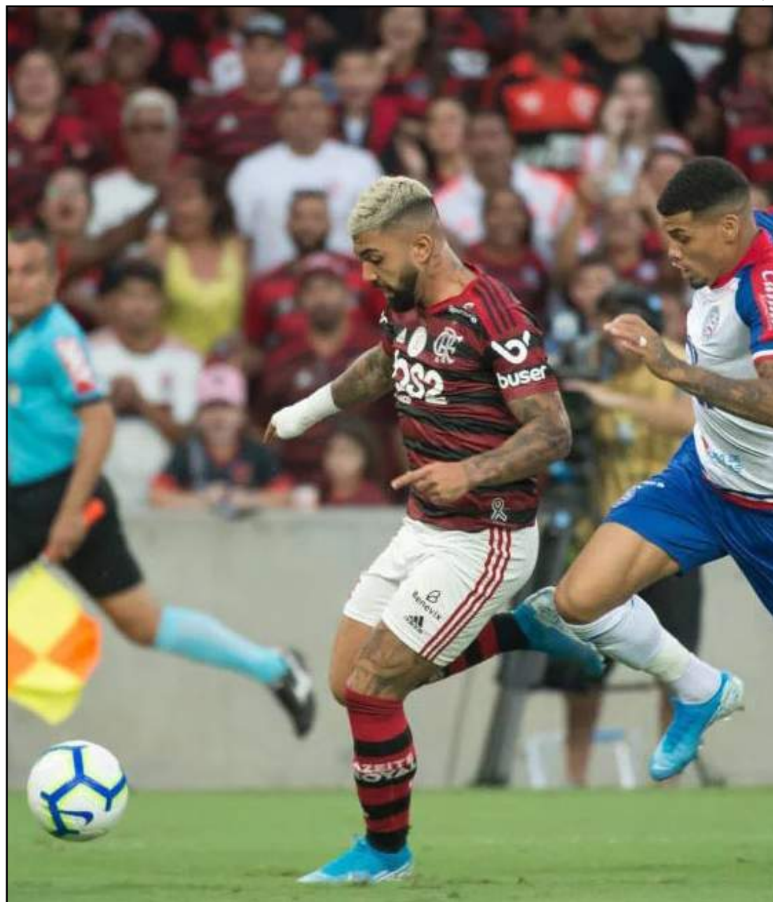
Flamengo de Gabigol pode somar ser campeão com 5 rodadas de antecedência