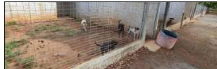
Cerca de 30 animais já estão prontos para ganhar um novo lar