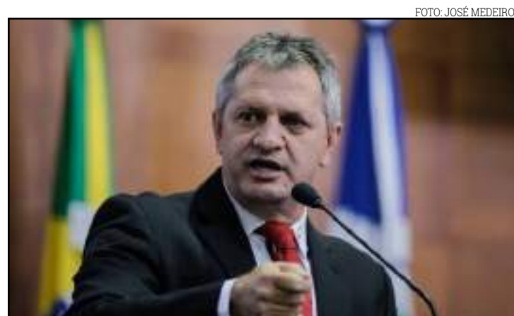
GT Terra contou com deputados de comissões da Assembleia e representantes de instituições

O novo decreto autoriza o Intermat a corrigir o valor da pauta anualmente, em janeiro, de acordo com o IGP-M e não retroage aos valores já quitados entre fevereiro e novembro. Para este período, o preço mínimo da pauta foi definido em R$ 414,28 para o Grupo 1, em R$ 295,85 para o Grupo 2 e em R$ 125,31 para o Grupo 3. Apesar da conquista, o GT Terra continua instalado na Assembleia e trabalhando para reformulação do Código de Terras de Mato Grosso.