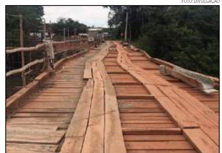
Medida visa prevenir o desabamento da travessia

A suspensão do trânsito na localidade, porém, não afeta o tráfego de ambulâncias ou ônibus escolares, considerados essenciais, pelo fato de a ponte ainda não ligar diretamente dois ou mais municípios.