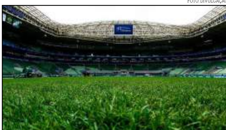
Chance de rebaixamento do Alvinegro cai para 16% com o triunfo