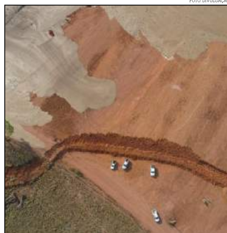
Rejeitos de barragem que estourou no dia 1º de outubro

O material se encontrava retido nos diques com risco aparente de futuro extravasamento em caso de uma chuva torrencial. A observação foi feita no dia do ocorrido, quando foi feita a primeira vistoria. Pelo rompimento, o status quo do empreendimento é de total