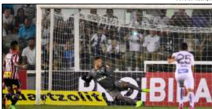
Última vitória foi justamente contra o Santos, na Vila Belmiro

A ideia de instalar o gramado sintético no Allianz Parque agrada à WTorre, que poderia diminuir significati-