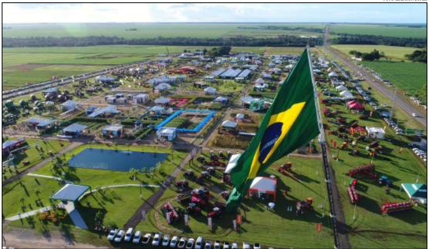
Evento reuni os principais produtores da região em um só local

O evento visa contribuir com os produtores na busca por respostas que facilitem o cotidiano do setor produtivo.