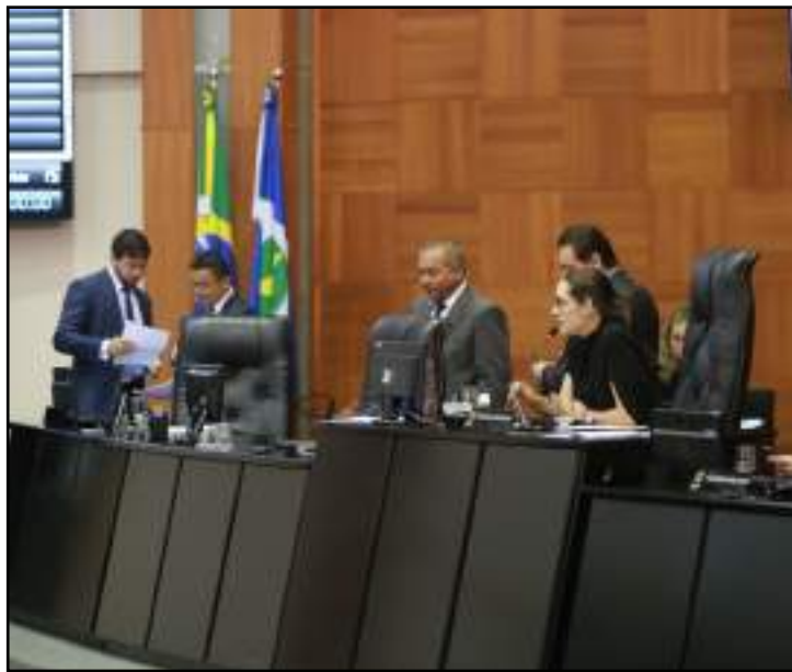
Deputados derrubam veto de Mauro Mendes

Nos próximos dias, o PL entrará em vigor e irá