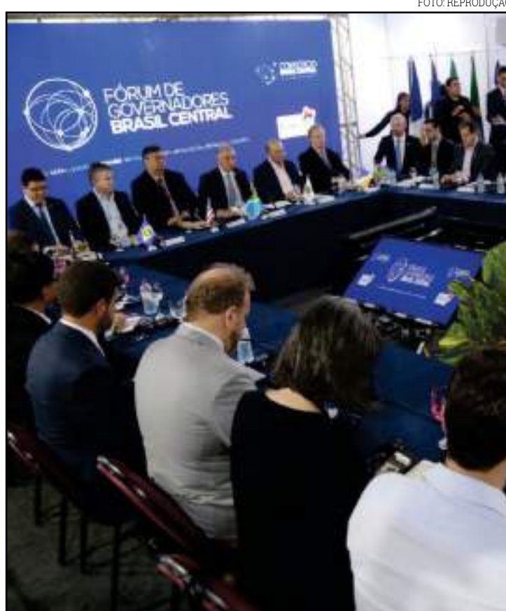
Reunião do consórcio Brasil Central