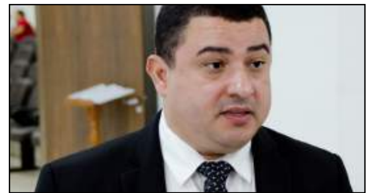
Projeto visa desburocratizar a economia privada