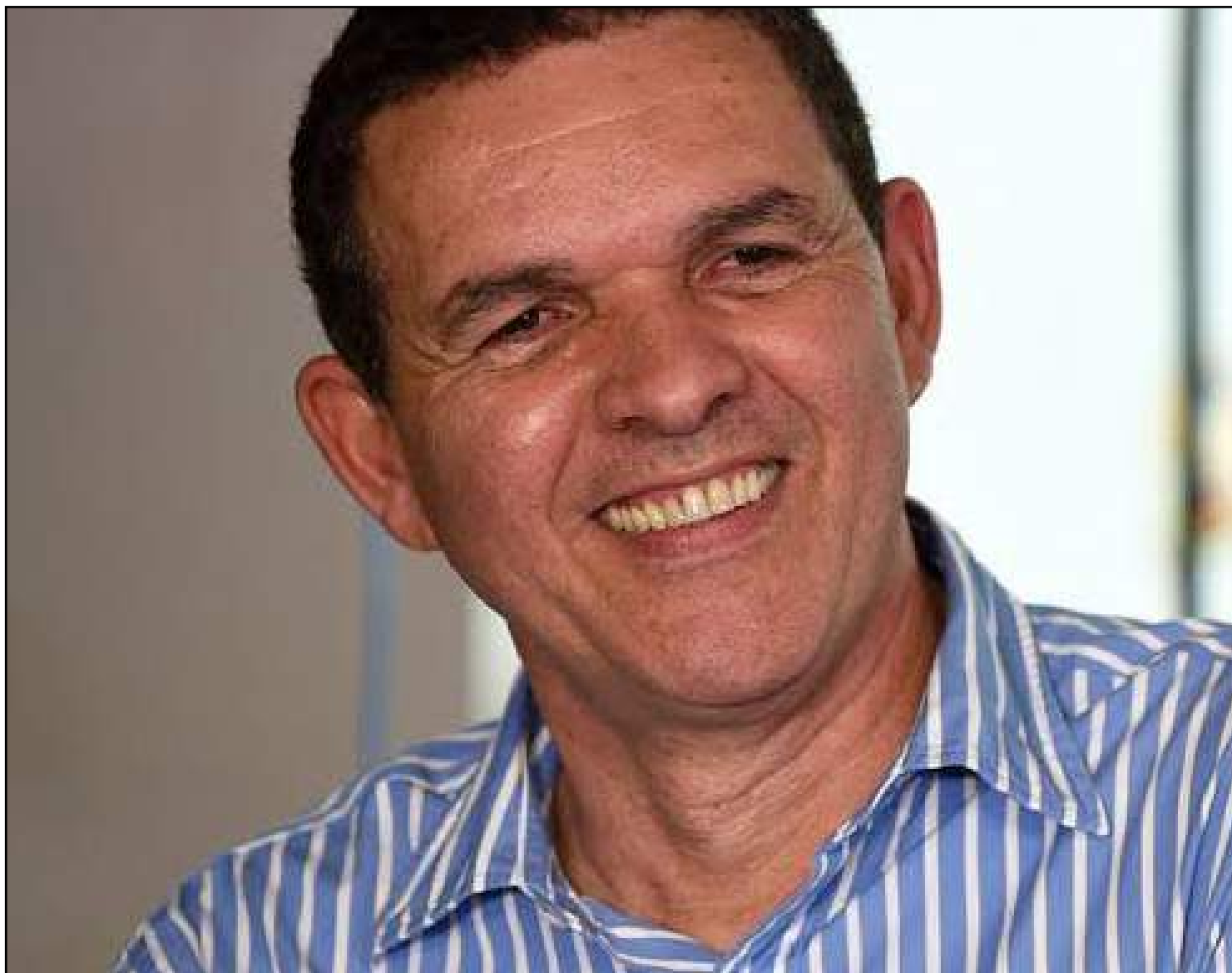
Ex-prefeito quer voltar ao Paço Municipal

Buscando um alinhamento que vem desde a eleição estadual de 2018, o MDB que apoia Mauro Mendes ao governo, torce para que agora tenha uma retribuição do Democratas ao MDB na Capital do Nortão. "Temos uma conversa muito boa com o DEM. Acho que a campanha não será polarizada, teremos aí três a quatro candidatos em Sinop. Quanto mais candidatos melhor para sentir e debater o que Sinop precisa", disse.