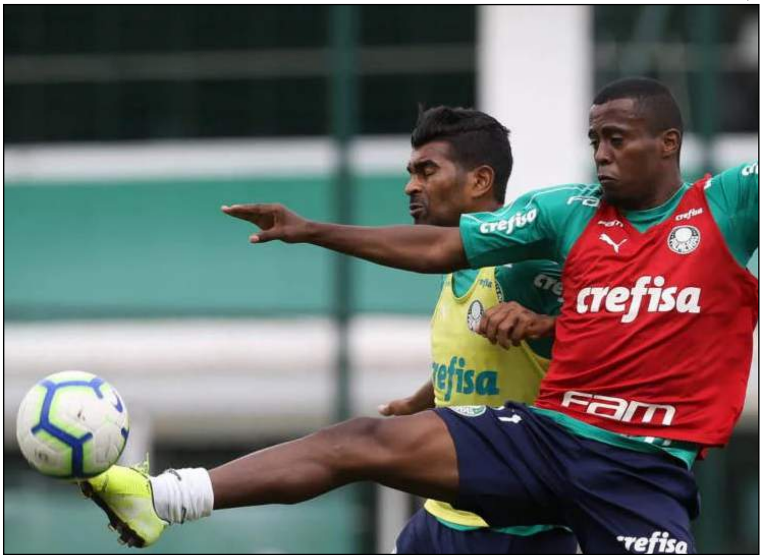
Palmeiras treina sem treinador fixo para 2020

classificou o técnico Mano Menezes, demitido após um período de apenas 20 partidas, como "alguém que não deveria ter vindo". A torcida