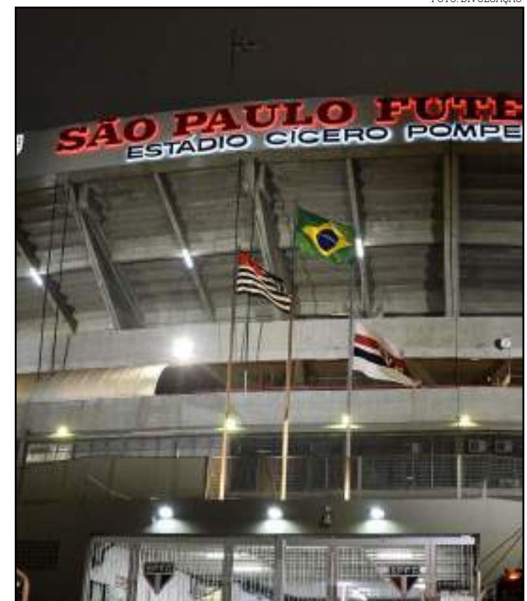
São Paulo aposta em Morumbi cheio diante do Inter, em confronto direto