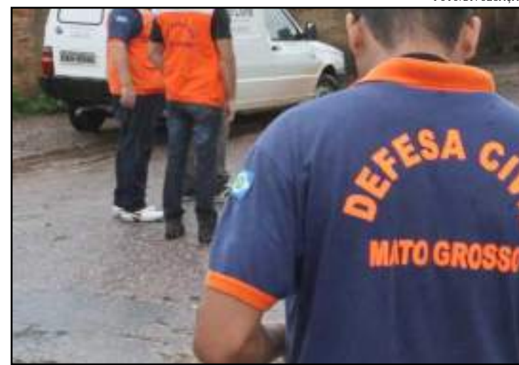
"Susceptibilidade a deslizamentos do Brasil: primeira aproximação"