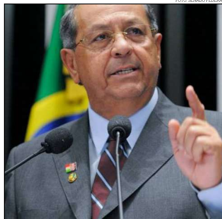
Promessa de pagamento foi feita para dezembro

que agentes infiltrados possam produzir provas - desde que haja uma investigação em curso contra a pessoa.