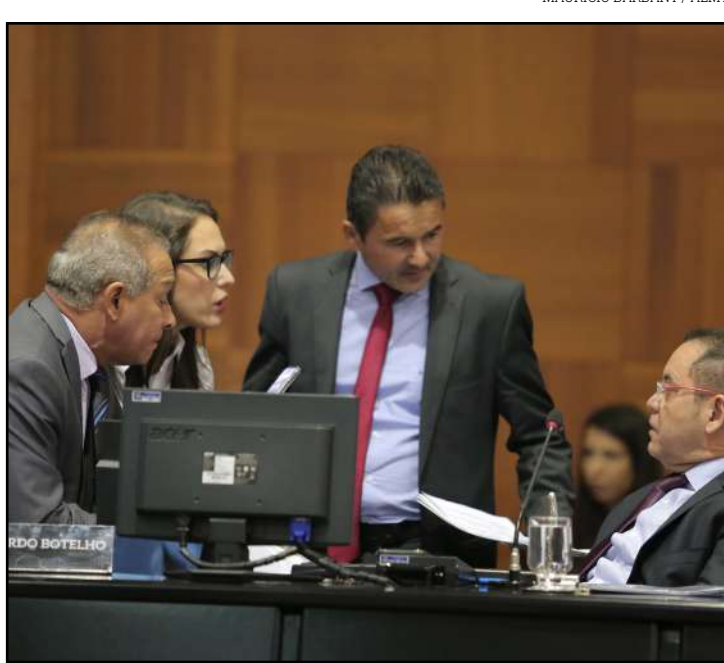
Novas taxas para o Detran causam polêmica