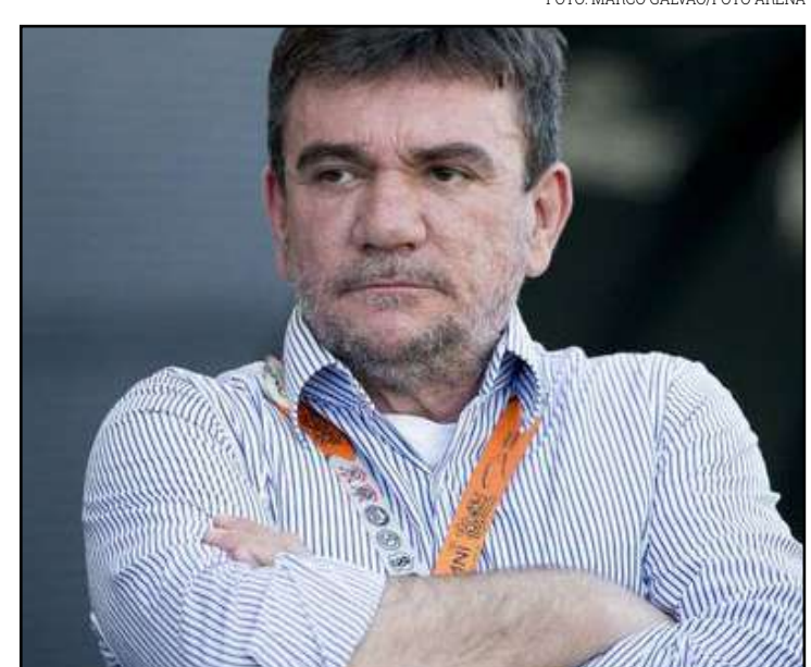
Valor é o mesmo que o clube pagava ao Felipão