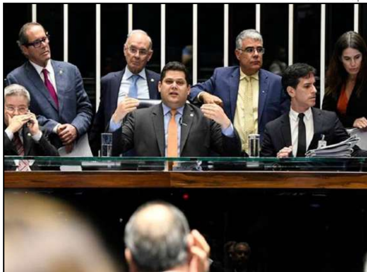
Agora vai para sanção presidencial

O texto representa uma derrota parcial do ministro Moro, que viu pontos importantes que defendia serem derrubados pelos parlamentares, como a ampliação do excludente de ilicitude, a previsão de prisão após condenação em segunda instância e os acordos de plea bargain. O ex-juiz, no entanto, conseguiu retomar algumas partes que considera importante antes da votação no plenário da Câmara, entre eles a possibilidade de gravar conversas entre advogados e presos, com autorização da justiça; a proibição da progressão de pena para pessoas