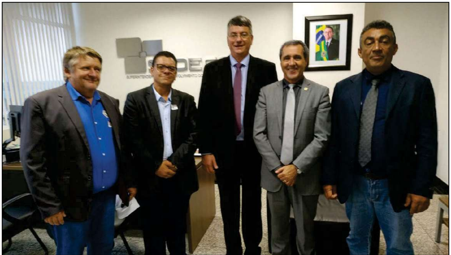
O pedido se justifica pela importância da região

O deputado federal Dr. Leonardo (SDD) e o senador Wellington Fagundes (PL) confirmaram que destinarão recursos durante o exercício de 2020 para custear os dois projetos. Os valores deverão ser empenhados e repassados ainda durante o próximo