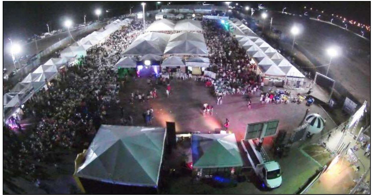
Pelo segundo ano, Festa será realizada no Aquarela das Artes