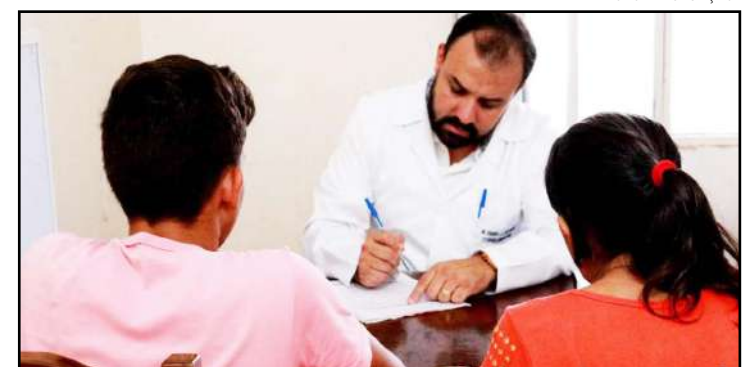
Otorrino foi contratado para zerar fila de pacientes em Guarantã