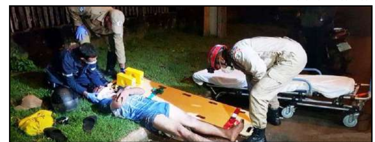
Um dos condutores foi socorrido pelos bombeiros após sofrer escoriações