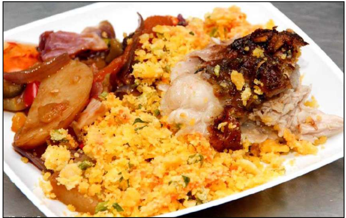
Alimentos à base de milho seguem sendo o principal atrativo da Festa