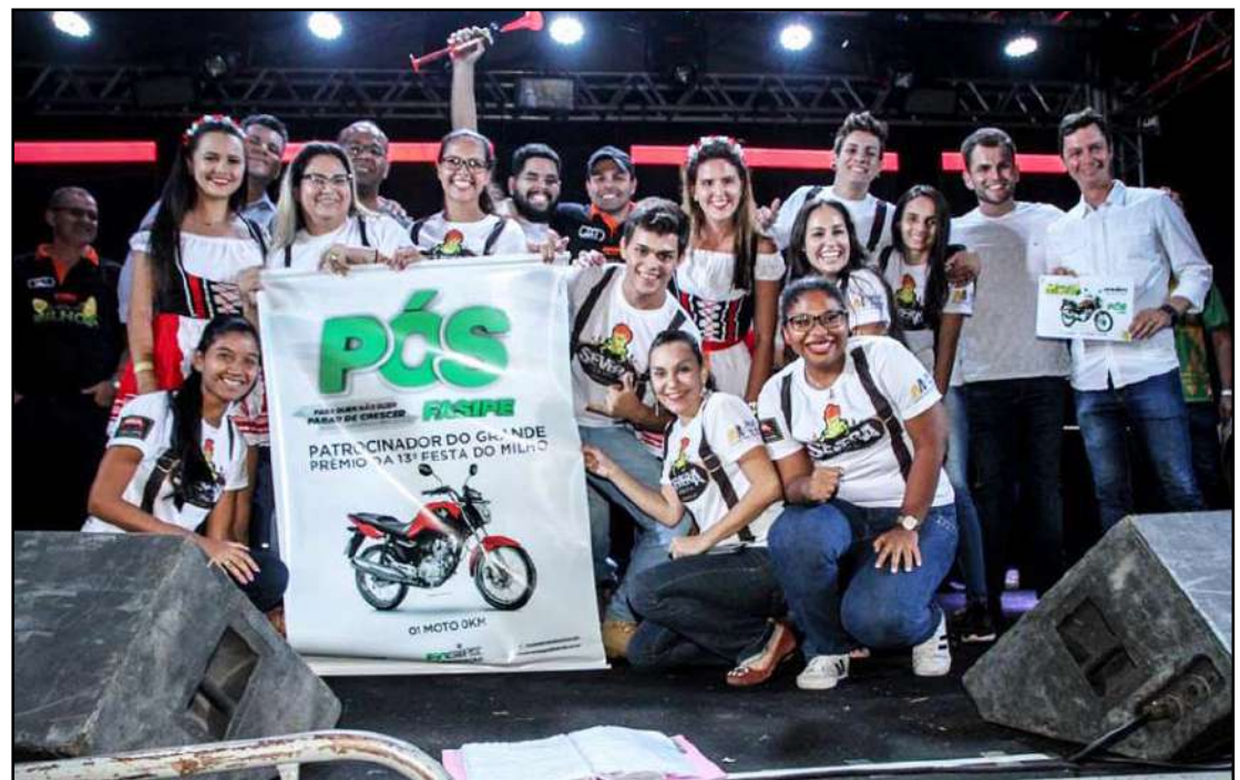
Severaterapia foi a vencedora da Festa do Milho do ano passado

O envolvimento este ano, ao que tudo parece, será intenso, pois com a necessidade de cumprir uma pontuação ainda maior em virtude de uma concorrência considerável, todos estão se mexendo. “Nós participamos a primeira vez em 2017 e ficamos em 5º lugar, e no ano passado ficamos em 3º. Estamos trabalhando desde