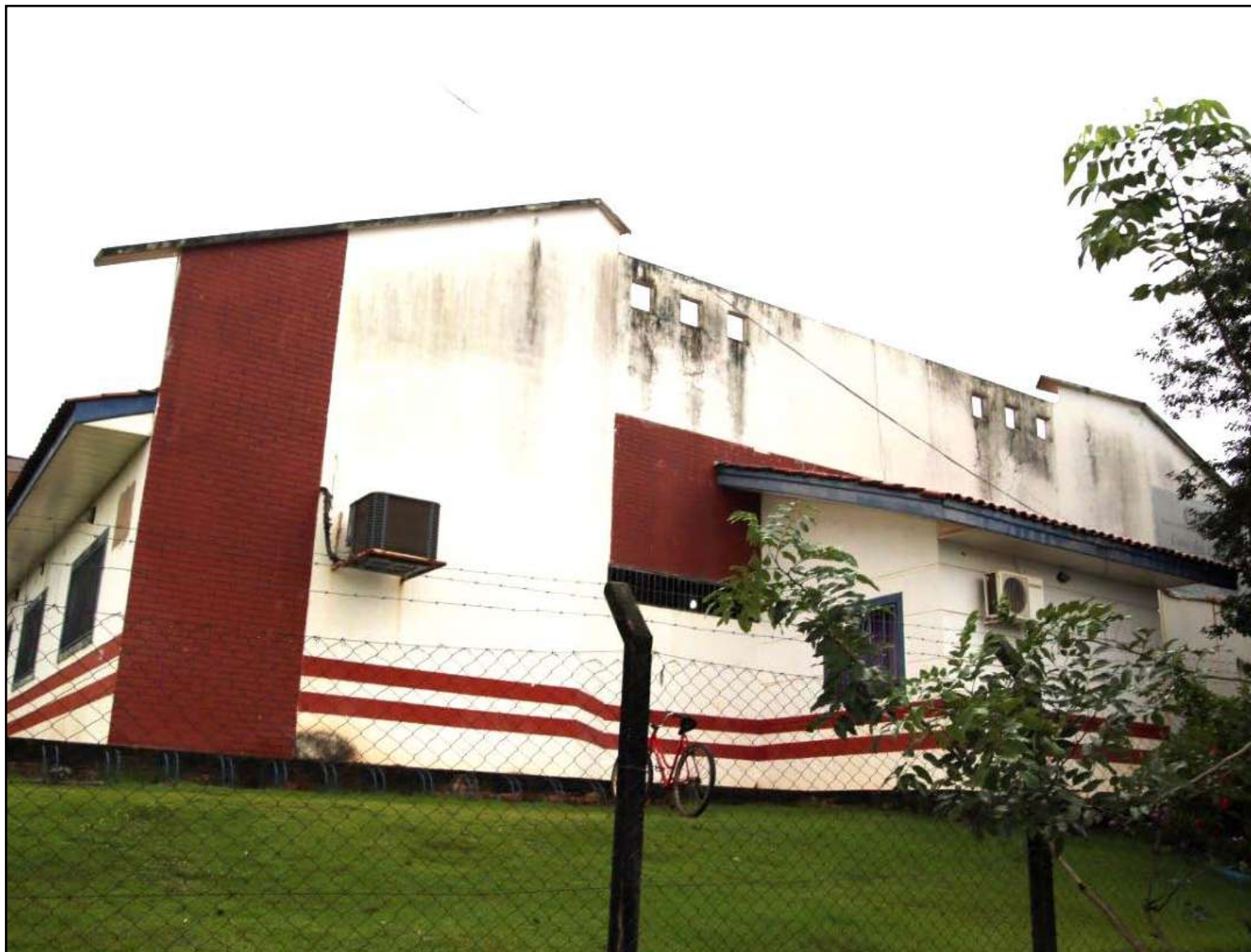
CRAS São José abrange 21 bairros, com 200 pessoas atendidas diretamente

A reforma e ampliação da unidade está sob a responsabilidade da empresa Um Construtora e Incorporadora LTDA-ME, vencedora da licitação, considerando a tomada de preços nº 006/2019. O valor contratado da obra é de R$ 409.747,03, com prazo para a execução e entrega de 180 dias. Será feita a ampliação em uma área de 145 m² e a reforma em um total de 363 m².