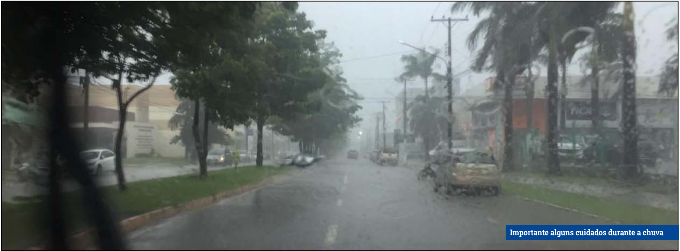
Importante alguns cuidados durante a chuva