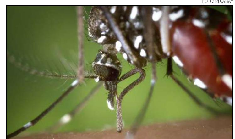
Em 2019, foram notificados 2.458 casos de dengue em Sinop

No dia 28 de dezembro de 2019, outra criança, de 8 anos, morreu em Sinop com suspeita de dengue hemorrágica. Conforme o último boletim epidemiológico divulgado em dezembro do ano passado pela SES, ocorreram três óbitos por dengue grave no estado em 2019. A morte da criança de 8 anos registrada no fim de dezembro não havia sido contabilizada nesse boletim. As mortes registradas pela secretaria ocorreram em Primavera do Leste, São Félix do Araguaia e Confresa.