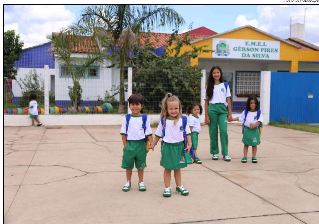
Pais devem ficar atentos aos prazos

cisam redobrar a atenção quanto aos documentos necessários e também às escolas onde desejam matricular