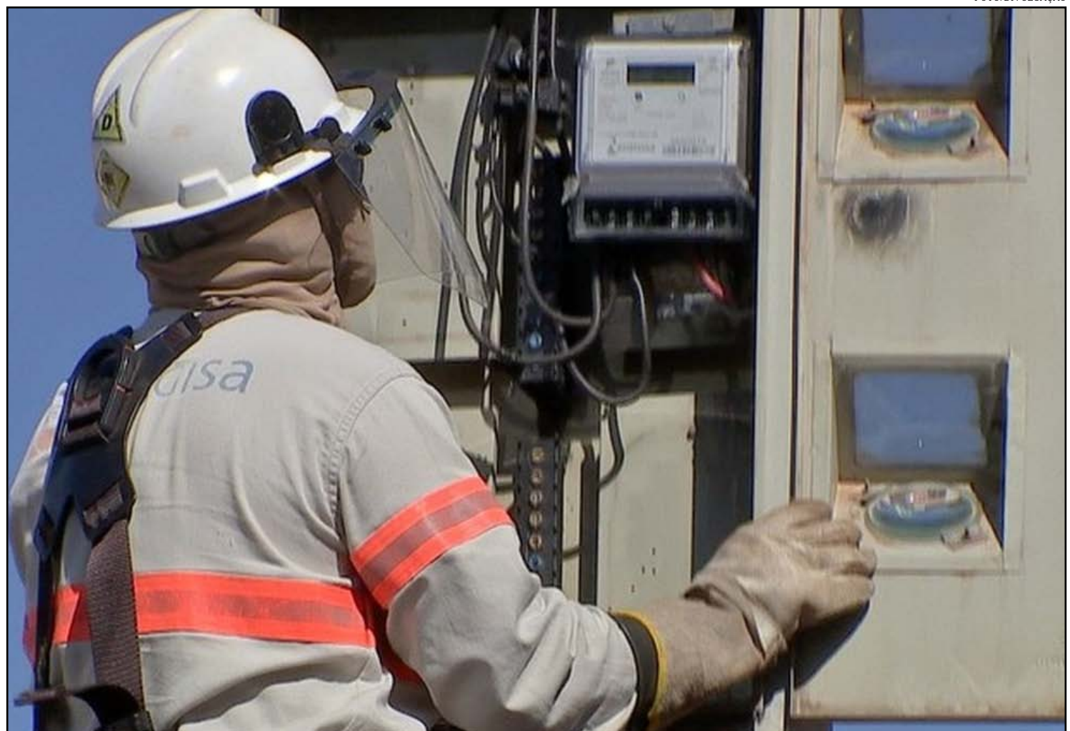
Energisa fez estimativas de consumo em casos em que não deveria, diz Ager

Sobre a multa aplicada pela Agência Estadual de Regulação dos Serviços Públicos Delegados de Mato Grosso (Ager-MT), a Energisa informa que já apresentou recurso administrativo e se reuniu presencialmente com a equipe técnica do