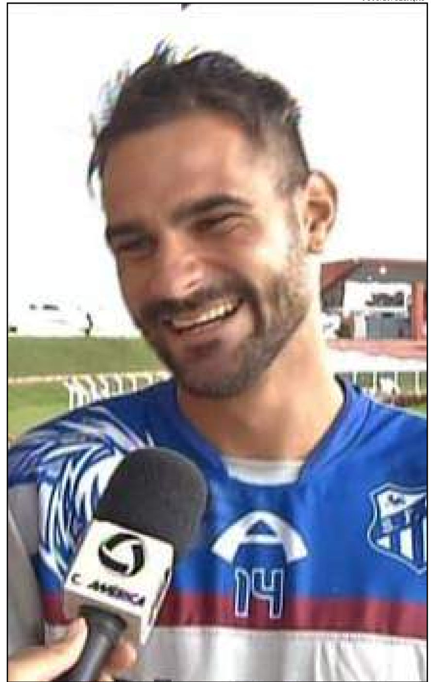
Fogaça já teve outras duas passagens pelo Sinop