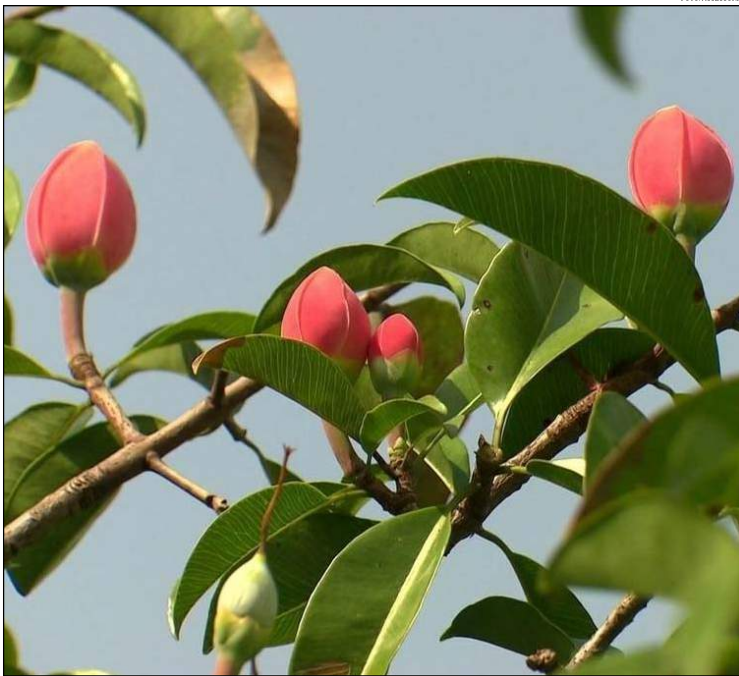
Bacurizeiro é uma das 8 espécies que serão utilizadas em pesquisa

A Ecoarts fez uma parceria com a empresa portuguesa de porcelana de luxo Vista Alegre para a criação de uma coleção com motivos amazônicos. Os royalties da venda dessa coleção, lançada na Europa no início de 2019, são destinados ao projeto Floresta de Alimentos.