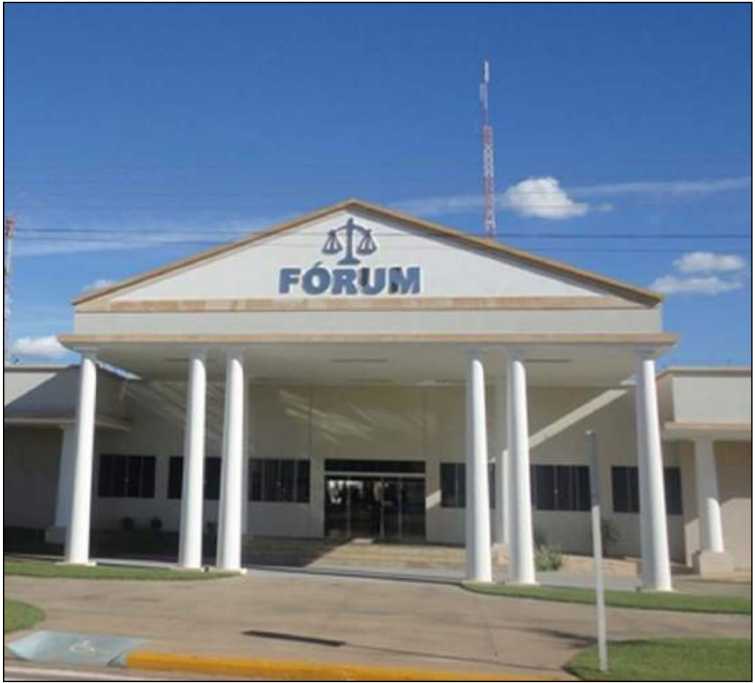
Prédio foi dedetizado nesta sexta-feira

Além das notificações de dengue, em 2019, foram registrados 11 casos de chikungunya e 29 casos de zika. Já em Sorriso, foram seis registros de chikungunya e quatro de zika.