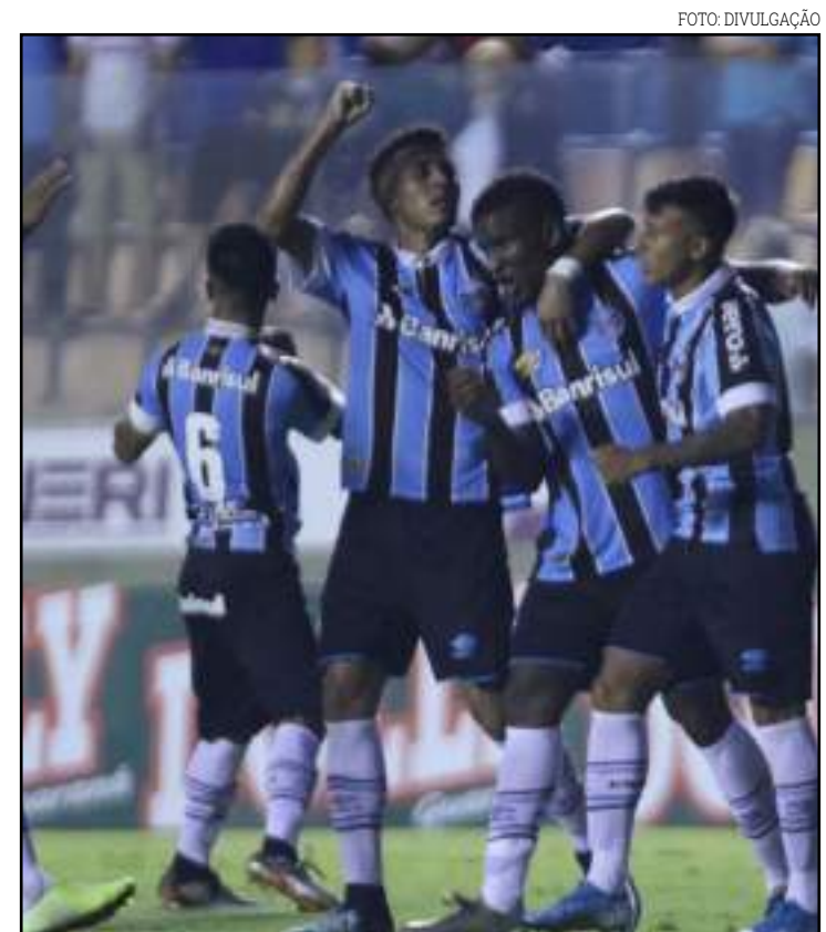
Grêmio vai à segunda decisão em busca do primeiro título

Em 51 edições desde 1969, a competição de 2020 será apenas a quinta sem um paulista na final – lembrando que em 1987 a Copinha não foi disputada. Além dos três clássicos estaduais – 1971, 1996 e a deste ano –, o Internacional venceu o Atlético-MG por 3 a 0 em 1980, e o Flamengo bateu o Bahia por 2 a 1 em 2011. Em todas as outras 46 edições pelo menos um paulista esteve na final da Copinha. E em seis oportunidades os grandes de São Paulo fizeram a final.