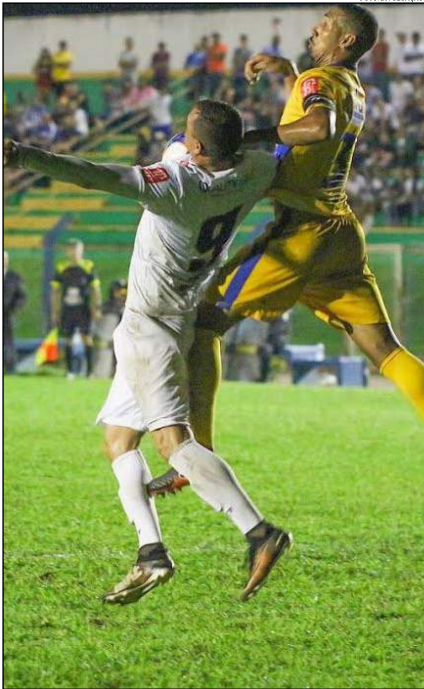
Sinop deve ir a campo com a mesma escalação da estreia

Nas últimas três temporadas, Fogaça jogou pelo Santa Cruz, do Rio Grande do Sul, onde também rodou por Passo Fundo, Cruzeiro e Avenida.