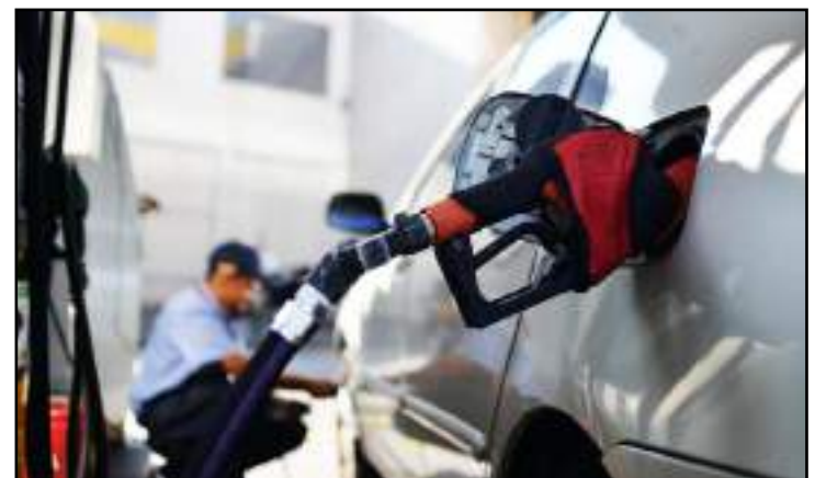
Dados são da Agência Nacional de Petróleo, Gás Natural e Biocombustíveis