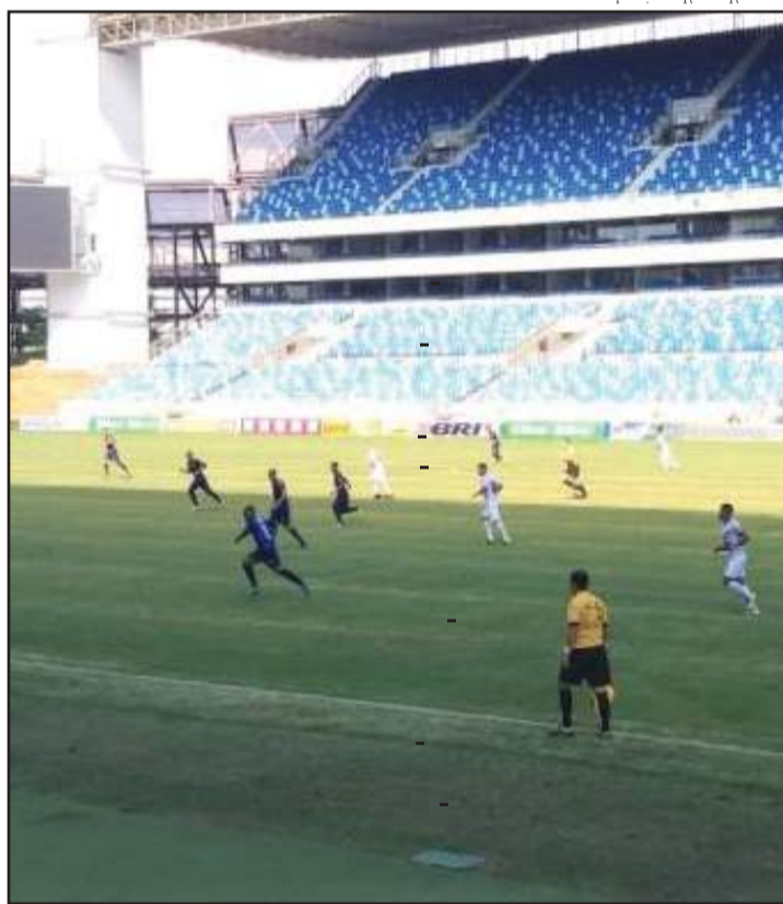
Sinop tinha a vitória na mão, mas tomou uma virada incrível do Dom Bosco