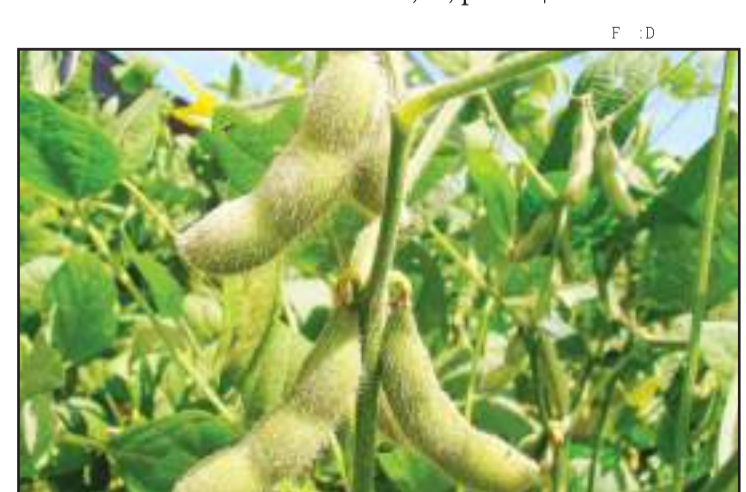
Soja, milho e algodão impulsionam receitas dos mato-grossenses

O desempenho de Mato Grosso faz com que a região Centro-Oeste lidere o VBP nacional, com 32% do total geral dos R$ 631 bilhões do país. A Sul vem a seguir, com 26%. O cenário de 2019 não foi muito favorável para as lavouras. Devido ao recuo da soja, as receitas totais do setor caíram 0,5%, para R$ 411 bilhões. Já a pecuária subiu 2,6%, para R$ 631 bilhões.