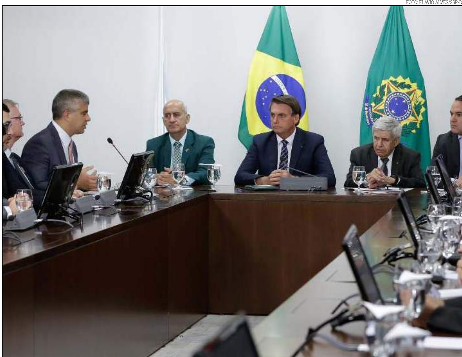
Conseps quer notificação às operadoras

No final da semana passada, em visita à Ásia, o presidente Bolsonaro chegou a declarar que pelo menos, neste momento, não há a menor possibilidade de desmembramento entre Justiça e Segurança Pública, ficando assim, ambos sob o comando do ministro Sérgio Moro.