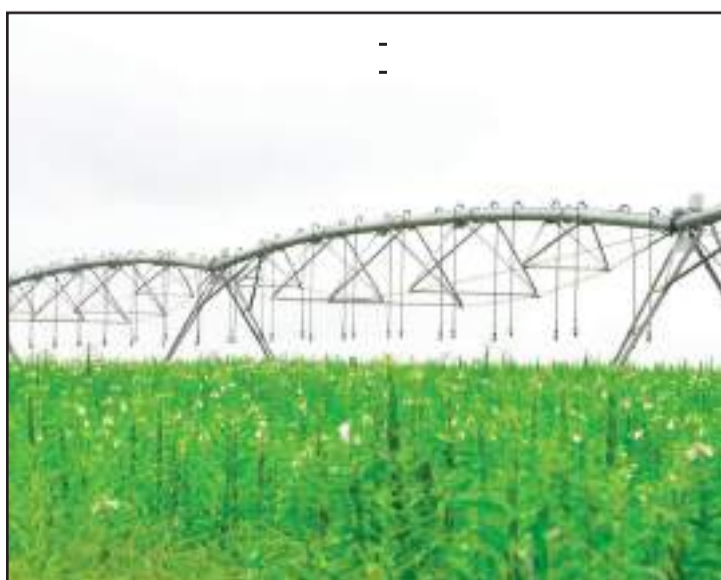
Objetivo é reunir todos os setores envolvidos na cadeia produtiva dos irrigados

Para o evento, são esperados representantes do setor energético, instituições financeiras, secretarias de Estado, Famato, Aprosoja, Ampa, comitês de bacias, entre outras entidades. Outras informações pelo telefone (65) 99684-4774.