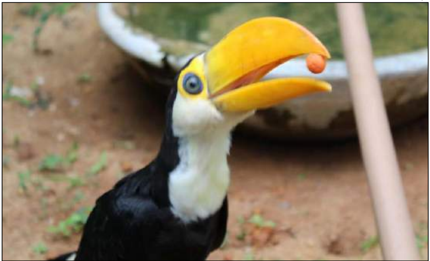
Animais serão soltos quando estiverem aclimatados à região

A guarda de animais silvestres é um instrumento previsto na Resolução CO-NAMA nº 457/2013, concedida por meio do Termo de Guarda de Animal Silvestre-TGAS. Este termo é de caráter provisório pelo qual o interessado, devidamente cadastrado na Sema, assume voluntariamente o dever de guarda de um animal resgatado, apreendido ou entregue espontaneamente, enquanto não houver destinação nos termos da lei.