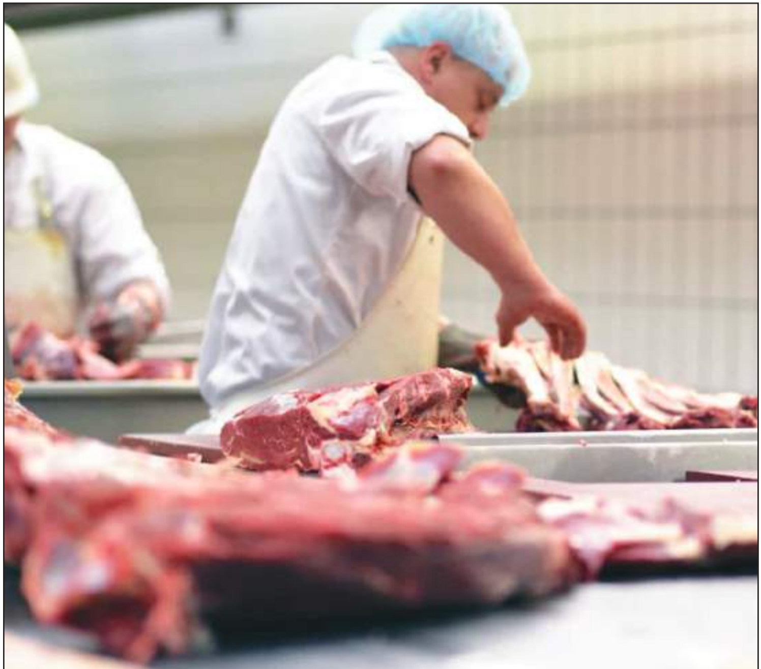
Mercados internacionais também estão revendo as compras