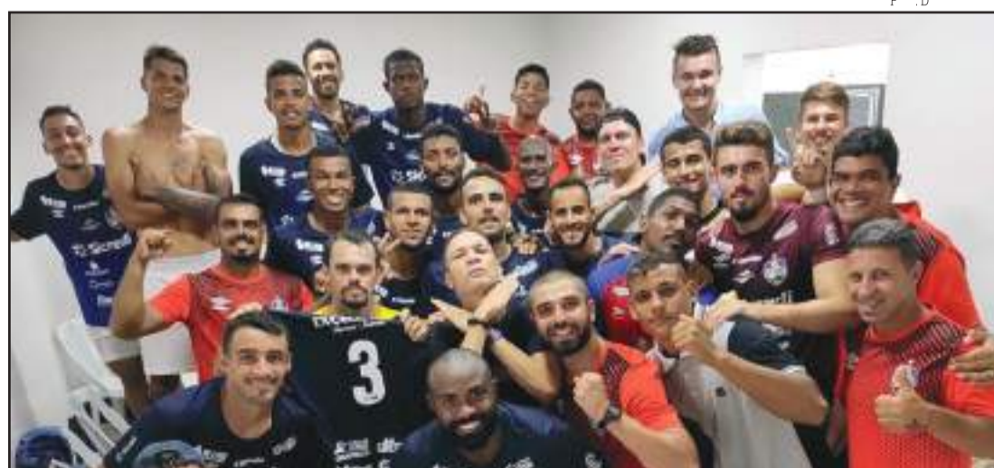
Equipe jogou pela primeira vez no estádio Valdir Doilho Wons