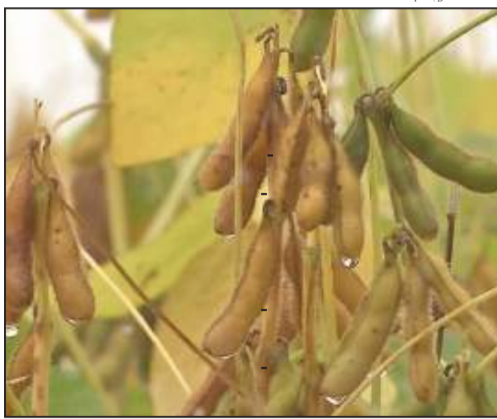
Somente na última quarta-feira, por exemplo, choveu 56 milímetros

Já na safra anterior, nesse mesmo período do ano, a média era de 58 sacas. "Esperamos que essa média se mantenha até o fim da safra e que a chuva não atrapalhe o produtor", ressaltou o presidente.