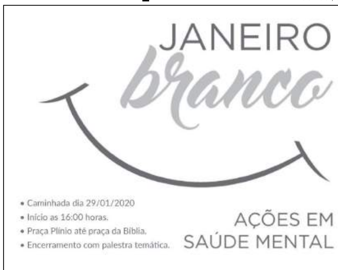
Caminhada é organizada por psicólogos e psiquiatras

O mundo pede, o mundo precisa e todo mundo que compõe a humanidade tem direito à Saúde Mental e a informações sobre Saúde Mental. Somente as corretas informações sobre tudo o que pode produzir Saúde e Saúde Mental nas vidas dos indivíduos é que conseguirão ajudar as pessoas a terem