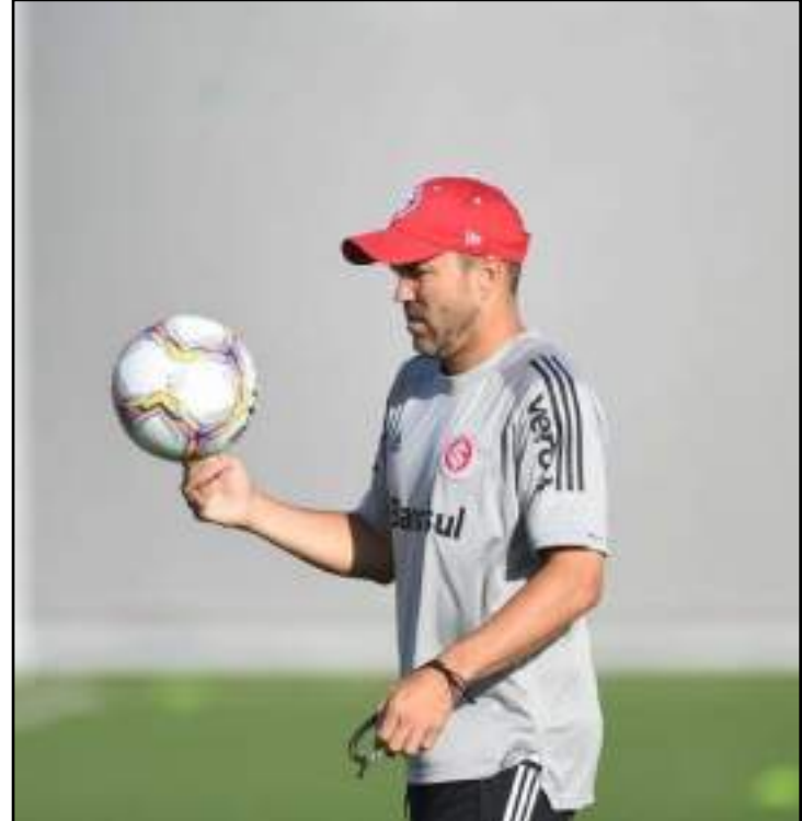
Inter busca melhor arrancada no Gaúcho em seis anos