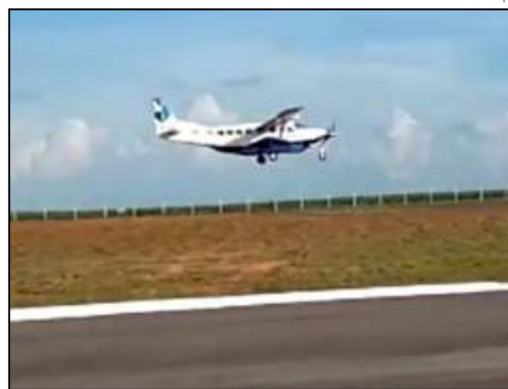
Asta terá voos ligando Mutum a Cuiabá

A Prefeitura liderou a articulação para implantar o primeiro voo comercial. A secretaria de Indústria de Comércio e a direção de operações da empresa aérea fizeram diversas reuniões com empresas e indústrias de Mutum, que firmaram compromisso da compra mensal de passagens, para tornar viável a rota. Além de Nova Mutum, a Asta opera em Cuiabá, Tangará da Serra, Juara, Juína, Primavera do Leste, Água Boa, Canarana, dentre outros municípios.