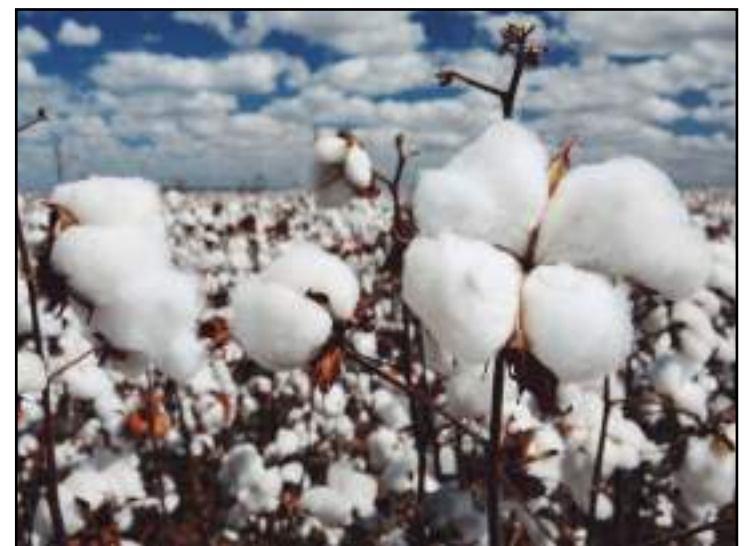
Área semeada com algodão cresceu nas últimas safras