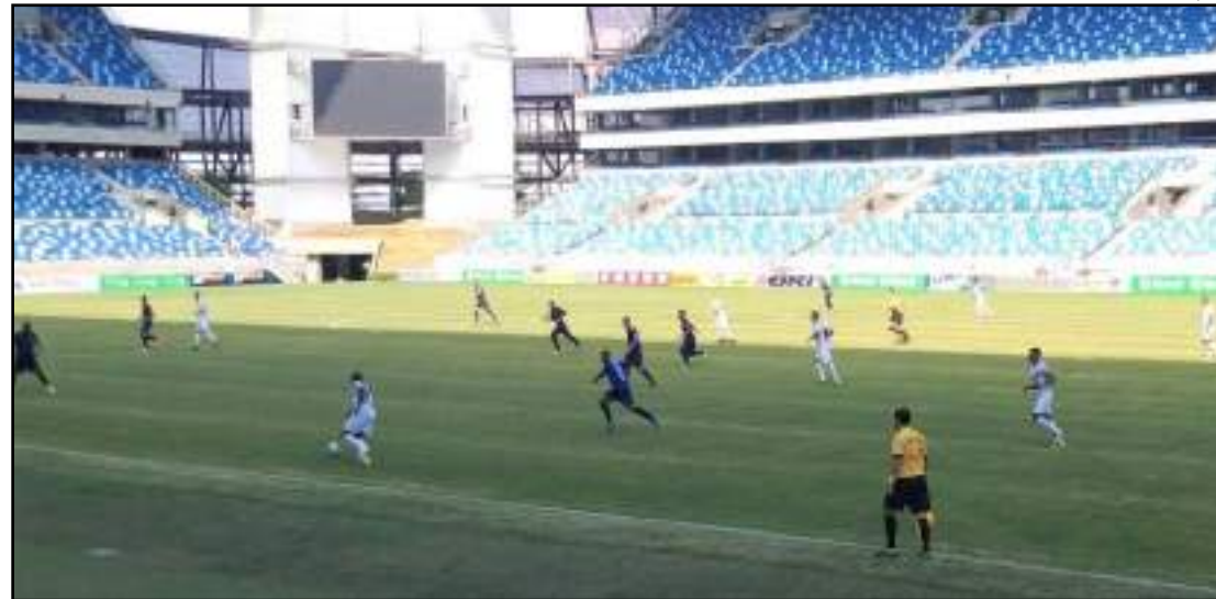
Sinop sofreu derrota de virada para o Dom Bosco

O adversário desta quarta-feira (29) será o Poconé, equipe que ainda não pontuou na competição e estaria rebaixada se o campeonato terminasse hoje. A partida será no Estádio Gigante do Norte, a partir das 20h10. Um fator complicante para