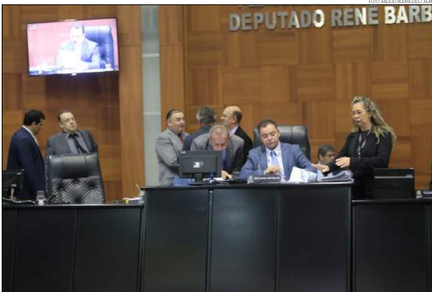
ALMT terá volta intensa aos trabalhos

Depois disso, a Assembleia encomendou um estudo técnico para analisar a viabilidade ou não do projeto. “Nós teremos muita discussão em torno desse assunto. A Assembleia já está em fase final de contratação de uma empresa para fazer o estudo e começarmos as discussões. Mas é um projeto realmente polêmico”, admitiu o presidente.