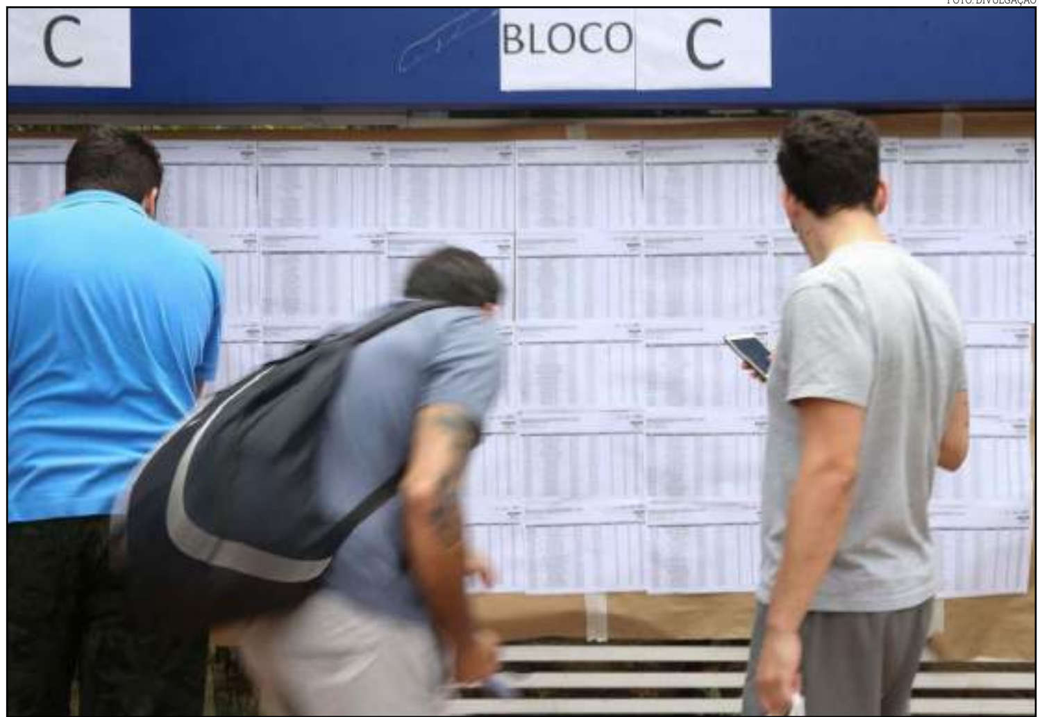
Muitos alunos foram prejudicados e Ministério suspendeu inscrições para o Prouni

"Houve inconsistência no gabarito de algumas provas do Enem 2019 e, por isso, candidatos foram surpreendidos com os resultados de suas notas. O número é muito baixo. Pedimos des-