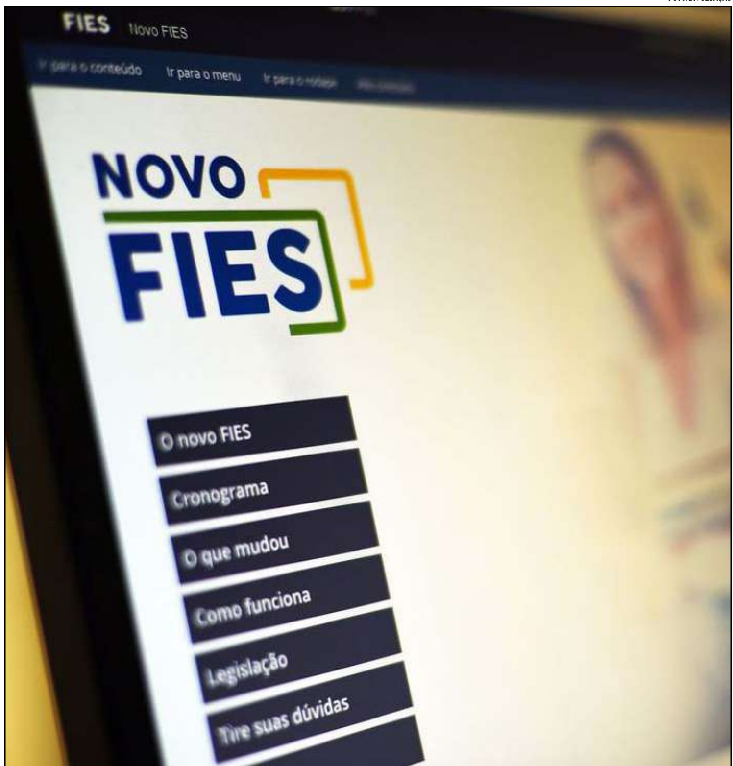
Ter feito Enem é um dos quesitos para conseguir bolsa do Fies

Tanto no Fies Juro Zero quanto no P-Fies, o estudante só começa a pagar a dívida contraída depois que se formar, na forma do contrato. A parcela devida é descontada na fonte. Caso ainda não tenha emprego e renda formal, o financiamento será quitado em prestações mensais equivalentes ao pagamento mínimo, de acordo com o regulamento do CG-Fies. Durante o curso, o estudante deve pagar apenas a parcela da mensalidade não incluída no financiamento e encargos operacionais ligados ao contrato, bem como um seguro de vida. Após a complementação da inscrição, o pré-selecionado no Fies e P-Fies tem prazo de cinco dias para comparecer à Comissão Permanente de Supervisão e Acompanhamento (CPSA) da instituição de ensino, para análise de documentação.