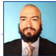
POR LEANDRO CARECA

Você deve verificar regularmente se o procedimento de backup está sendo feito de forma correta e se os dados estão sendo armazenados sem maiores problemas. Não são raros os casos em que o processo falha e a pessoa só vai perceber tempos depois, quando precisa da informação salva e ela não está ali.