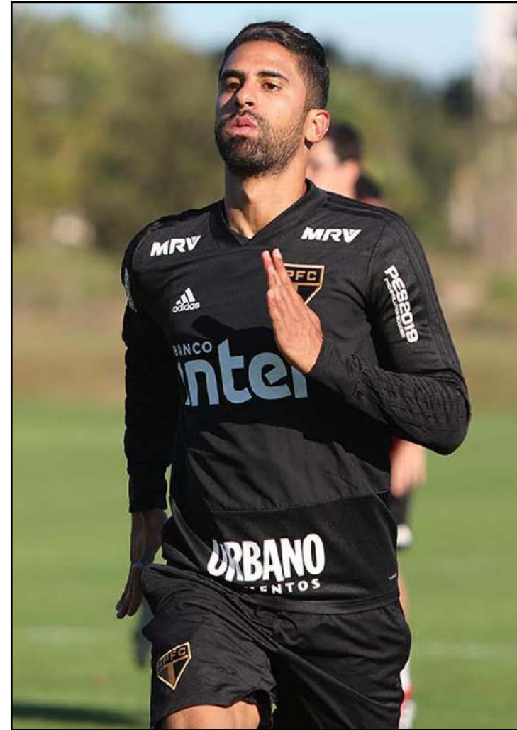
Possibilidades de negócio não agradam, e jogador voltará ao grupo