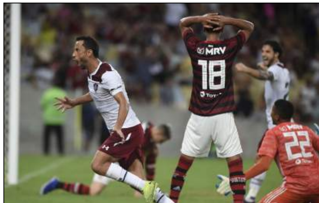
Flu venceu o primeiro Fla-Flu de 2020; hoje, o clássico volta a acontecer

Os 15 pontos conquistados dos 18 disputados na primeira fase da Taça Guanabara renderam ao Fluminense não só a liderança do Grupo A, como também a vantagem do empate nas semifinais, ou seja, em caso de igualdade no placar, o Tricolor avança