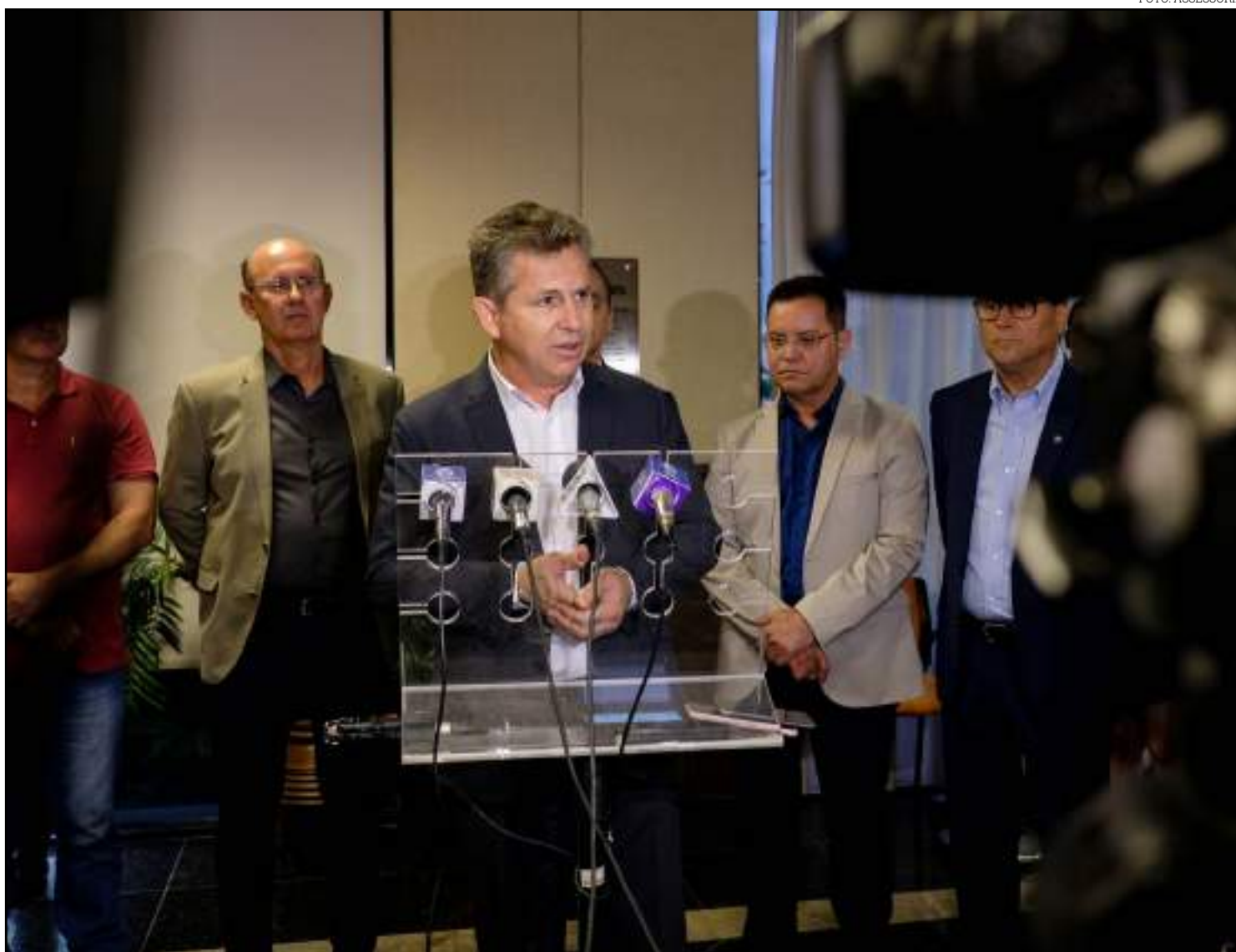
Governador cobrou dívida com MT

“Em nossa conversa com o ministro Paulo Guedes, ficou claro que na Reforma Tributária teremos espaço para o diálogo e, portanto, será o momento de construir a melhor solução para o Brasil, sem radicalizações”, completou o governador.