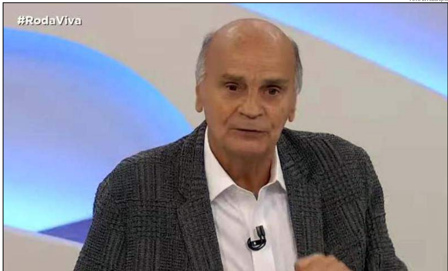
Drauzio crê na chegada do vírus e ataca grupo antivacinas

“As pessoas acreditam e você não pode nem dizer que estão sendo bobas. Vejo com a maior preocupação. Essas coisas que fazem com as vacinas. Esses grupos ti-