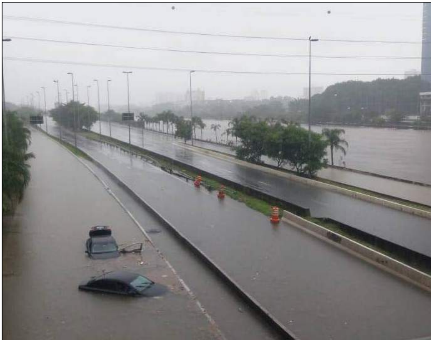
Marginal Tietê, em SP: carros foram atingidos pela chuva

Independente de tentar manter o carro "na margem de segurança", ainda há muitos riscos ao atravessar passar com o carro por uma