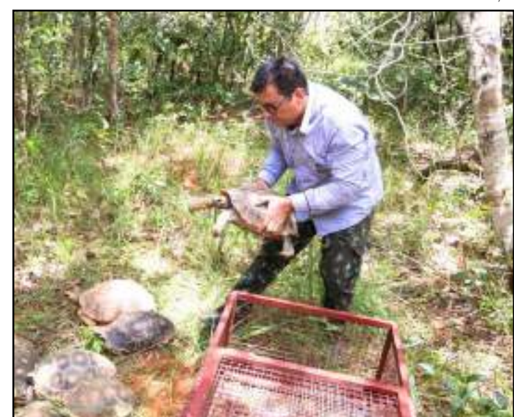
Pelo menos nove animais foram devolvidos à natureza em Sorriso