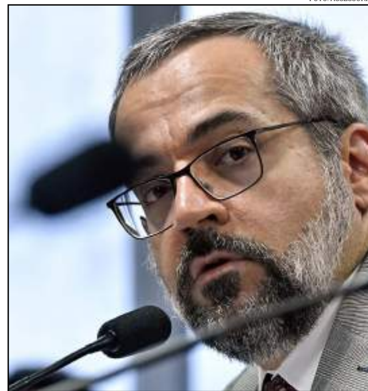
Investimento é de aproximadamente R$ 8,5 mi