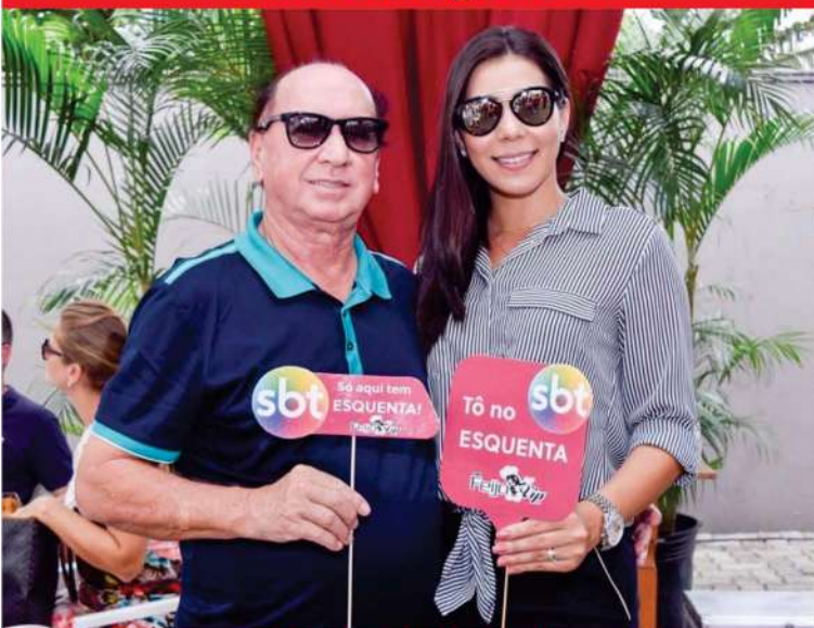
SBT TV Cidade