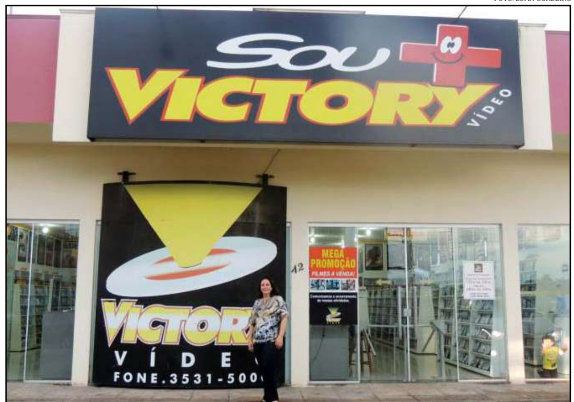
Victory Vídeo anunciou encerramento das atividades em Sinop

O cozinheiro ainda relatou quais os maiores diferenciais do formato que o fazem recordar de tantas memórias. “Primeiro de tudo é a nostal-