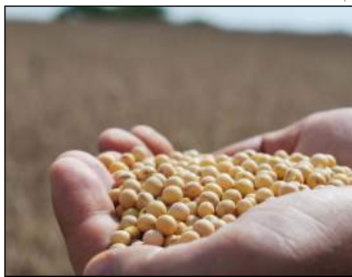
Soja disponível finalizou a última semana cotada a uma média de R$ 72,89/saca

A soja disponível em Mato Grosso finalizou a última semana cotada a uma média de R$ 72,89/saca, alta de 1,81%. Além de o dólar ter registrado sua máxima, os bons níveis nos prêmios portuários também influenciaram.