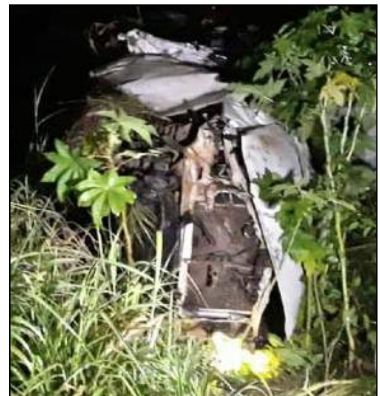
Colisão foi registrada próximo ao trecho urbano de Lucas