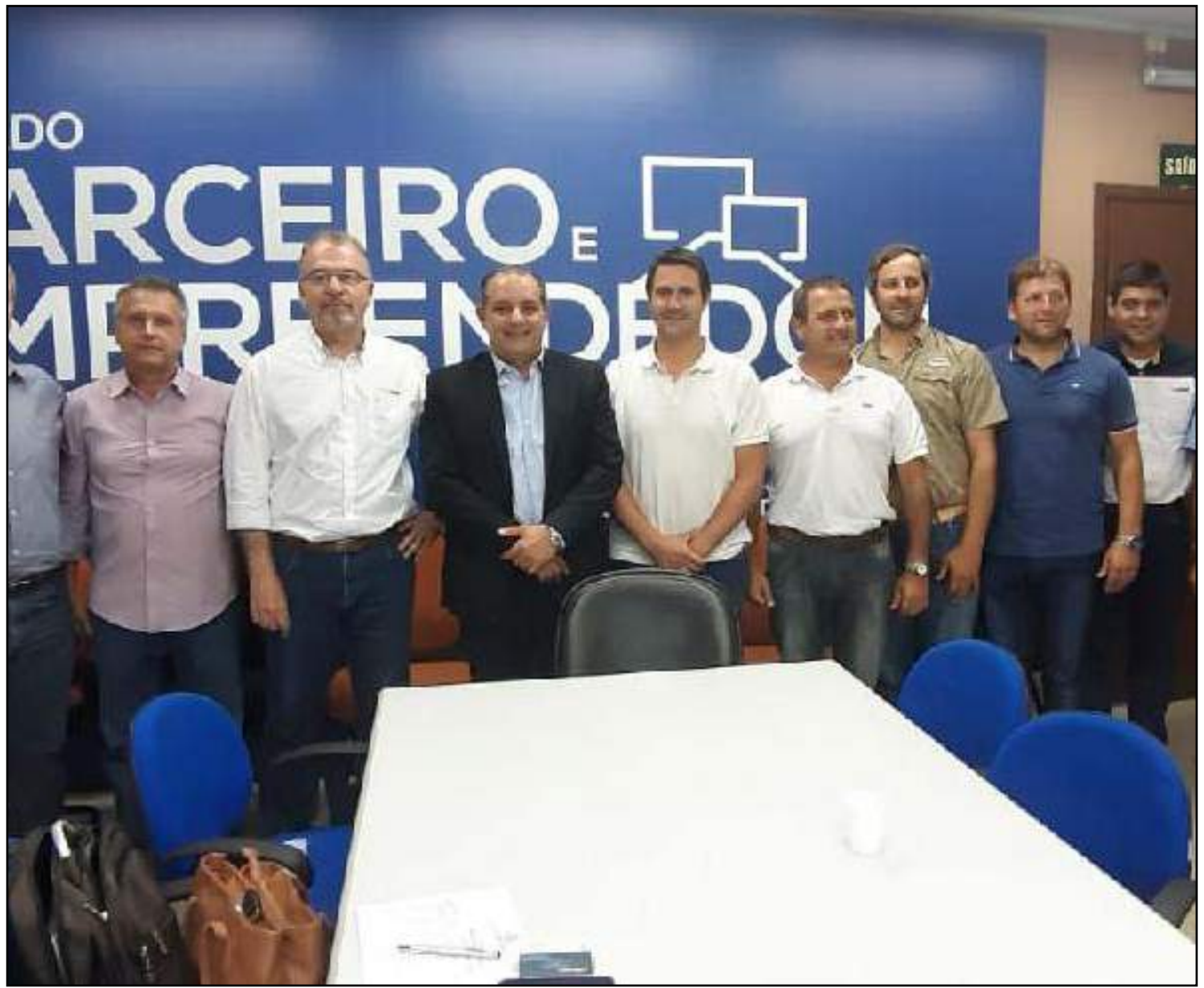
Empresários argentinos buscam Mato Grosso como opção para indústria de amendoim