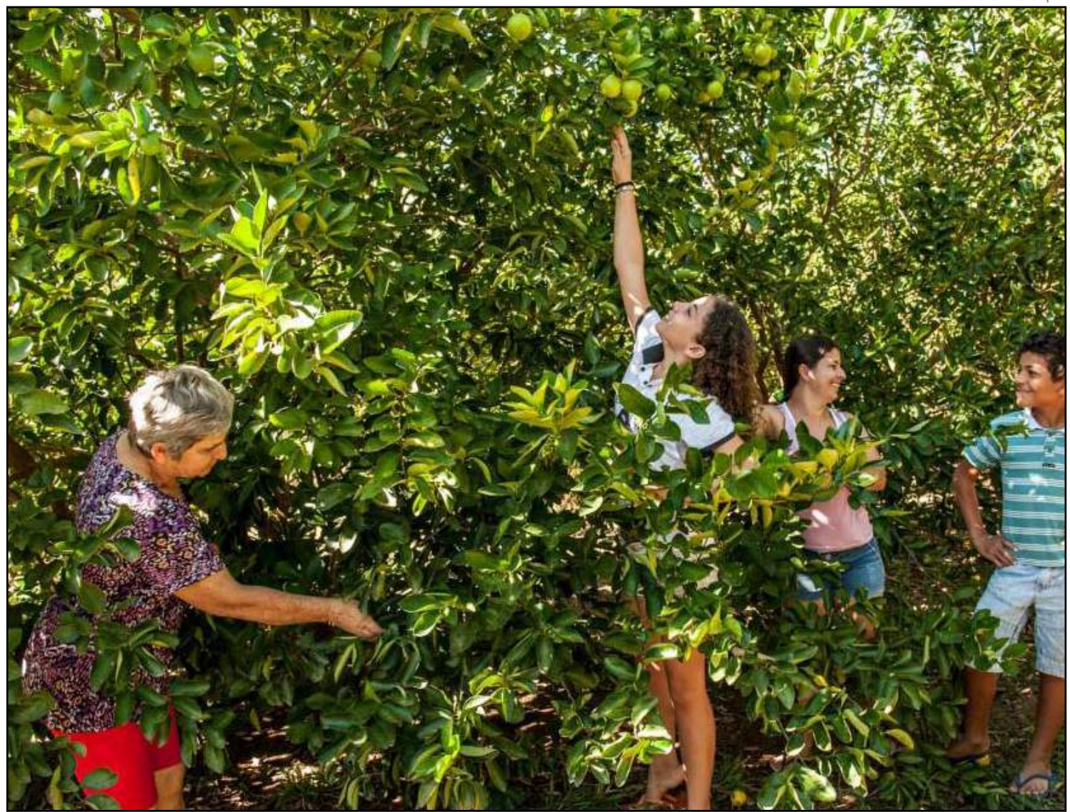
Verba é para projetos de Agricultura Familiar e Comunidades Tradicionais

O Programa REM remunera e premia o esforço de mitigação das mudanças climáticas de pioneiros do REDD+(Early Movers) a nível estadual, subnacional ou nacional pretendendo fomentar o desenvolvimento sustentável, e gerar aprendizados até que um mecanismo global de REDD seja operativo. O principal objetivo do programa é a valorização da floresta em pé. O REM segue todos os