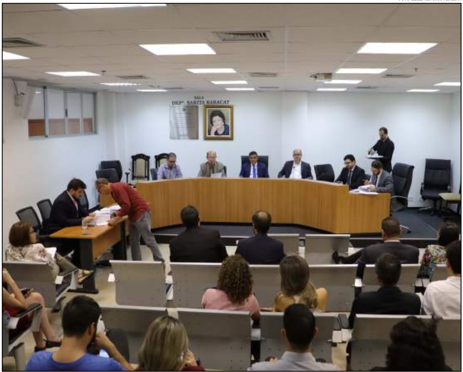
Informações pesam contra a Energisa