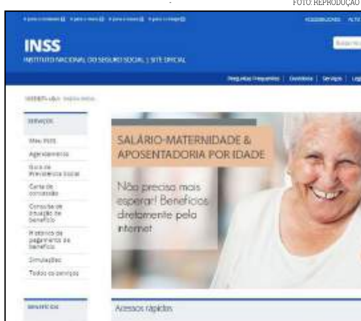
Demonstrativo está disponível no Portal Meu INSS

Para mais conforto aos cidadãos, o INSS recomenda que a obtenção do extrato seja feita pela internet. Também é possível fazer o agendamento pelo telefone 135.