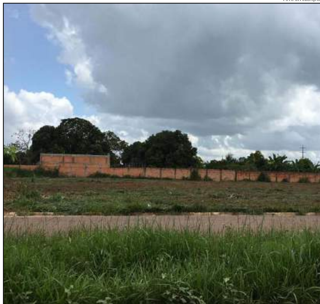
Terrenos são limpos para evitar proliferação do mosquito da dengue

A nova unidade da subseção em Sinop começou a