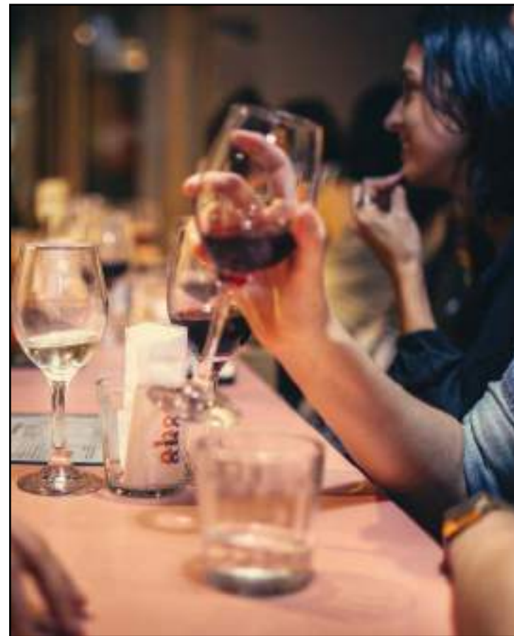
Imposto cai e obriga a destinação de 1% ao Funtur