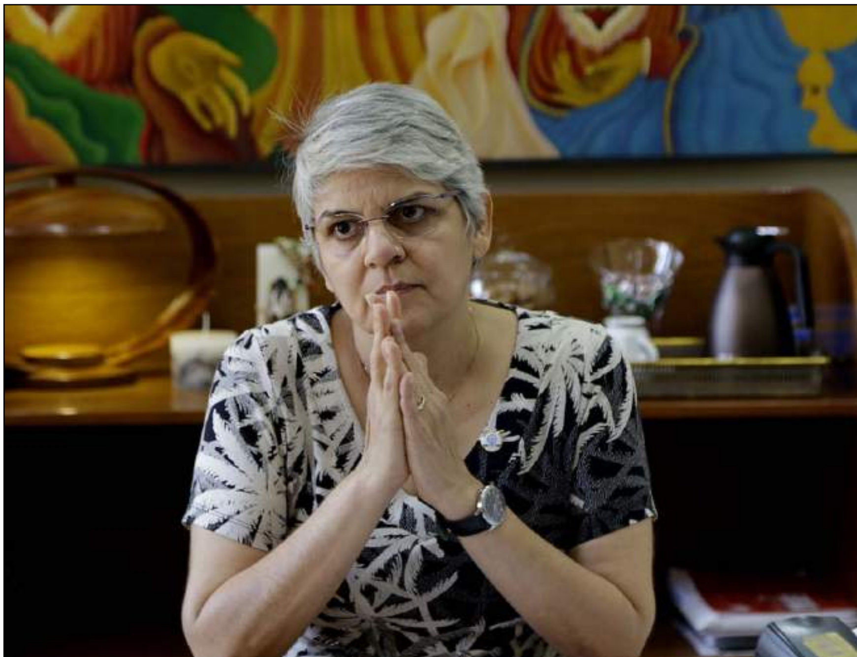
Gestão foi marcada por polêmicas