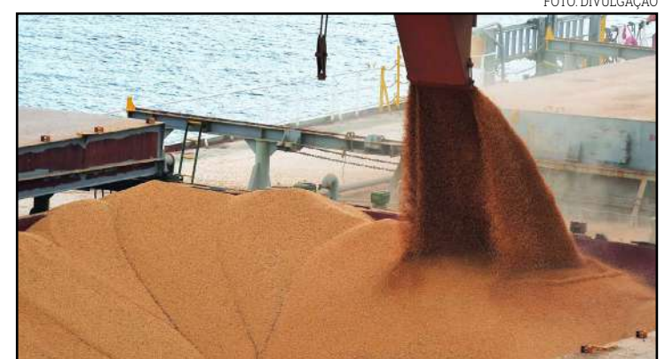
Importadores chineses pedem para atrasar carregamentos de soja brasileira

Os mapas climáticos atualizados trazem a permanência de um padrão chuvoso sobre Minas Gerais, norte de São Paulo, todo o lado sul de Goiás, todo o estado do Mato Grosso e Rondônia sul do Tocantins e todo o Paraná. Os índices pluviométricos previstos para os próximos 5 dias nestas regiões estão num raio de 40-70mm acumulados, aponta a ARC Mercosul.