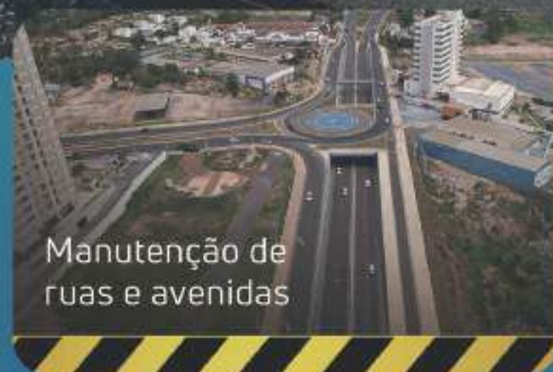
Manutenção de ruas e avenidas

Vias asfaltadas, restauradas e duplicadas. Rodovias novas construídas. O Governo de Mato Grosso está trabalhando em mais de 1.500 km de estradas em todas as regiões do estado. Melhorando a infraestrutura, estamos recuperando a confiança da nossa economia e garantindo a segurança de quem roda por aqui.