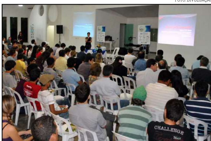
Encontro se torna referência no Centro-Oeste

o sistema a cada ano. “Aqui em Mato Grosso temos mais de 2 milhões de hectares com integração, onde predominantemente são lavouras de soja que depois entra pasto. É um dos grandes desafios é aumentar a produ-