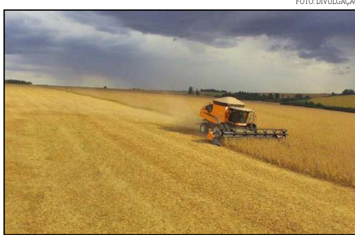
Agricultor vendeu saca de 60 kg de soja por cerca de R$ 76