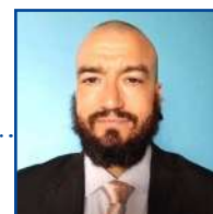
POR LEANDRO CARECA

A leitura das mensagens e instruções exibidas pelos dispositivos eletrônicos é fundamental para a solução de problemas, sejam eles simples ou complexos, que exijam intervenção do usuário ou do técnico. Por vezes a mensagem não é clara o suficiente, mas serve como referência e, para alguém que entenda do assunto, é de extrema importância e valia. Não ignore as mensagens.