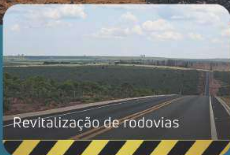
Revitalização de rodovias