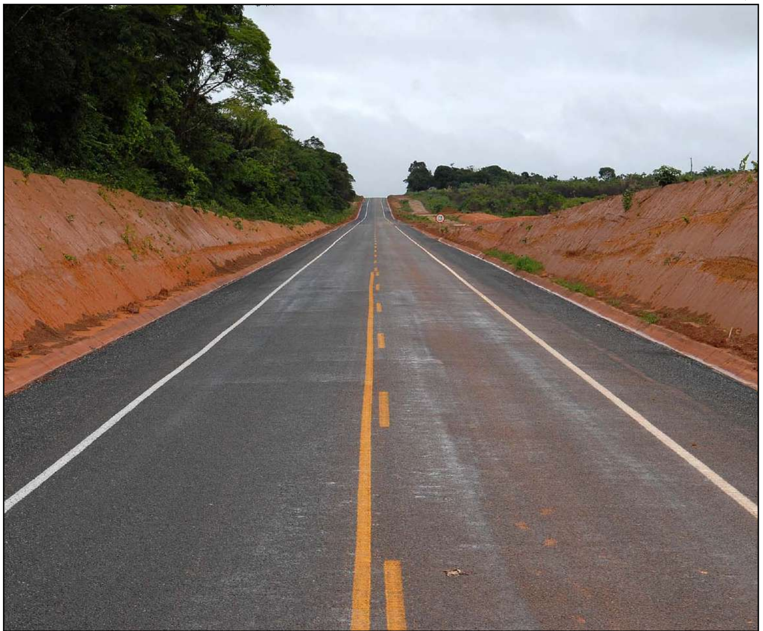
Arco Norte é caminho para as exportações pelos portos privados