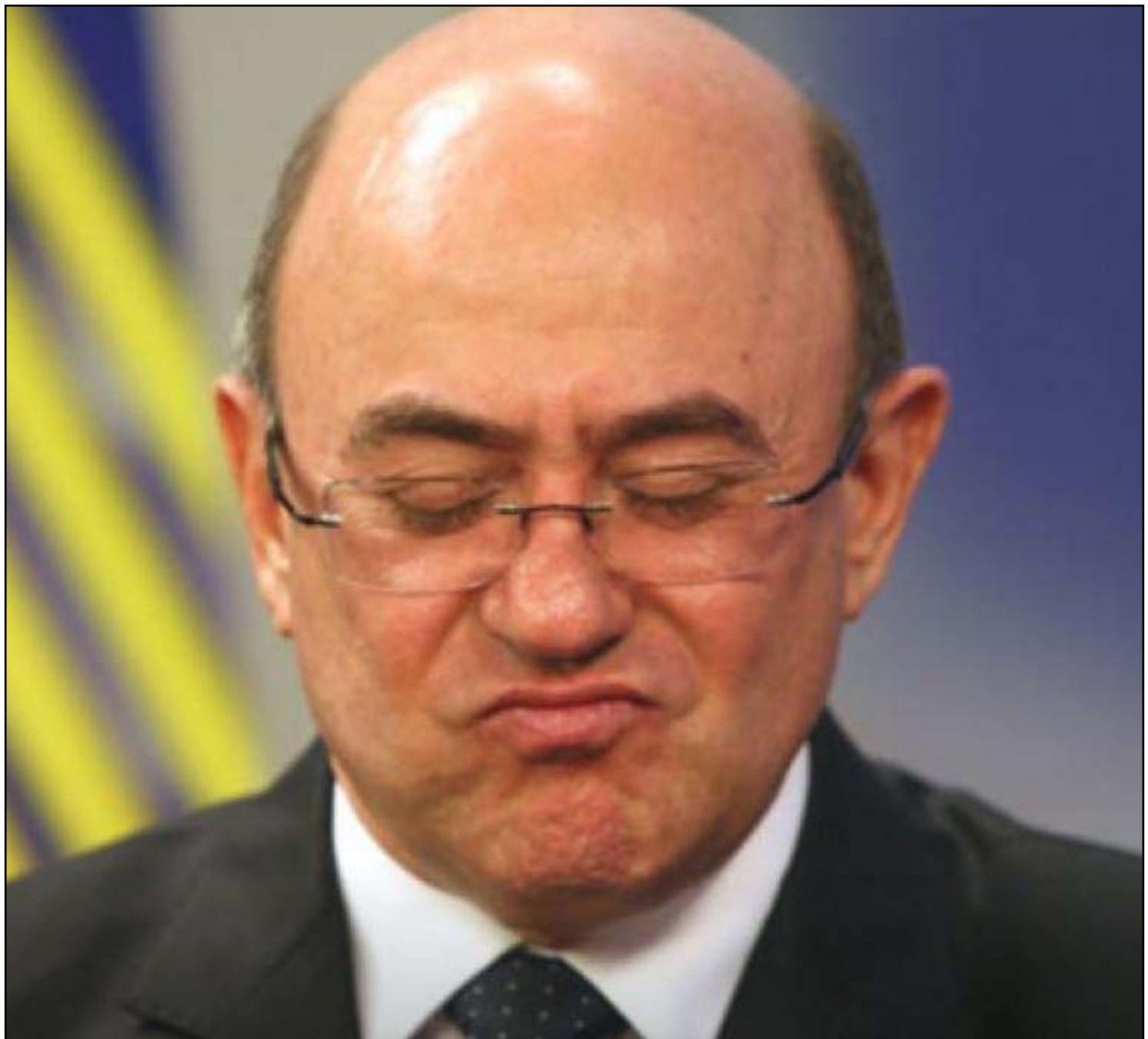
Riva é somente delator e cumpre prisão domiciliar

A audiência teve por finalidade avaliar a regularidade, legalidade e, principalmente, a voluntariedade do acordo de colaboração premiada. O colaborador também foi advertido sobre a possibilidade de retratação da proposta, caso queira, bem como inclusões de fatos eventualmente ocultados ou não revelados integralmente.