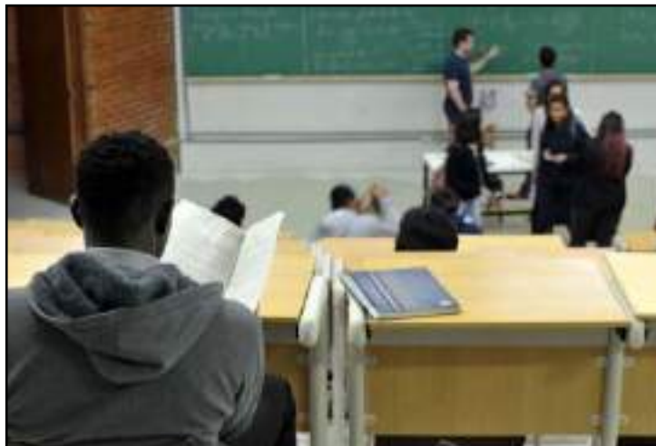
Documentação deve ser apresentada às instituições de ensino

Para concorrer às bolsas integrais, o estudante deve comprovar renda familiar bruta mensal, por pessoa, de até um salário mínimo e meio. Para as