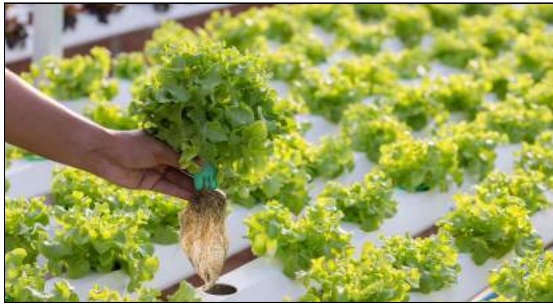
Técnica consiste em cultivo sem utilizar a terra

Dentre o conteúdo programático está a montagem de estrutura hidropônica;