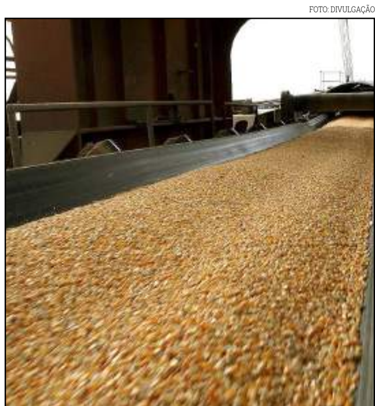
Pequenas granjas e fábricas de ração voltaram às compras

Além do mais o oeste da Bahia e o centro-sul do Piauí também serão regados no mesmo período por totais mais sucintos variando entre 25-40mm acumulados”.