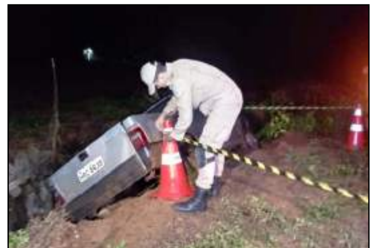
Área em torno do veículo foi isolada