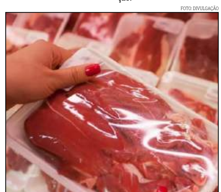
Estado tem o maior rebanho do país