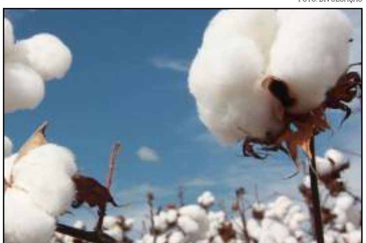
Imea divulgou relatório do custo de produção de algodão para a safra 20/21

Diante desse cenário, para cobrir seus custos é necessário que o cotonicultor venda sua pluma a um preço médio de R$ 77,50/@, o que pode ser uma notícia boa para a cadeia, visto que os preços da fibra avançaram 1,07% na comercialização do mês de janeiro.