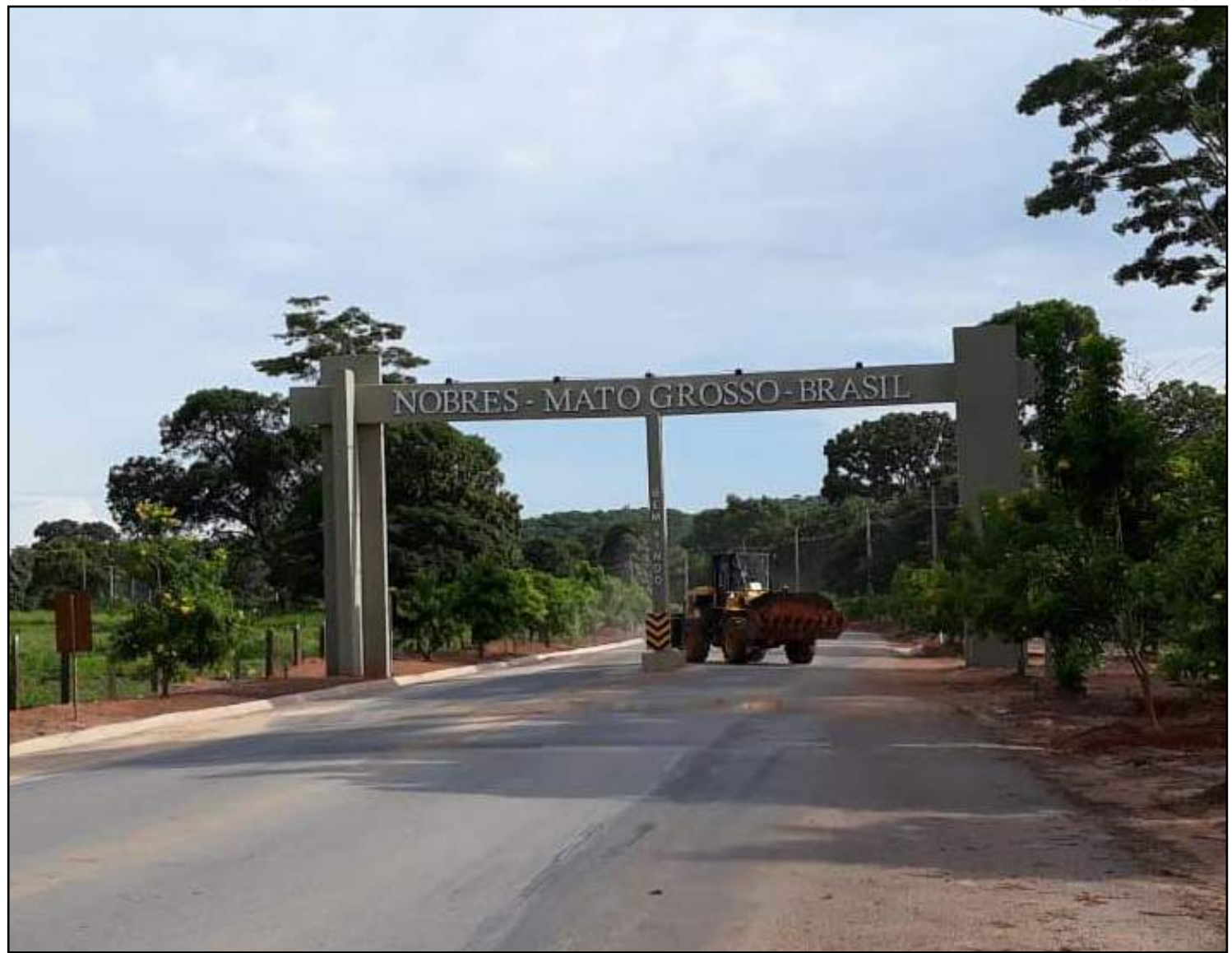
Recuperandos também trabalham na reforma de bases policiais e outros serviços

Os apenados que trabalham extramuros passam por uma seleção rigorosa seguindo a legislação de execução penal, que define as regras para permitir o trabalho externo, e são