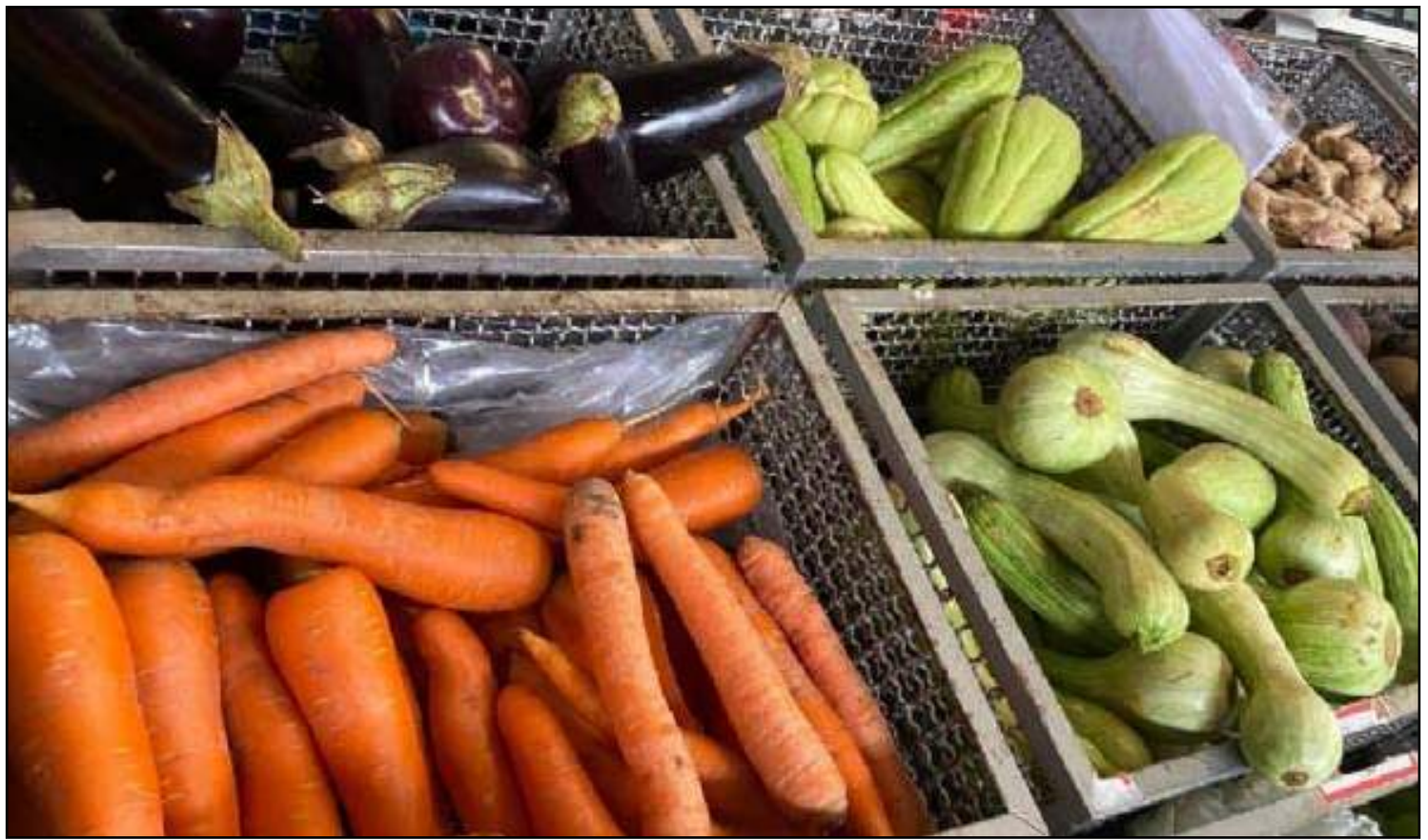
Valor ficou até 50% maior na Grande Cuiabá

Com a normalização do funcionamento da Ceagesp, que ficou dois dias fechada para o serviço de limpeza, a estimativa é pela normalização do preço dos hortifru-