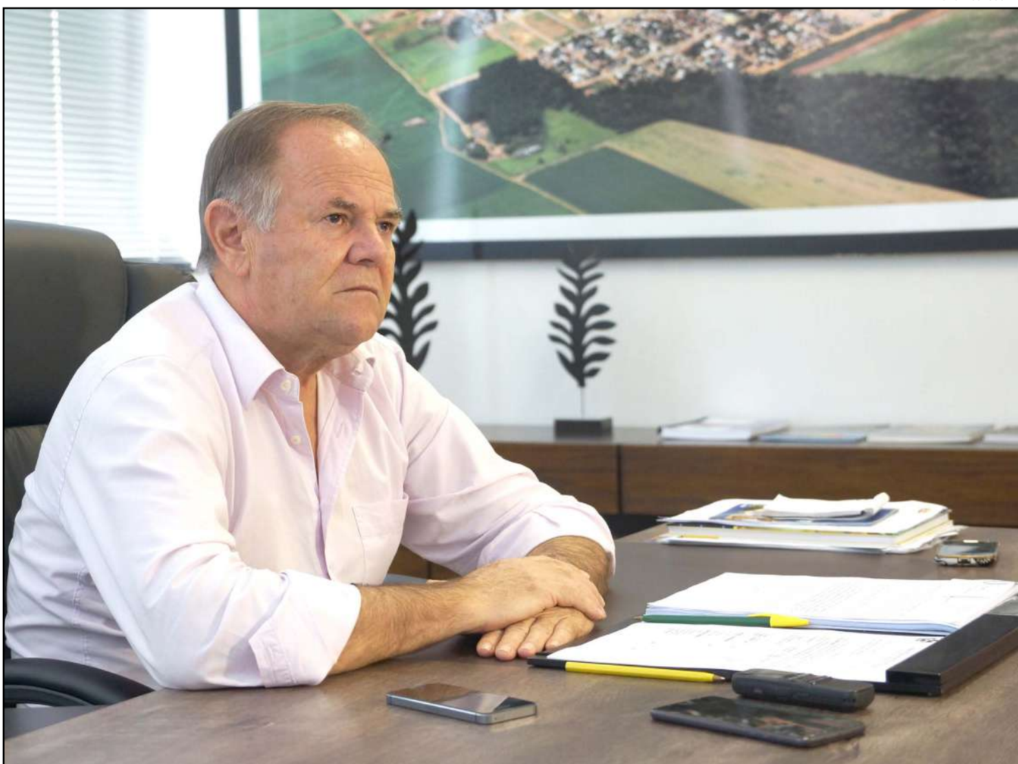
Prefeito Iraldo vai construir novo hospital em Tapurah

Por contar com apenas um centro cirúrgico, as atuais condições fazem com que diariamente as quatro ambulâncias do município tenham que deslocar pacientes para as cidades vizinhas como Sorriso e Sinop. Com a nova unidade hospitalar haverá a redução dessas viagens.