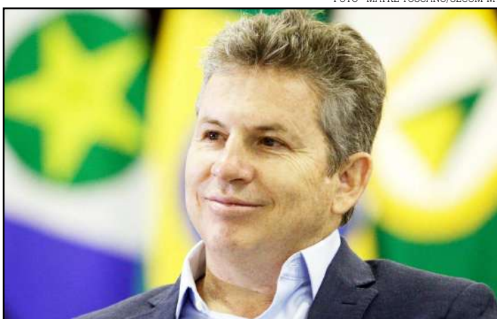
Governador Mauro Mendes anunciará amanhã investimento em obras inacabadas

"O Fethab foi criado em 1995 com uma reserva de dinheiro tirada dos produtores. Infelizmente, nesse governo,