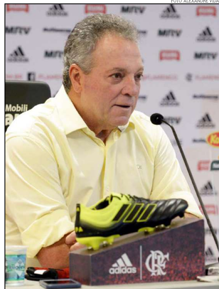
Fla terá sequência pesada no estadual e na Libertadores