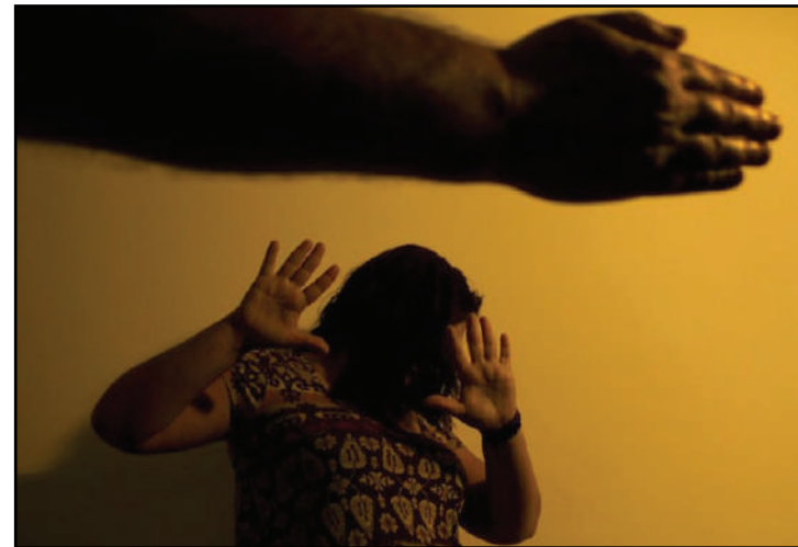
São 3.739 homicídios dolosos de mulheres no ano passado