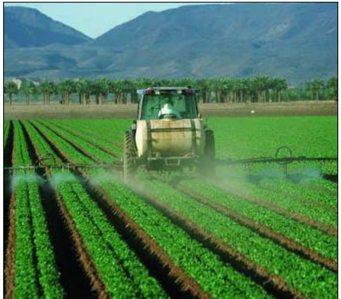
Região tem plantio diversificado, além de 5 indústrias frigoríficas

O Governo Estadual anunciou em fevereiro des-