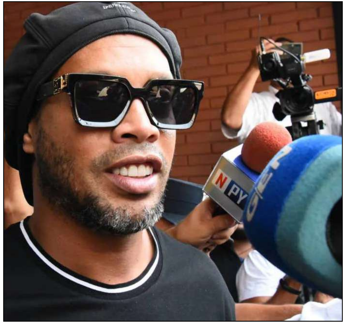
Ronaldinho e Assis foram investigados por uso de documento falso

Ronaldinho, nomeado pelo presidente Jair Bolsonaro como Embaixador do Turismo, foi detido na noite de quarta (4) no hotel em que está hospedado em Assunção, no Paraguai. Ele e seu irmão são investigados pelo Ministério Público por suspeita de uso de passaportes e documentos de identificação paraguaios falsos.