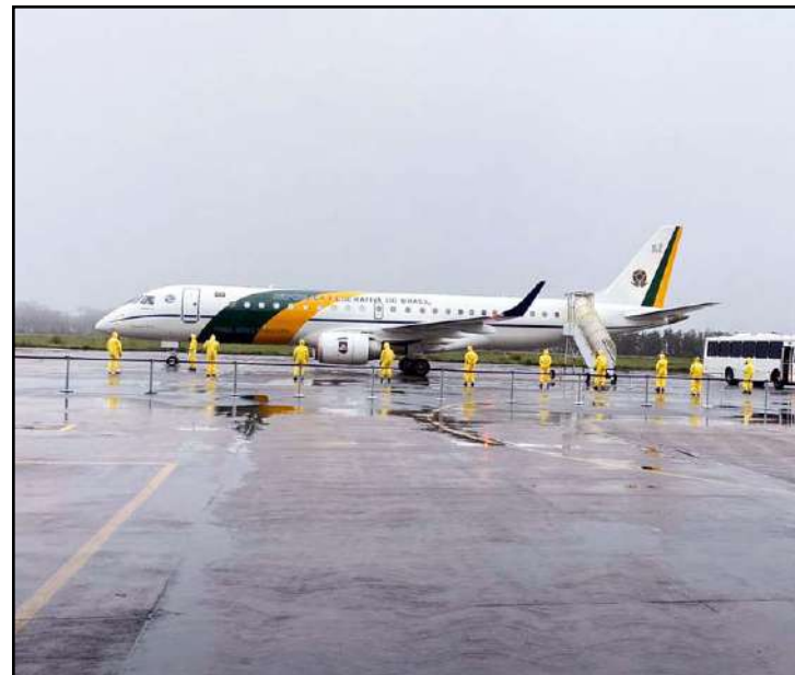
Ministro da Defesa pode autorizar benefício

Ele tem cinco dias para devolver a medida para passar pela primeira votação. Ao todo, para passar a valer, são necessárias duas votações.