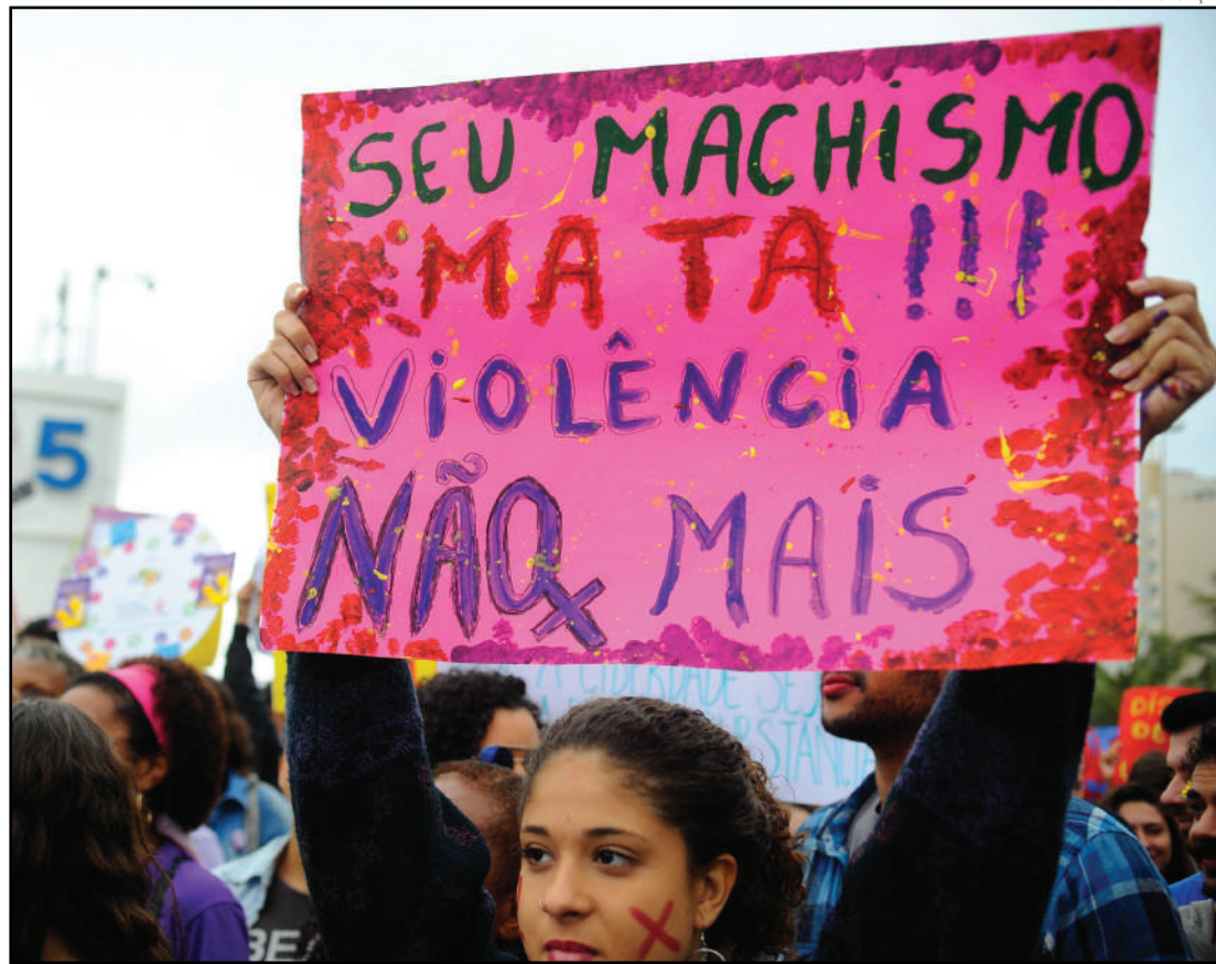
Frases machistas existem em diferentes idiomas...

Também na Alemanha, quando uma garotinha se machuca ainda dizem “quando casar passa” – como se o casamento fosse eliminar to-