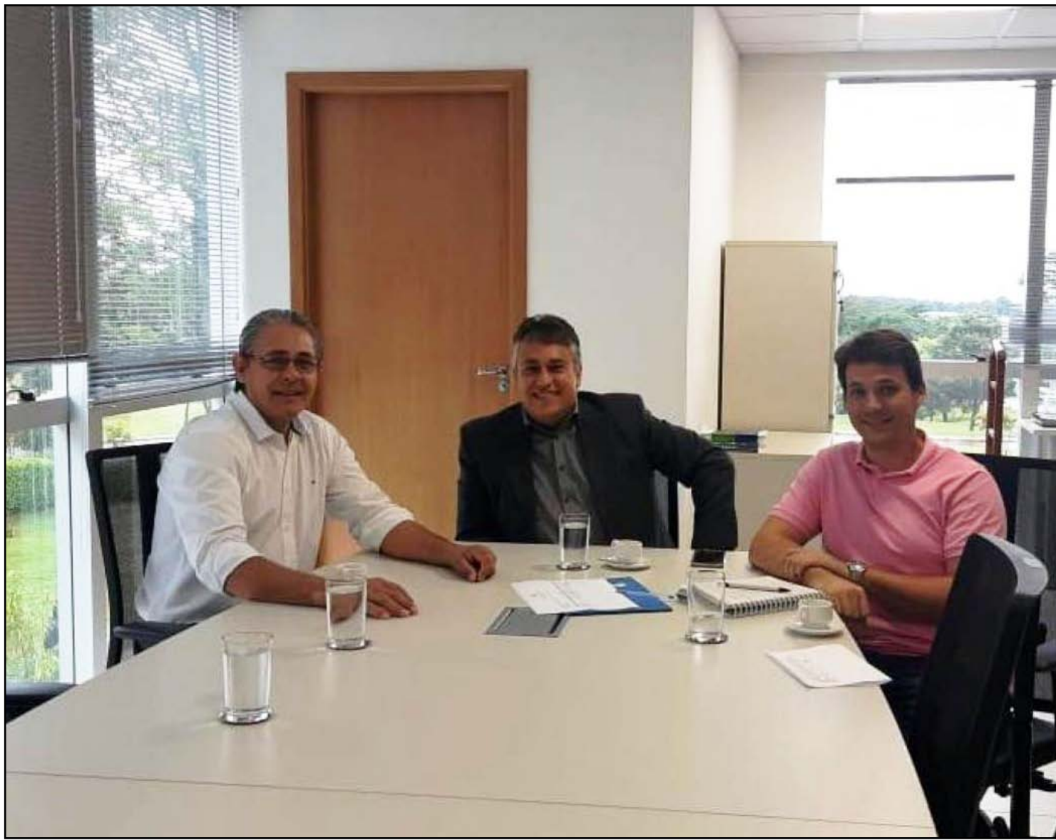
Obra deve custar R$ 8 milhões

iniciar o processo licitatório o quanto antes. O termo de fomento que prevê os recursos para a execução das obras já está na Secretaria de Aviação Civil – SAC e aguardamos os trâmites legais para podermos fazer a licitação”, explica. Com as obras concluídas, há a expectativa para que o aeroporto possa receber novas modalidades de aeronaves, como os Embraer 190, 195 e similares. “Prefeitura e o ministério da Infraestrutura celebraram um termo de compromisso para a realização de obras de reforço e recuperação da pista de pouso e decolagem (PPD 05/23), taxiway e pátio de aeronaves do Aeroporto Regional Adolino Bedin no valor de obra é de R$ 8.090.983,95 que será totalmente repassado pelo Minfra ao município”, explica. Com a ampliação, o aeroporto terá um reforço na ampliação da segurança das operações, como também da vida útil do pavimento, com previsão de durabilidade de 20 anos. As obras serão executadas de acordo com o projeto de revitalização, recuperação e sinalização horizontal da pista de pousos e decolagens elaborado pela Infraero e entregue ao município em 8 de novembro de 2019.