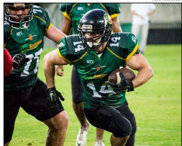
Início previsto para abril

Assim como Cuiabá Arsenal e Sorriso Hornets, as equipes do Sinop Coyotes e Rondonópolis Hawks, que preferiram não disputar o Estadual 2020, estão garantidas no Brasileiro de Futebol Americano – Centro-Oeste 2020, com início em julho.