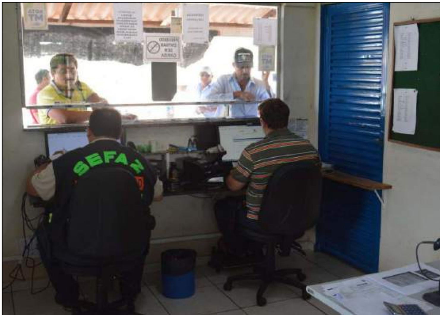
Estrutura ficou pequena para número de caminhões que trafegam sentido Norte

O proprietário do local, alegando precisar de segurança e garantia no