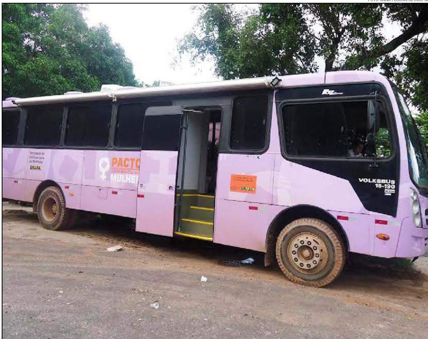
Ônibus Lilás percorrerão 26 cidades ao longo do ano

Pintados na cor lilás, os veículos são equipados com salas fechadas para garantir privacidade às mulheres, com modelo de atendimento multidisciplinar com assistência psicossocial e jurídica para as vítimas de violência.