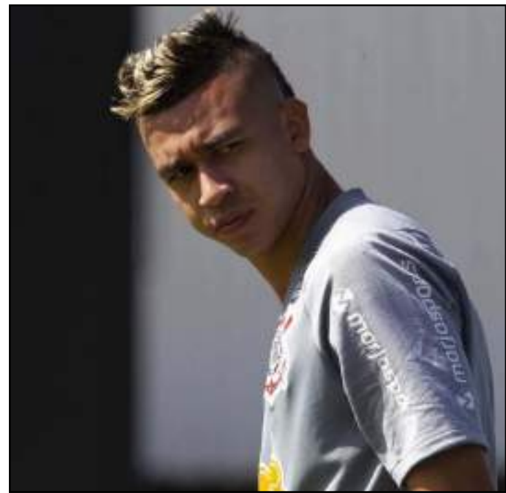
Cantillo vem sendo um dos destaques do Corinthians