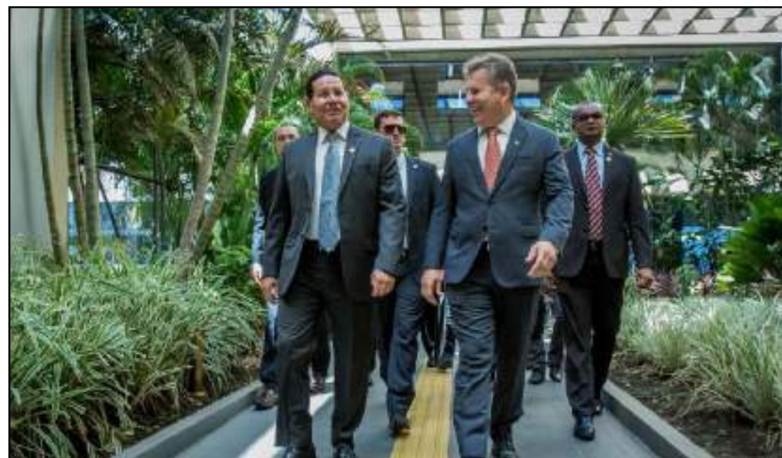
“É preciso haver cobrança ostensiva de ativos ambientais”

“O que ocorreu de pagamento de compensação por esses créditos foi praticamente nada até agora. Mas é muito difícil agirmos sozinhos porque precisamos da liderança do Governo Federal, que é determinante. Assim poderemos exigir essa