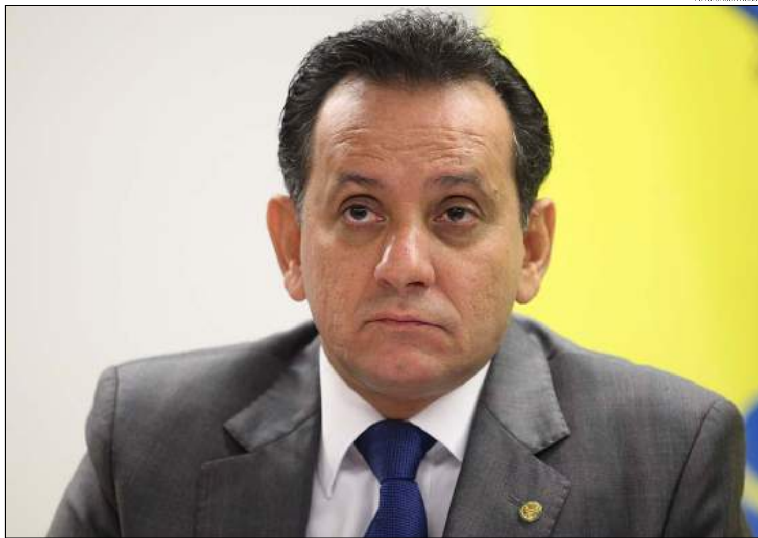
Câmara de Vereadores recebe convenção tucana

“Será uma eleição onde terá uma maior qualidade de tempo e vai poder falar direito com o eleitor. Em 2018 o voto foi muito terceiriza-