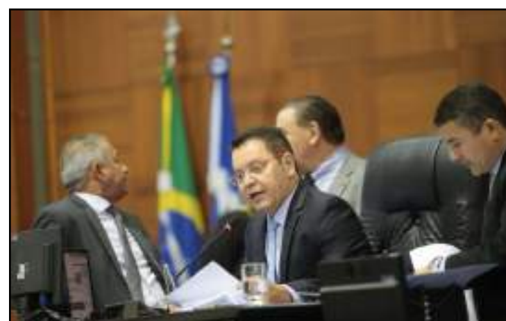
Votação final deve ocorrer em 28 de abril