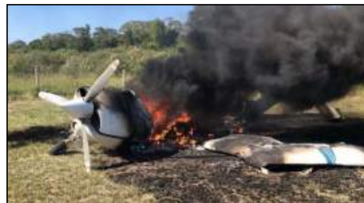
Avião foi interceptado pela FAB