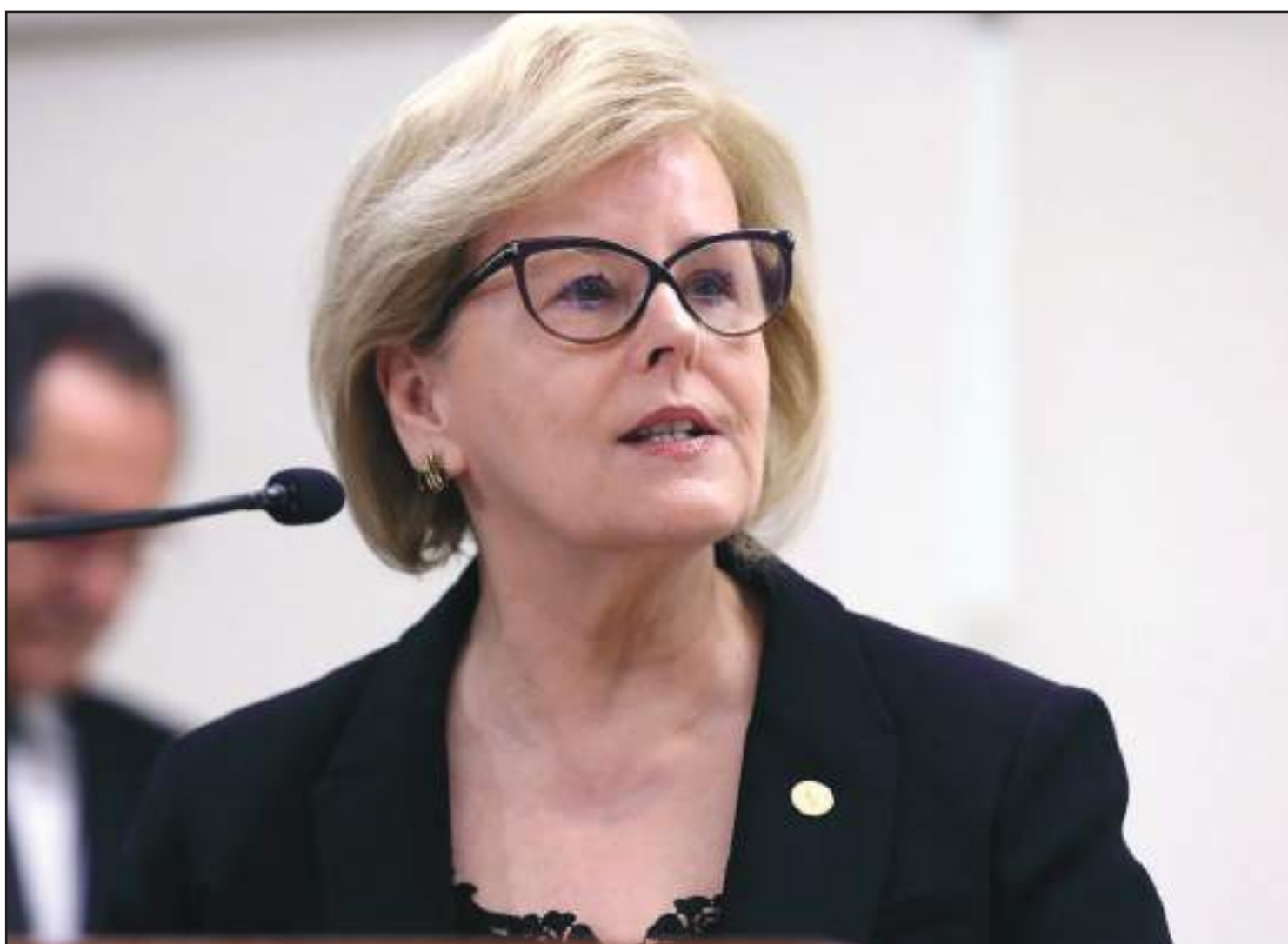
Eleição suplementar deve ser acoplada às municipais

E muito obvio que ele proliferaria no país. Lá atrás eu enxerguei. Que bom, ou que lamentável, que outros estejam enxergando agora o que eu enxerguei há 15 dias", declarou.