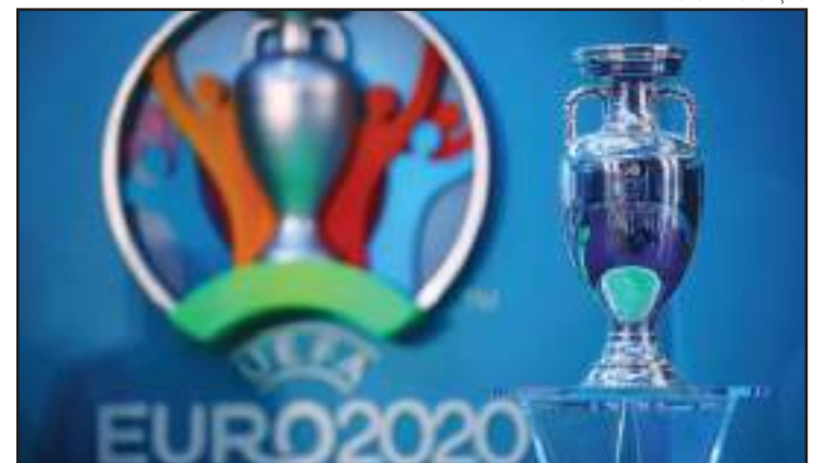
Taça da Euro 2020 durante evento da Uefa