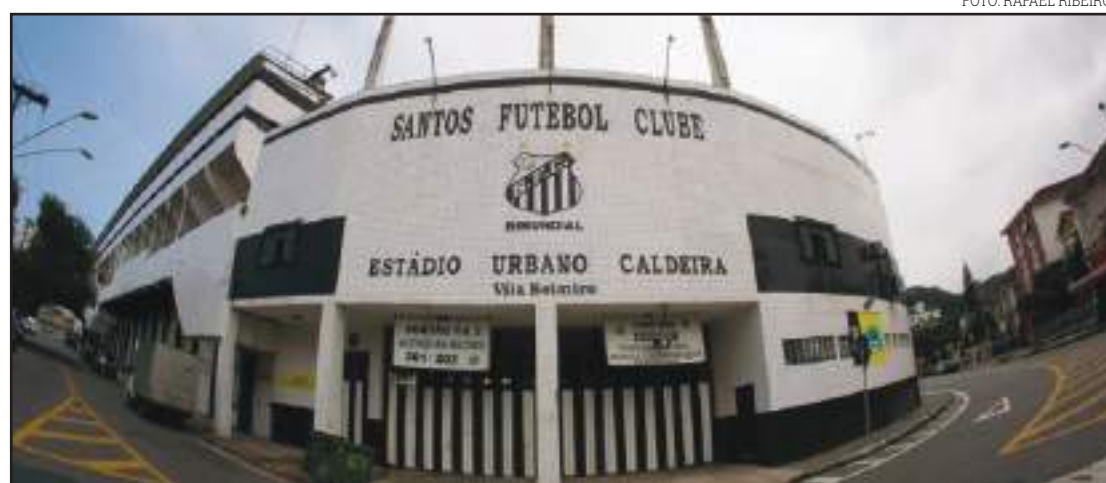
Santos "comemora" perda de sócios com cadastro incompleto

A medida do Alvinegro tem efeito de segurança pois evita fraude com voto de ca-