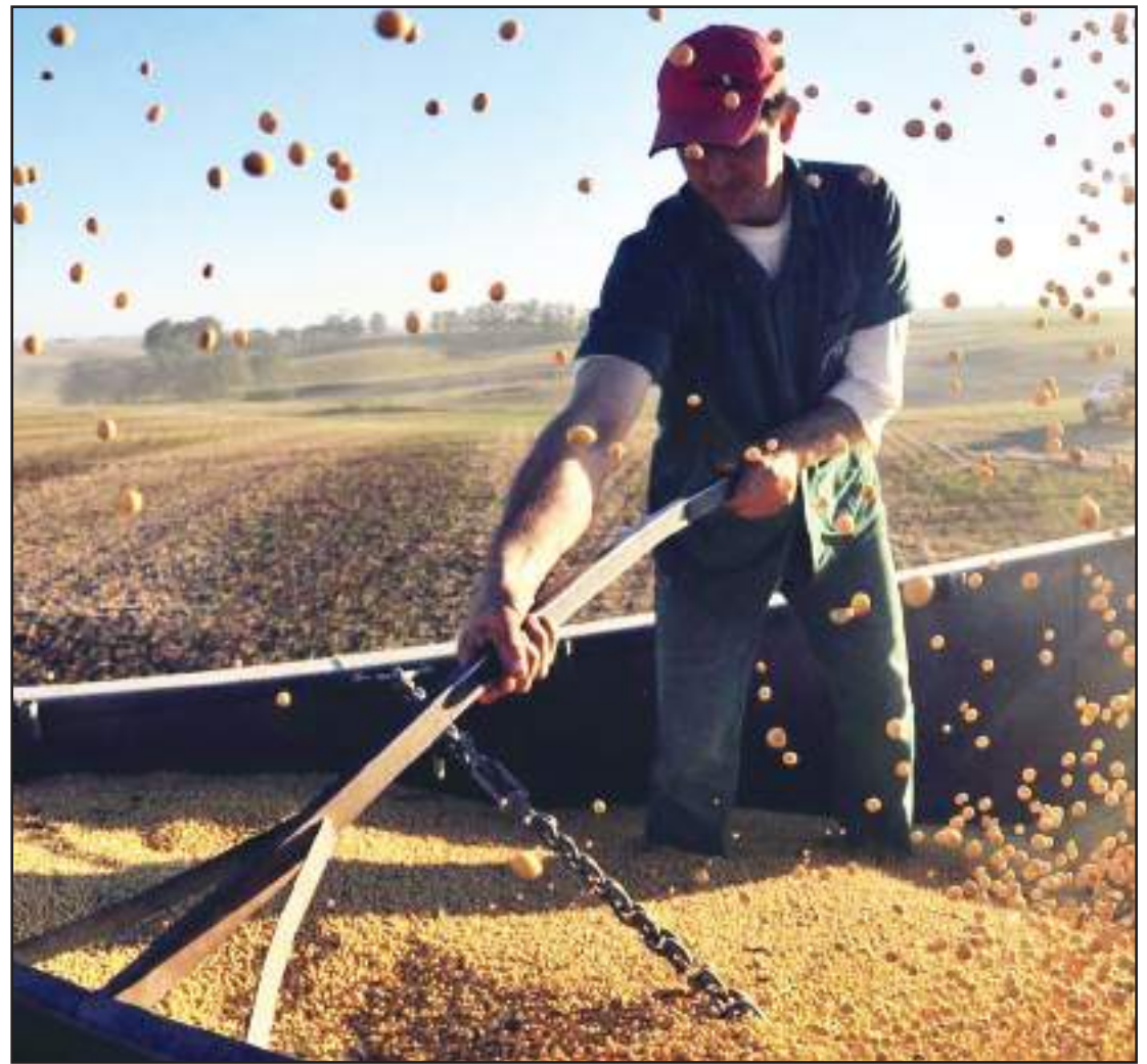
Safra deve ter um ganho de 9,9 milhões de toneladas

A safra de arroz deve apresentar redução de 2,4% na área cultivada (1,6 milhão de hectares) e produção de 10,5 milhões de toneladas, 0,8% acima da obtida em 2018/19.