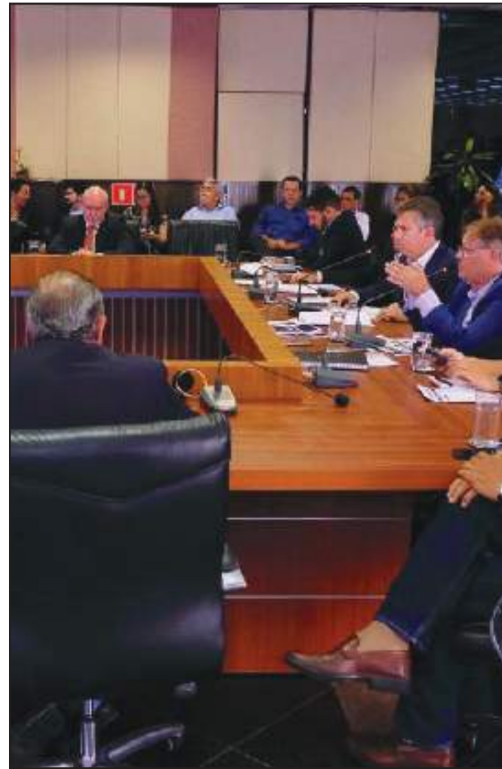
Medidas devem ser seguidas pelos servidores públicos