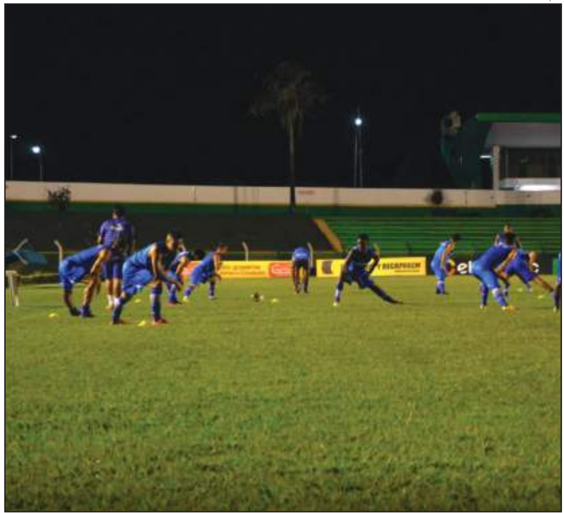
Sinop terminou primeira fase na 4ª posição

Os outros dois duelos das quartas: Dom Bosco e Operário jogam sábado (21), às 17h, pelo jogo de ida, na Arena, enquanto a volta será no Dito Souza, quarta, às 20h. Poconé e União Rondonópolis iniciam o duelo no sábado, às 15h, no Neco Falcão, enquanto a volta será quarta, às 20h, no Luthero Lopes.