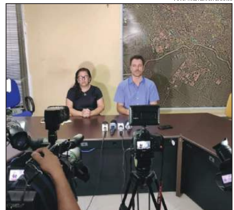
Prefeitura confirma que caso é "positivo real"