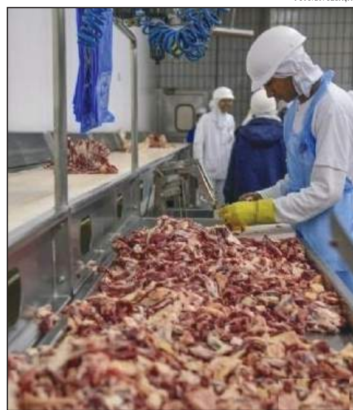
Sindicato recomendou férias coletivas por prevenção contra coronavírus

A empresa afirmou que foi determinada a restrição do acesso de visitantes, suspensão de viagens internacionais, entre outras medidas, como oferecimento de acompanhamento de saúde a funcionários e seus familiares.