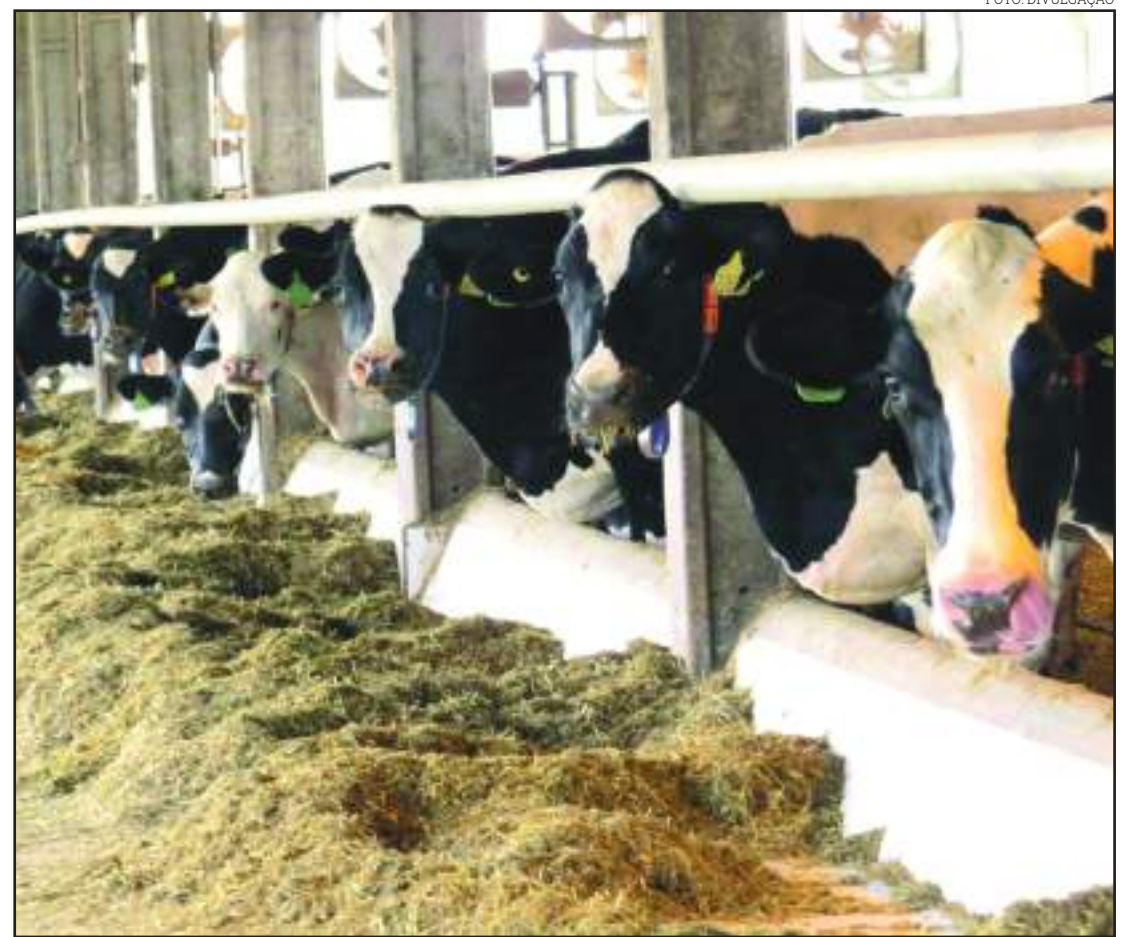
Produtor conseguiu melhorar significativamente desempenho da propriedade

Os números coletados em dezembro também evi-