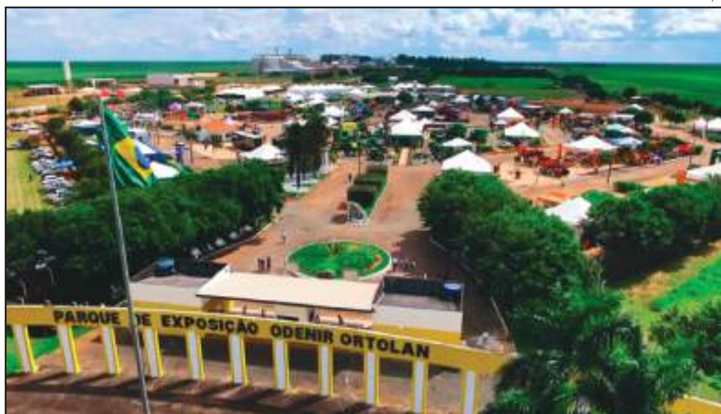
Ainda não foi informada a nova data de realização do evento

No Mato Grosso, diversas medidas foram tomadas para tentar conter a transmissão da doença: escolas municipais e estaduais tiveram aulas suspensas, cirurgias eletivas foram adiadas, presídios reduziram as visitas aos presos e eventos com mais de 200 pessoas foram suspensos.