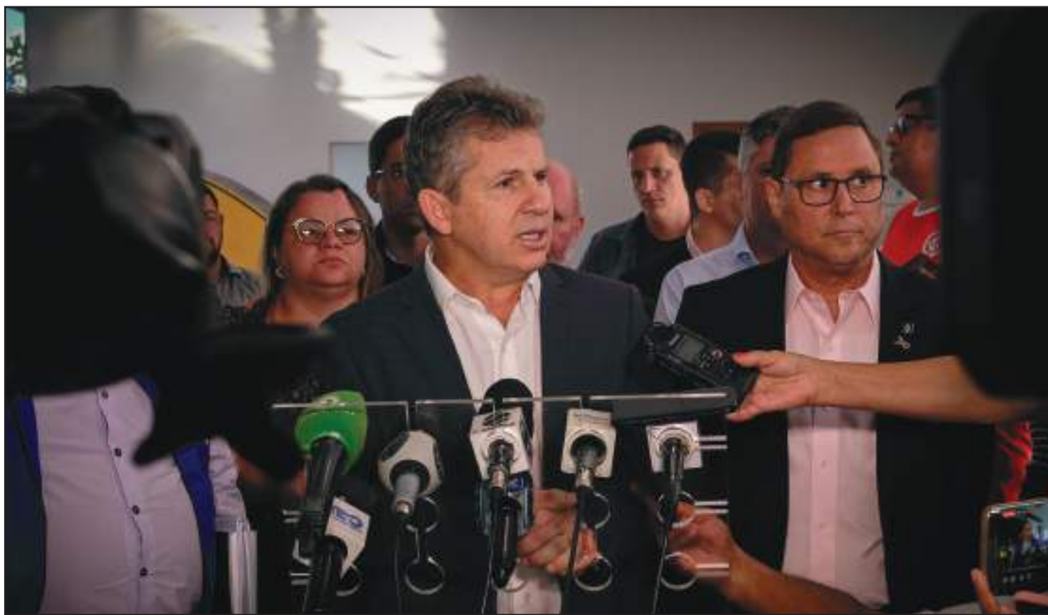
Governo classificou o deputado como "irresponsável"