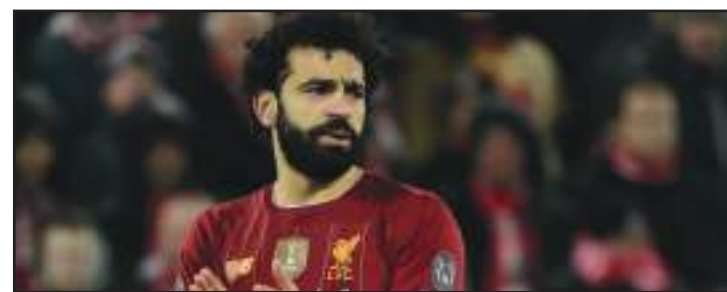
Liverpool de Salah deve ser campeão incontestável