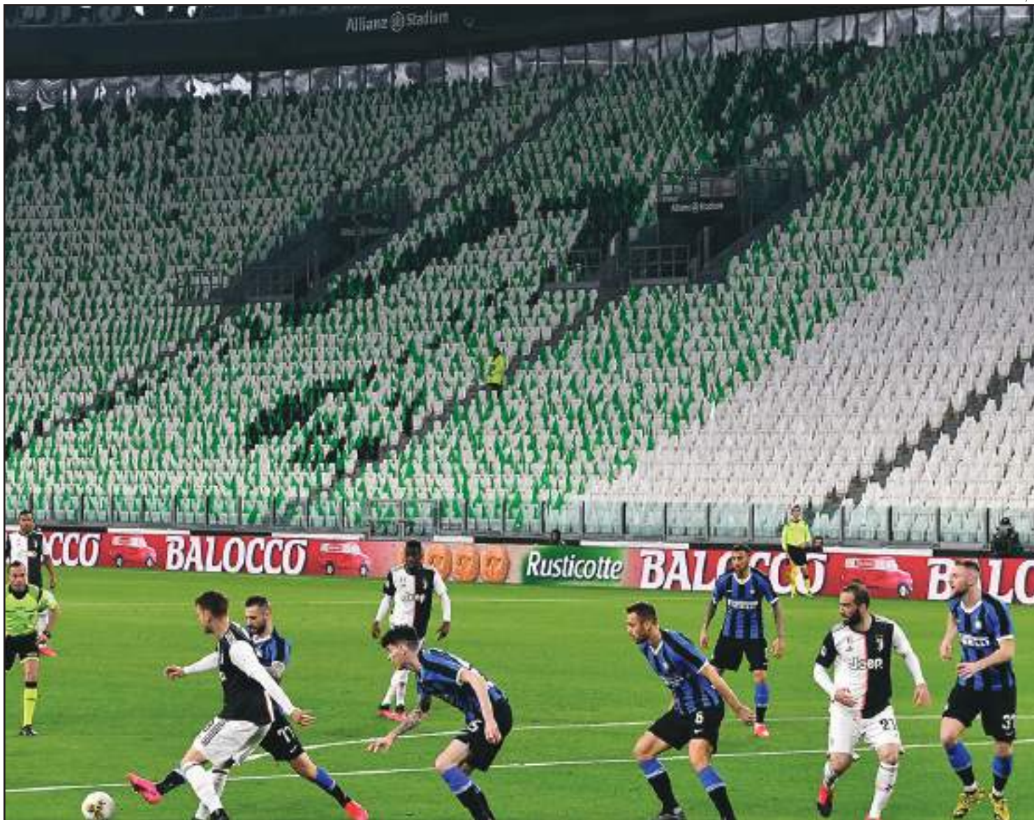
Cadeiras vazias em jogo na Europa: agora, tudo foi paralisado

e 1946, que nunca foi atribuída a alguma sede devido à Segunda Guerra Mundial (1939-1945), um conflito que também provocou o cancelamento das edições de 1940 e 1944 dos Jogos Olímpicos. Com a exceção da Inglaterra, os principais campeonatos europeus continuaram suas atividades durante esse período. Exceto na temporada 1939-1940, devido à invasão alemã do país, na França o campeonato sempre foi disputado. Na Itália, houve futebol até 1943 (a competição voltou em 1945) e, na Alemanha, até 1944 (voltou em 1947). “Havia uma vontade de animar as pessoas, de se divertir, até que não foi mais possível. A ideia para as autoridades era mostrar que a situação estava controlada, normal”, explicou Dietschy. É preciso voltar até os tempos da Primeira Guerra Mundial para ver os grandes países do futebol se privarem da bola por vários anos, mas, naquela época, o esporte “não estava desenvolvido como em 1939 ou hoje”. “O sentimento patriótico também era muito forte, o que facilitava na decisão de suspender as atividades”, completou o historiador. Na Itália, o início da temporada 1973-1974 foi adiado devido a um surto de cólera em Nápoles, mas nada que se possa comparar à atual pandemia do coronavírus.