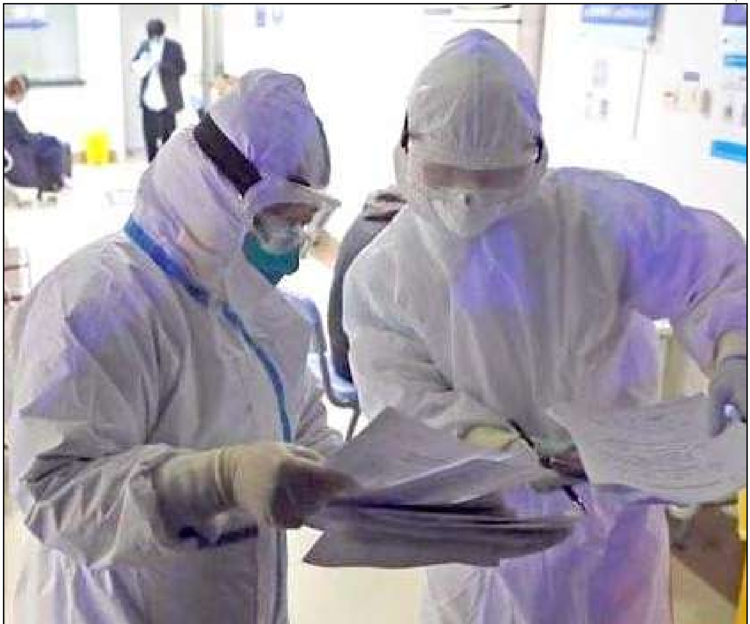
Estimativa por feita por virologista espanhol