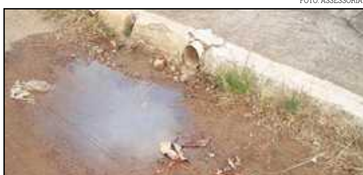
Dependendo da gravidade da infração, multa pode chegar a R$ 26 mil

juízos para os cofres públicos. Ao jogar água nas ruas, formam-se poças, que possivelmente vão se transformar em foco de proliferação para várias doenças, entre elas, febre amarela, dengue, diarreia, cólera. O Código de Vigilância Sanitária do Município de Lucas do Rio Verde (Lei Municipal Complementar nº 119, de 21 de dezembro de 2012) trata o assunto e dispõe sobre as penalidades para quem cometer essas ações. Dependendo da gravidade da infração e levando em conta a complexidade de cada caso, as multas podem