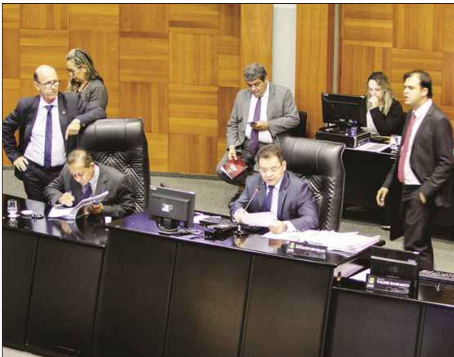
Plenário decide sobre contratação de empréstimo junto ao Banco Mundial