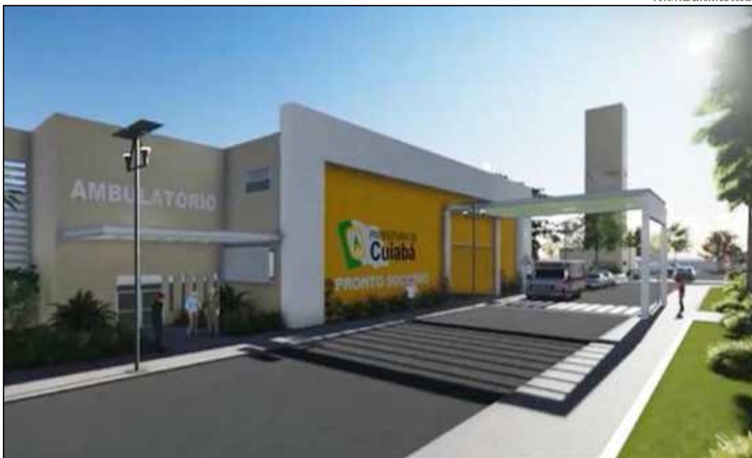
Verba deverá ser viabilizada com governos federal e estadual