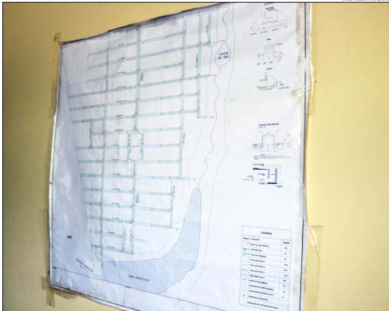
Planta do Camping está disponível no escritório do empreendimento

IV – Não há necessariamente uma unanimidade, até porque tem moradores que questionam, que não têm condições de pagar, que quer que a Prefeitura faça de graça...mas, dada a natureza do empreendimento, que é loteamento fechado, prevê que, a exemplo dos condomínios, toda obra de infraestrutura interna é rateada entre os proprietários, proporcional à sua fração, às suas frentes. Por isso que tem diferença. Um destaque especial para lotes de esquina, cujos valores são um pouco mais elevados. Então, cada um dentro da sua realidade. O preço médio do metro quadrado é de R$ 100. Teve um desconto para quem pagou à vista (R$ 85) e tem um preço a prazo de R$ 136. Na média vai dar em torno de R$ 100/m². Esse valor é para quem paga à vista, antes de receber a obra, inclusive. A pavimentação asfáltica do Camping Club está prevista para retomar até o final de abril, início de maio. Neste período de chuva a gente não mexe com asfalto. Perde qualidade. Nós paramos ainda em novembro porque foi atípico, em comparação com o ano anterior. Começou a chover em novembro, é forte. O trecho da drenagem, base e sub-base, da Avenida