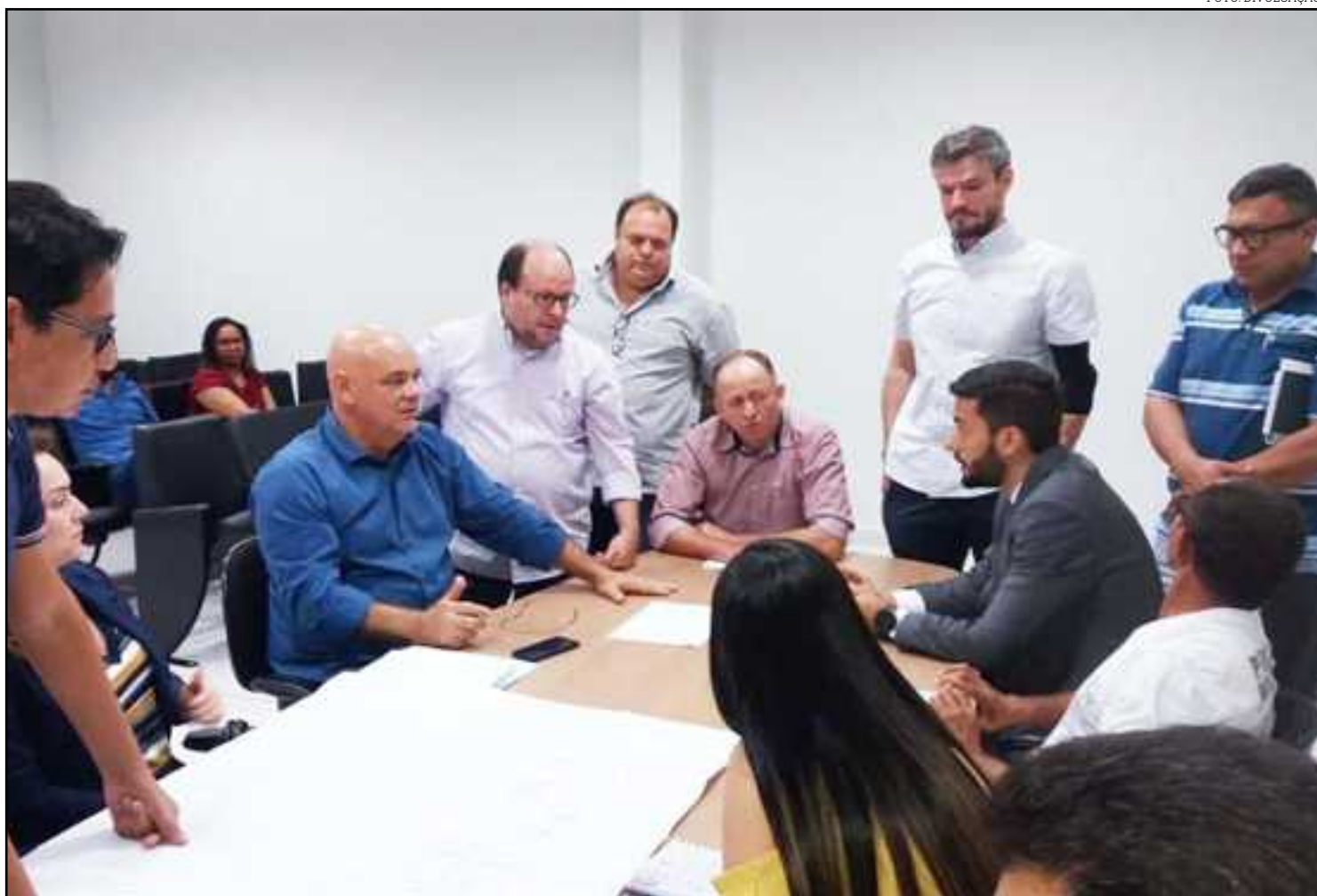
Autoridades discutem implantação da nova delegacia municipal