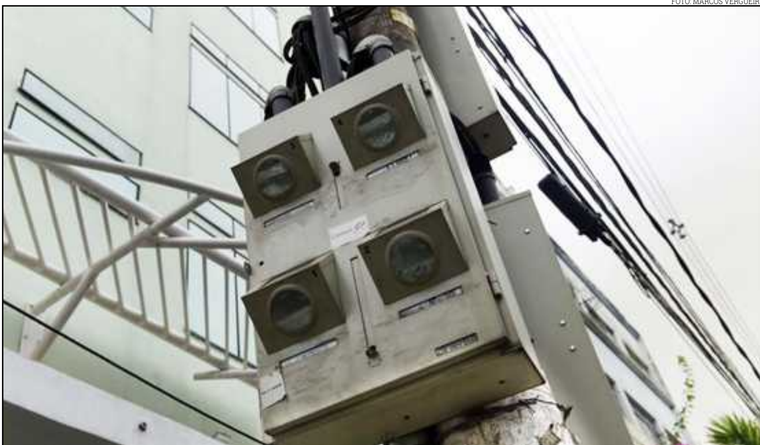
Compra foi impulsionada pelo aumento no consumo, segundo diretor de distribuidora

No entanto, segundo Barbanera, para amenizar o impacto da tarifa na conta do consumidor, são retirados os encargos setoriais, que correspondem a 2,31%. Logo, essa conta toda implica num reajuste tarifário de 11,29%. Dessa forma, segundo a concessionária, o impacto deste percentual na fatura de energia vai ser maior ou menor, de acordo com o comportamento de consumo de casa cidadão.