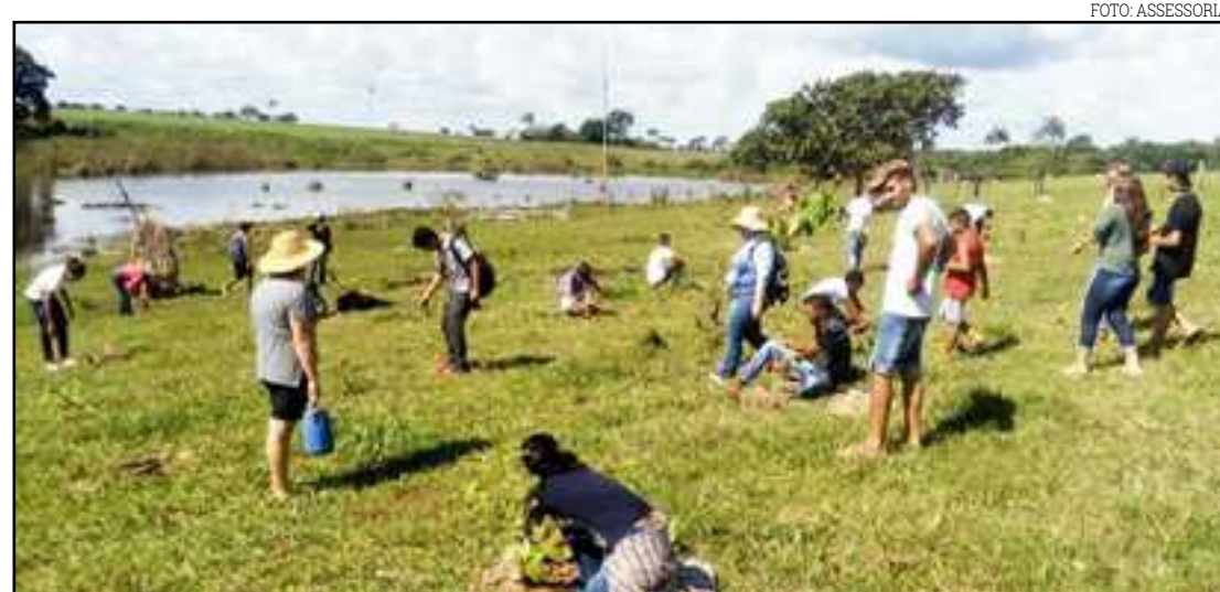
Ação compreende uma das últimas fases de projeto em comunidades rurais

De forma gradativa, a recuperação de áreas degradadas também chegará às comunidades Casulo, em Santa Carmem, 12 de outubro, em Cláudia, e Wesley