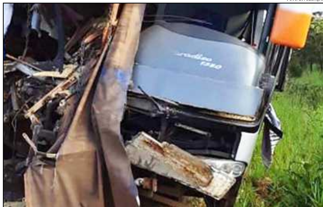
Carga transportada por carreta se espalhou pela rodovia

A pista foi interditada e a PRF permaneceu no local dando sequência ao atendimento da ocorrência. Imagens divulgadas mostram como os veículos ficaram completamente destruídos após a colisão. A carreta transportava soja, que ficou espalhada pela rodovia. Ainda não se sabe o que motivou o acidente.