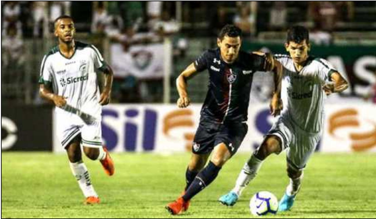
Ganso e atacantes não brilham e mexidas não mudam panorama