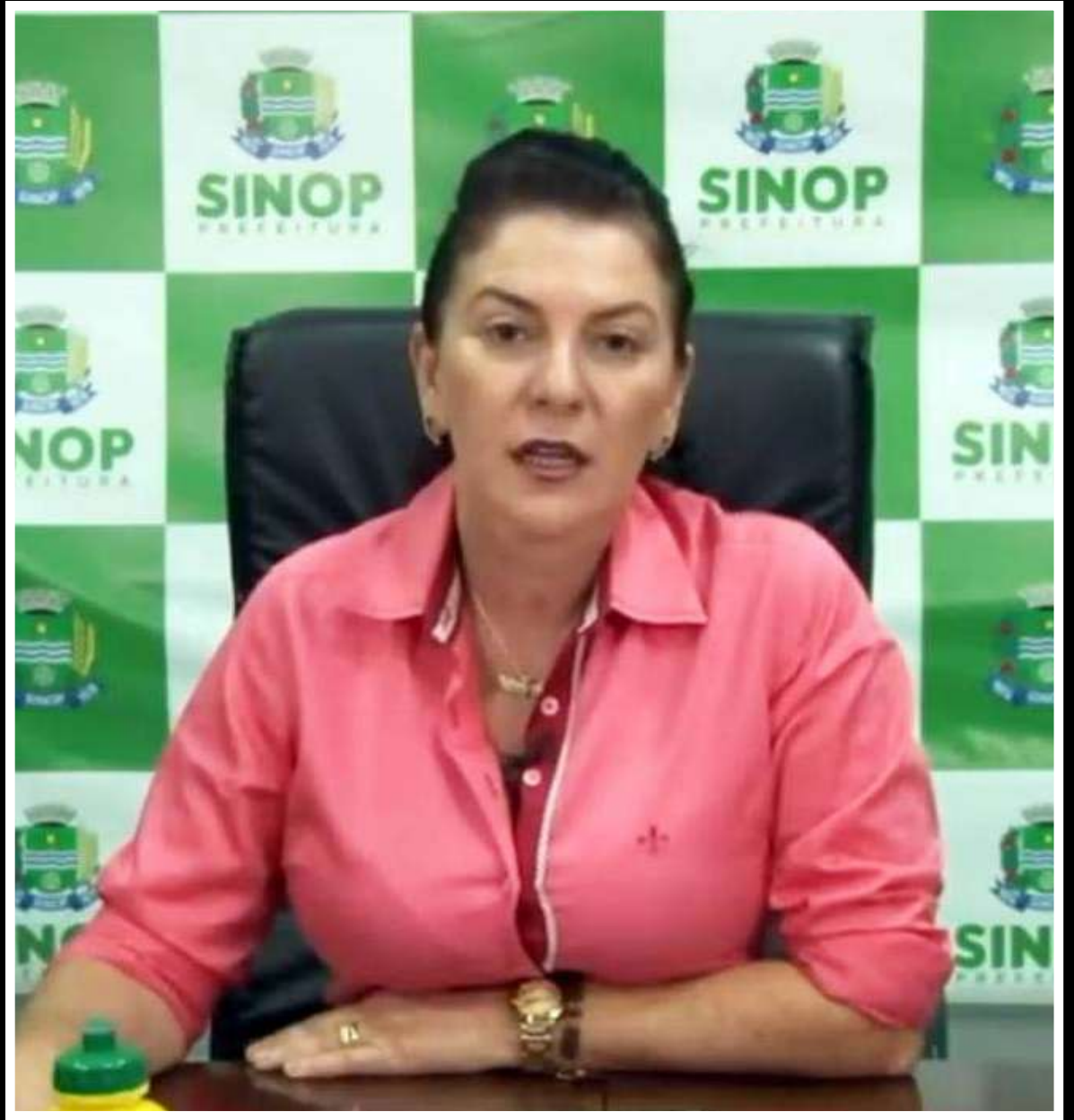
Um dos casos é considerado grave

A publicação falsa em questão apontava quatro casos confirmados em Sinop, o que acabou causando muita preocupação nos moradores.