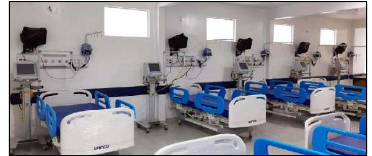
HR Alta Floresta inaugura 10 novos leitos de UTI