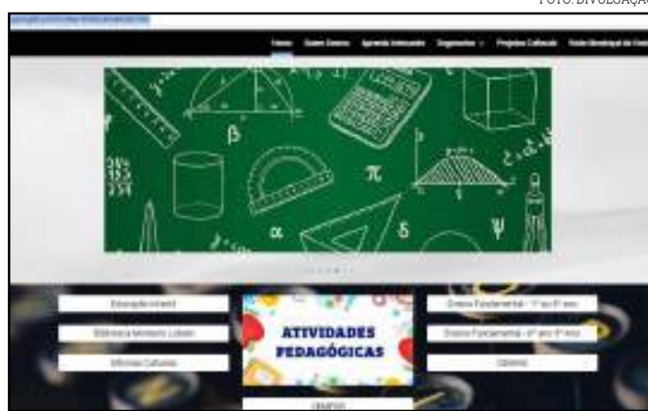
Mesmo com a pandemia, alunos não ficam sem aprender

“O vírus é invisível, em alguns casos quem pega não apresenta sintomas, então podemos estar com o coronavírus e não saber, a única forma de nos proteger e pro-