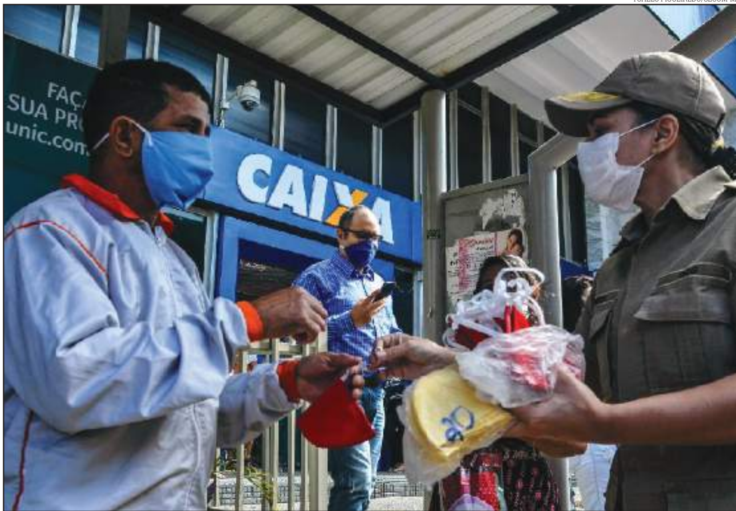
MT foi o primeiro do país a adotar a medida*

Em algumas partes da Ásia, o uso da máscara tem sido padrão, por exemplo, na China continental, Hong Kong, Japão, Tailândia, Taiwan, Coreia do Sul e Singapura.