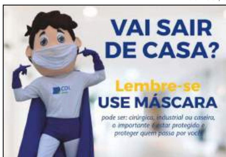
Algumas empresas estão oferecendo máscaras aos clientes