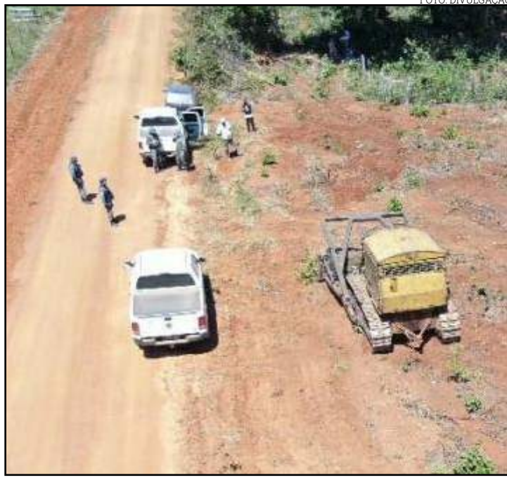
Em uma propriedade, o desmatamento ilegal foi paralisado pela equipe

As atividades de fiscalização ocorrem dentro do Plano de Ação de Combate ao Desmatamento Ilegal e Incêndios Florestais 2020. O plano prevê a aplicação de R$ 64 milhões em seis frentes de atuação: plane-