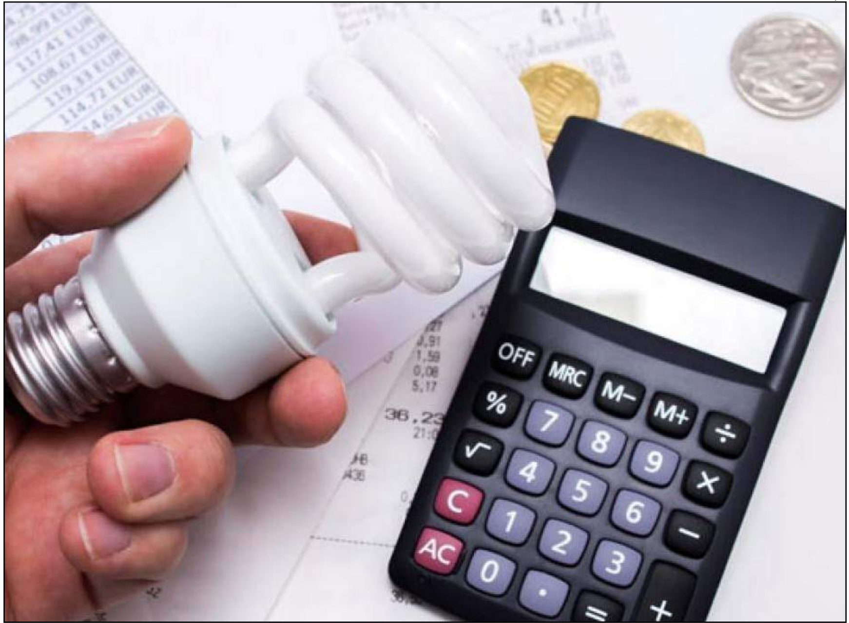
PL aguarda sanção do governador

A medida precisa ser sancionada pelo governo do estado para ser publicada e começar a valer.