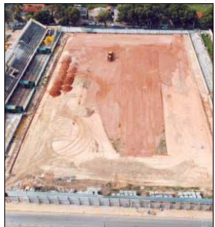
Entrega é prevista para fim de 2020