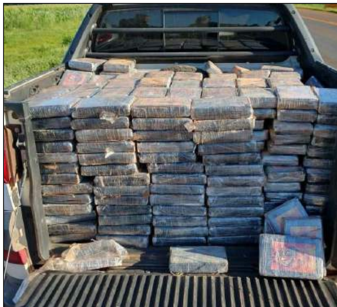
Mais de 500 kg de cocaína foram apreendidos na ação

A sociedade pode contribuir com as ações da Polícia Militar de qualquer cidade do Estado, pelo 190, ou, sem precisar se identificar, por meio do disque-denúncia 0800.65.3939. Nesse número, sem custo de ligação, qualquer cidadão pode informar situações suspeitas ou crimes.