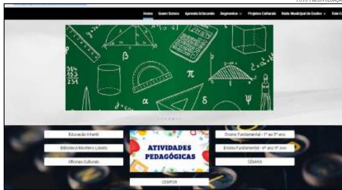
PM foi chamada e prendeu o suspeito em Rondonópolis

A vítima conseguiu acionar a Polícia Militar, mas enquanto ligava para o 190, o marido tomou o celular das mãos da mulher e o quebrou.