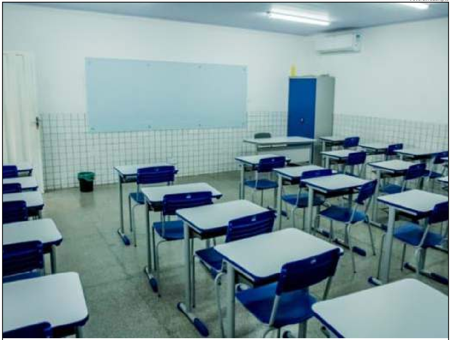
Salas vazias: ainda realidade em Mato Grosso

Além disso, apesar da suspensão, atividades não-presenciais estão sendo disponibilizadas aos alunos na plataforma digital da Secretaria de Estado de Educação (Seduc). Aos estudantes que não possuem acesso à internet, a Seduc tem encaminhado apostilas.