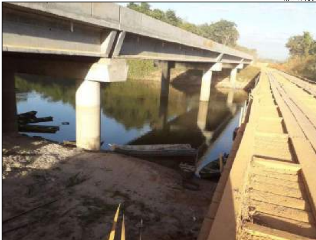
Ponte na rodovia MT-242, sobre o Rio Sangue I, entre Juara e Brasnorte

RODOVIAS ESTADUAIS Foram concluídas as obras de mais três pontes de concreto nas rodovias MT-322, 110 e 242