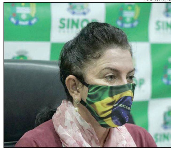
Rosana anunciou projeto de lives culturais